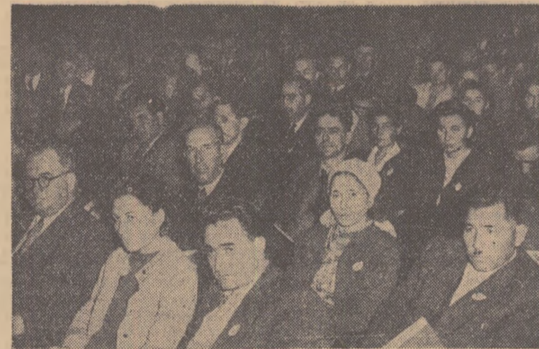
Aspect din sala Congresului

Pentru o mai deplină dezvoltare a Teatrului de Operă și Balet trebuie creată o C.C. al Sindicatului Muncitorilor din Învățămînt și Cultură nou ales și Ministerul Învățămîntului și Culturii să dea un ajutor conform cu specificul problemelor de operă și cu