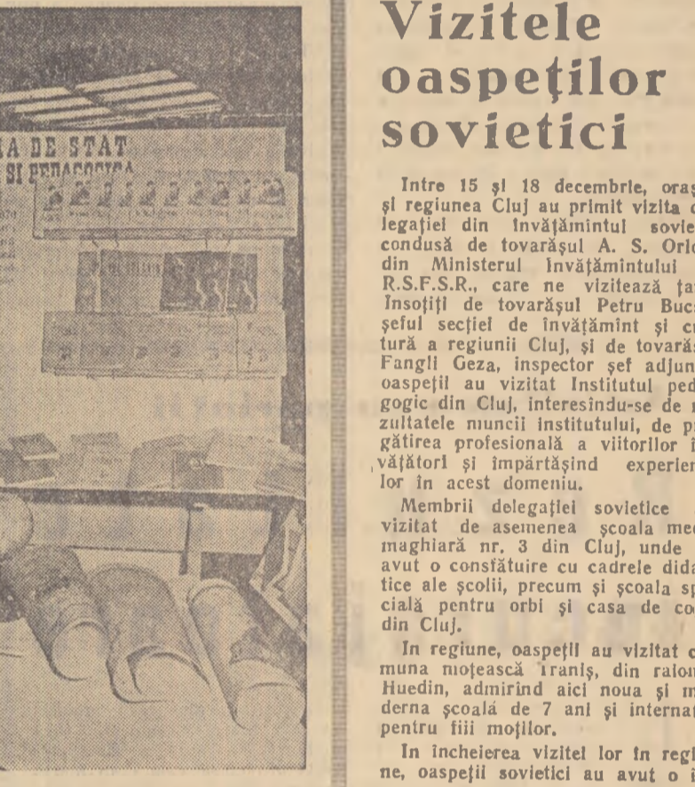
Standurile Editurii tineretului și ale Editurii de stat didactice și pedagogice din „Expoziția cărții”.