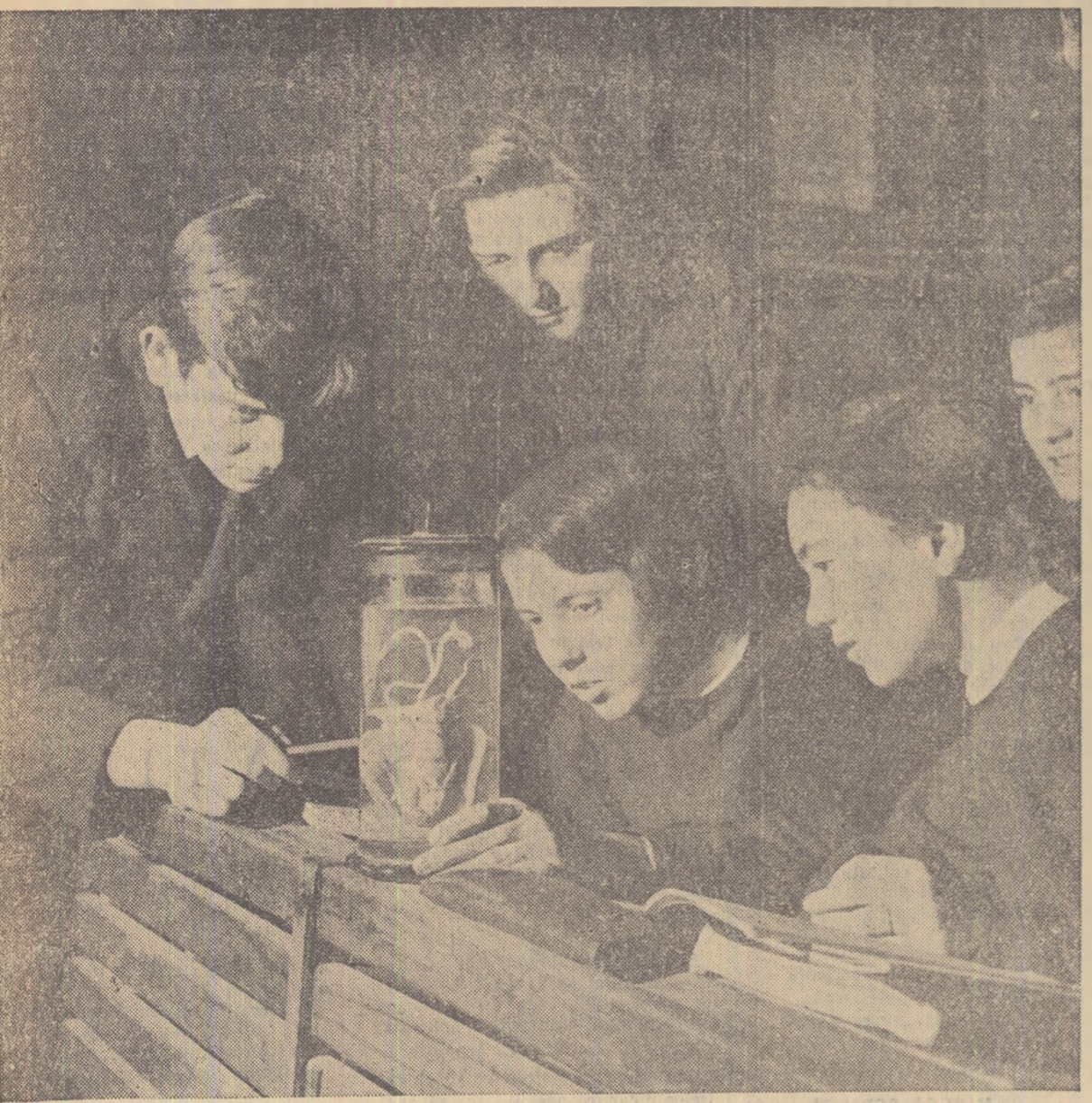
Înaintea orei de zoologie, la școala nr. 21 din București cu limba de predare germană