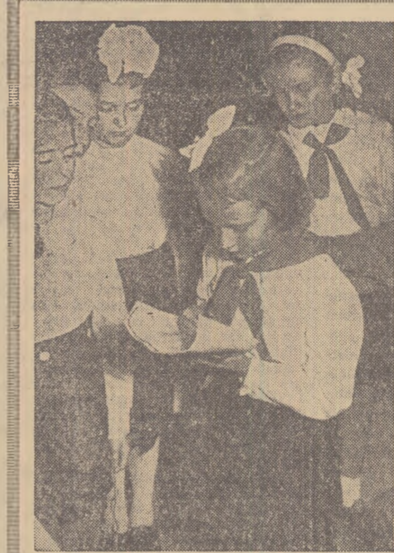
„Eu, tînr pionier al Republicii Populare Romine, mă gîndesc...”

Studiind și însușindu-și marea bogăție de idei cuprinsă în documentele Consfăturii de la Moscova ale reprezentanților partidelor comuniste și muncitorești și în expunerea tovarășului Gh. Gheorghiu-Dej, cadrele didactice vor putea contribui cu mai bune rezultate la marea operă de construire a socialismului și apărare a păcii.