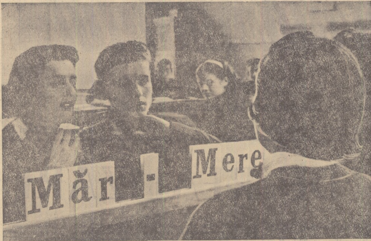
Ora de vorbire la școala specială de surdomuși din București