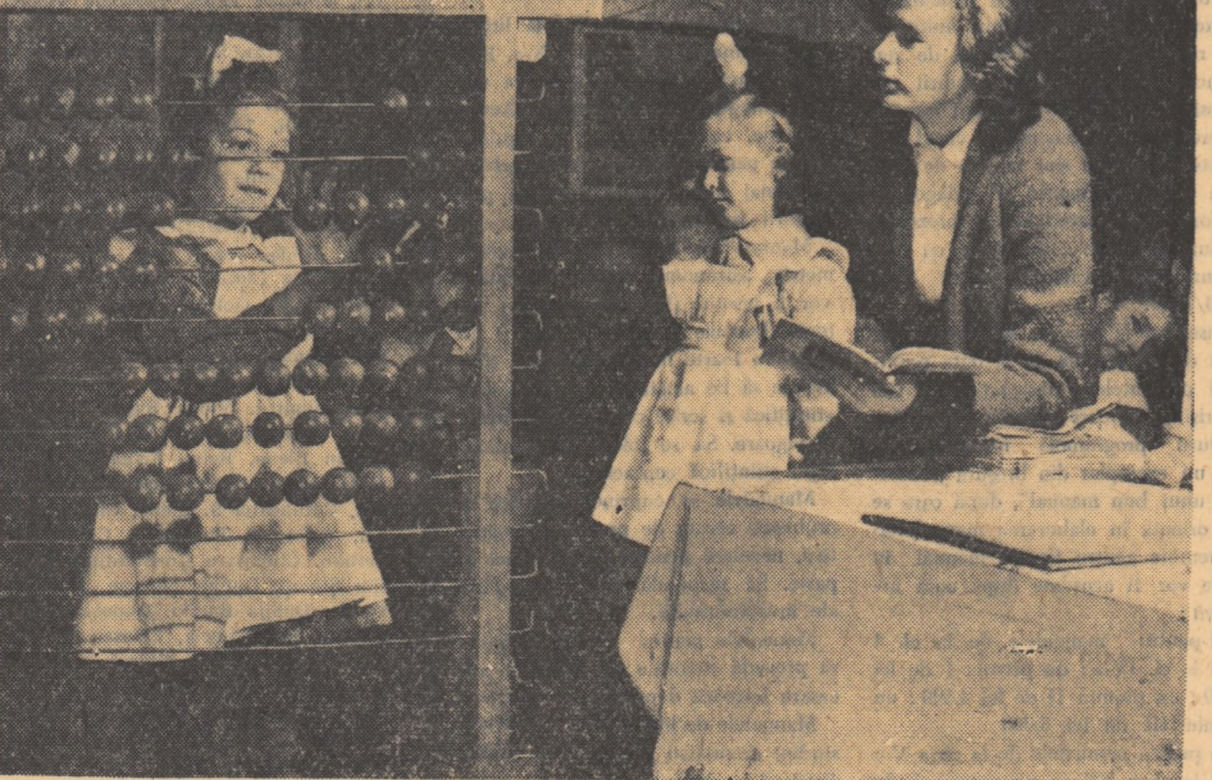
Ce însemnătate are lecția de aritmetică atunci cînd se lucrează cu mașina se socotit