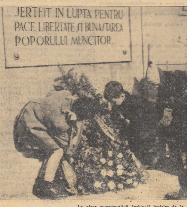
La placa comemorativă închinată luptelor de la Grivița