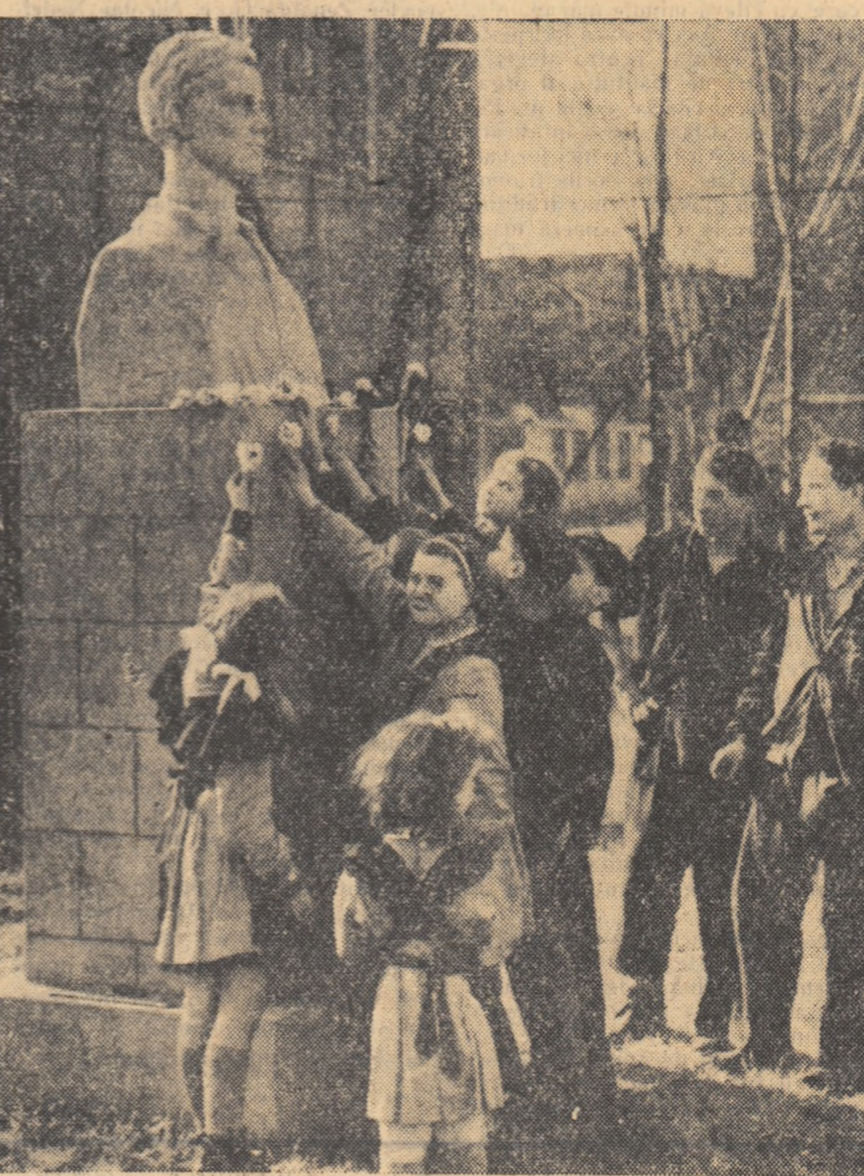
Elevii școlilor din Capitală depun flori la monumentul lui Vasile Roaită