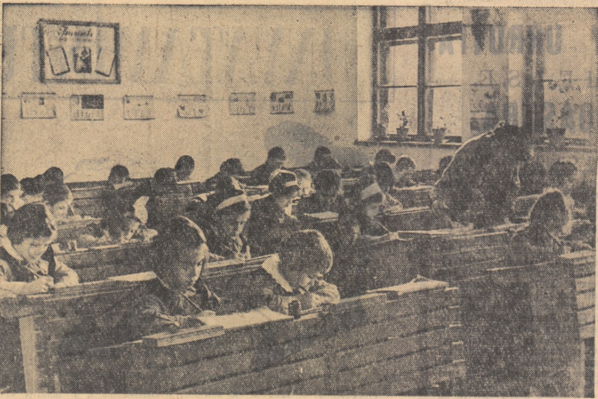
La școala de 7 ani nr. 110, recent construită de statul popular al raionului V. I. Lenin din București. În ora de dictare