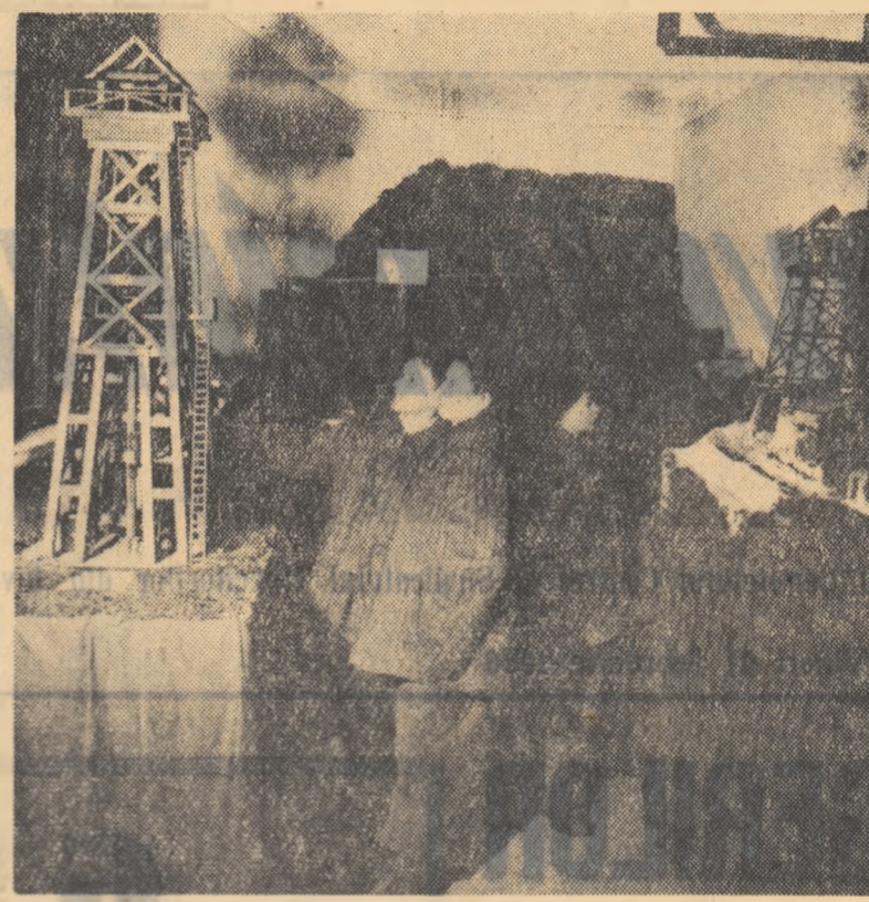
Ca ocazia centenarului industriei petrolifere, la clubul „M. Eminescu” din noua orașă Lucacea s-a deschis o expoziție ilustrînd aspecte din istoria extragerii petrolului. Elevii din localitate vizitează cu interes expoziția.