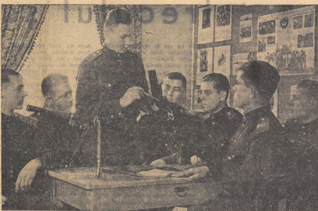
Studierea mitralierei în cadrul unei grupe din Divizia „M. Kalinin” din Taman

La 23 februarie, Armata și Flota Maritimă Militară Sovietică împlinesc patru decenți de glorioasă existență. Forțele Armate Sovietice au fost create după Marea Revoluție Socialistă din Octombrie pentru apărarea primului stat socialist din lume, împotriva căruia se ridicau plin de ură imperialiștii de pretutindeni și gările albe contrarevoluționare. Încă de la început Armata Sovietică, puternică prin conștiința ei revoluționară, prin devotamentul ei neîmămurit pentru cauza socialismului, s-a afirmat ca scut de nădejde al tineretului sovietic. La 23 februarie 1918, la Pskov și Narva, ea a dat lovitură nimicitoare invadatorilor imperialiști germani, burlându-le drumul spre leagănul revoluției — Petrograd. Ziua acestor prime victorii a devenit ziua de naștere a Armatei Sovietice.