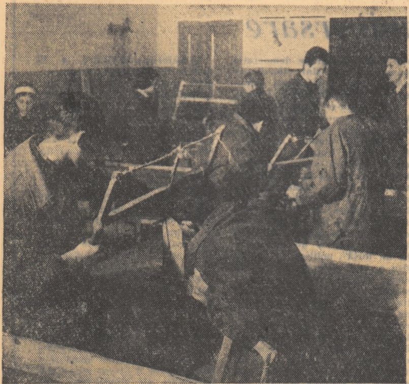
Una din orele de lucru manual la școala medie „C. Caragiale” din București