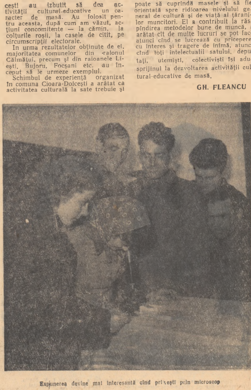
Expunerea devine mai interesantă cînd privești prin microscop