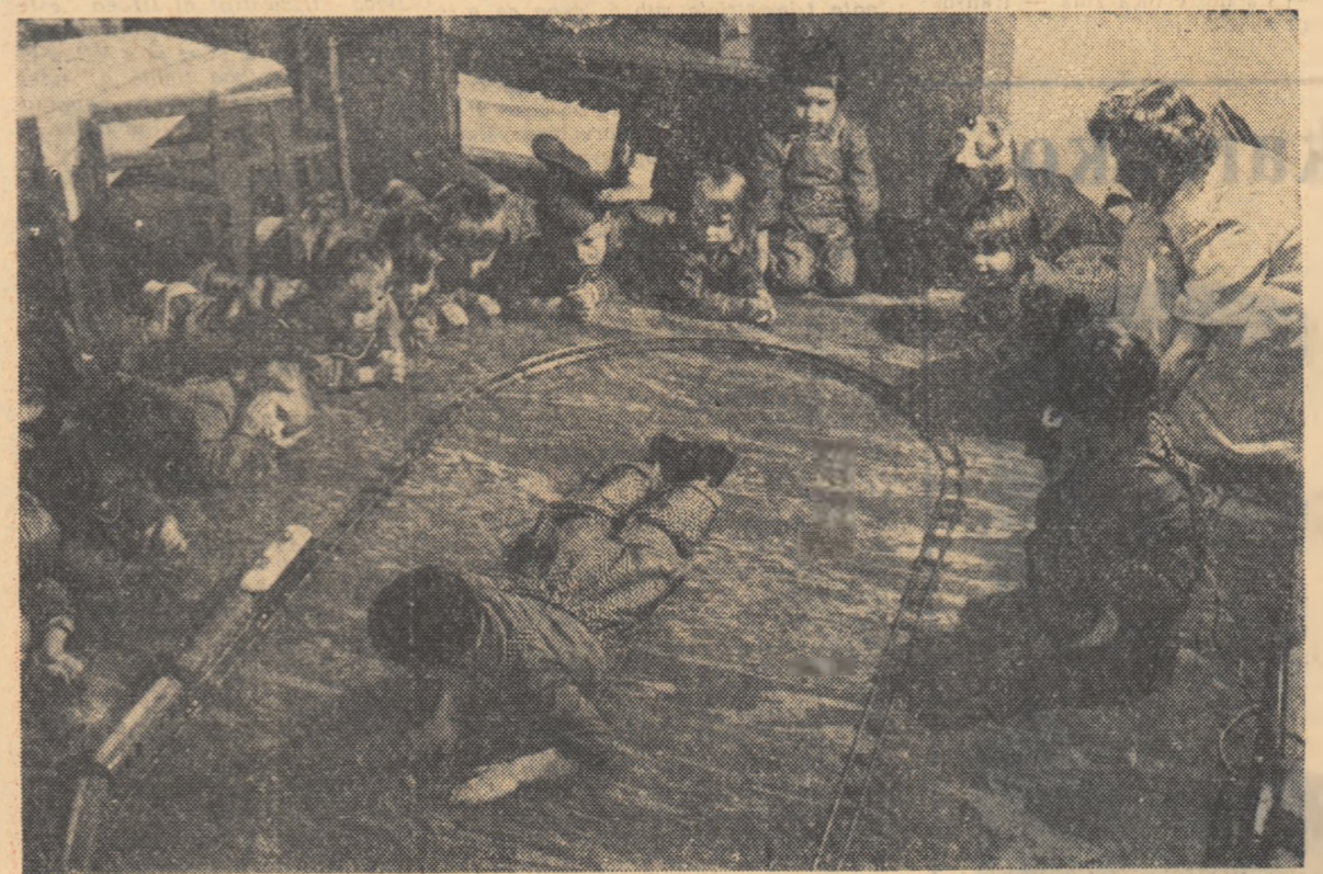
Întro grădiniță de copii din Budapeșta

Nu este cu nimic mai bună situația femeilor din majoritatea celorlalte țări capitaliste. Îndosebi din America Latină și țările care continuă să fie apărate sub jugul colonial. Problema învățămîntului pentru femei și problema învățămîntului în general privește sute de milioane de mame din lumea întreagă, îngrijorate de scăderea continuă a alocațiilor destinate învățămîntului în favoarea umflării bugetelor militare, de influența nefastă a propagandei militare și a culturii violenței, care determină o creștere alarmantă a criminalității și delincvenței în rîndul tinerilor.