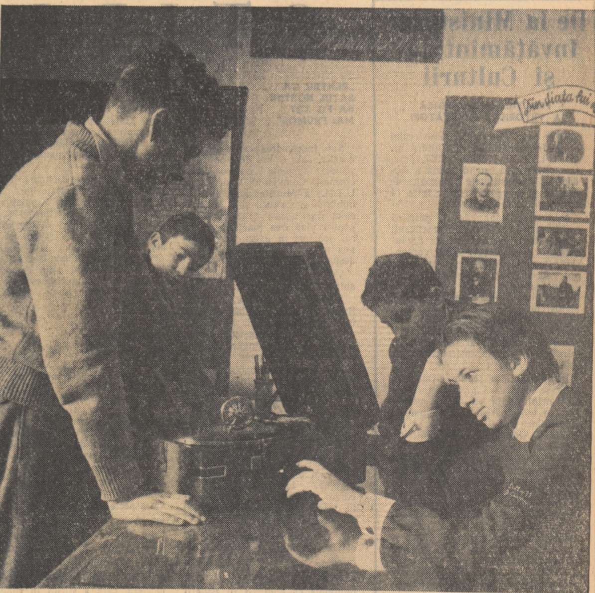
Audieș muzicală la școala medie „D. Cantemir” din București