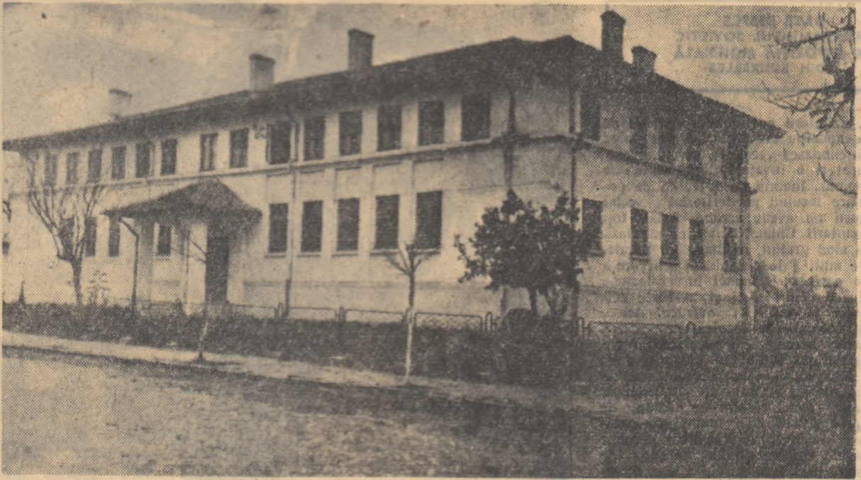
Clădirea internatului școlii medii din Pașcani

Urmasii războiului și ale tristei moșteniri din trecut în domeniul școlii au dispărut sau sînt pe cale de dispariție. Acesta este rezultatul muncii rodnice depuse de cadrele didactice și de organele de învățămînt din raion, care primesc permanent îndrumarea și sprijinul neprecupețit al organelor locale de partid și de stat.