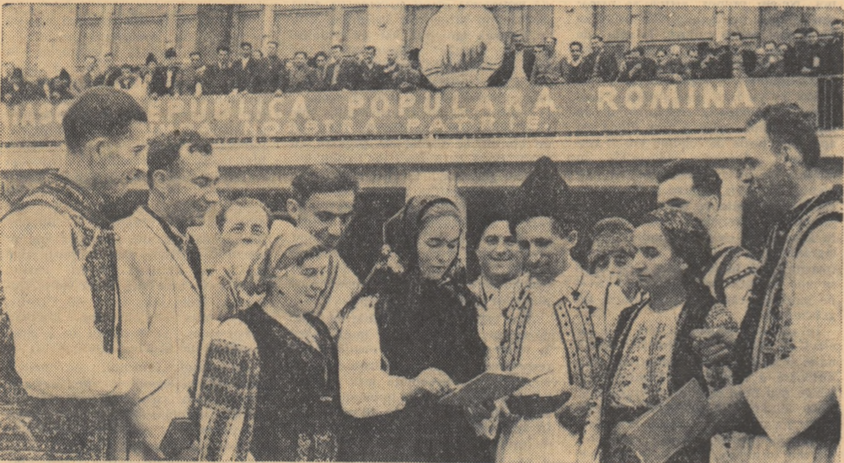
Un grup de participanți la consfătuire, discutînd într-o pauză.