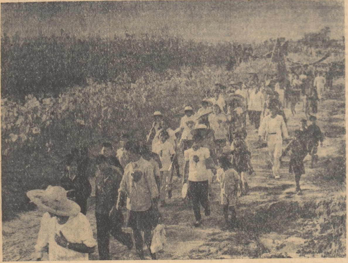
Un număr de 14 băieți și fete, elevi ai școlilor din orașul Tsian, provincia Sianlung, au hotărît să se stabilească la țară. În foto: Sosirea în satul Tai a elevilor din orașul Tsian.