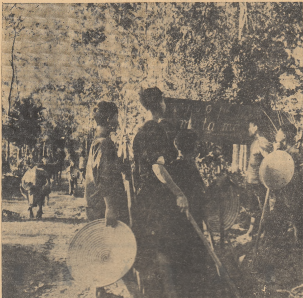
Sub lozincă „A învăța este un act patriotic” peste 11.000.000 de școlari ai Vietnamului au fost scunși din inactivitatea analfabetismului. În foto: o lecție sub cerul liber.