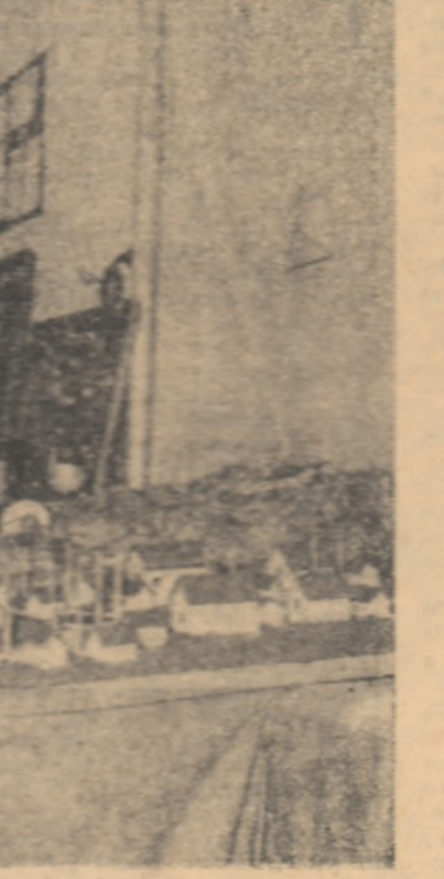
Un copil al expoziției