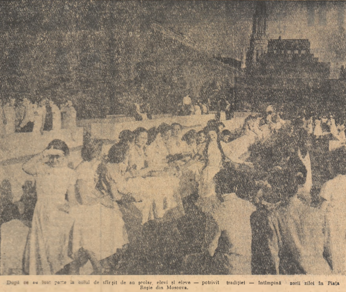
După ce au fost parte la oală de sîfrit de an școlar, elevii și elevele — potrivit tradiției — întîmpină zorii zilei în Piața Roșie din Moscova.