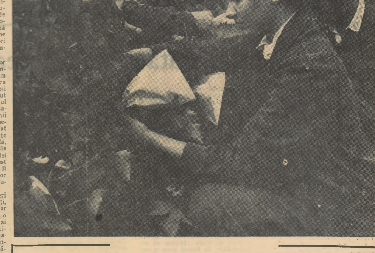
● Invățămîntul profesional și tehnic asigură economiei naționale în continuă dezvoltare cadrele necesare de muncitori și tehnicieni. Pentru aceasta rețeaua școlilor profesionale și tehnice s-a dezvoltat foarte mult. Numărul școlilor profesionale a crescut de la 224 unități cu 39.250 elevi cîte erau în 1938/1939 la 410 unități cu 97.805 elevi în anul școlar 1957/1958. În afară de un mare număr de școli tehnice care cuprind zeci de mii de elevi, în anul școlar 1957/1958 au fost deschise școli profesionale și tehnice a dat agriculturii noastre 6575 muncitori și 2008 tehnicieni și maștri agricoli. IN FOTOGRAFIE: Elevii ale școlii profesionale viticole din Odobesti făcînd polenizarea artificială.