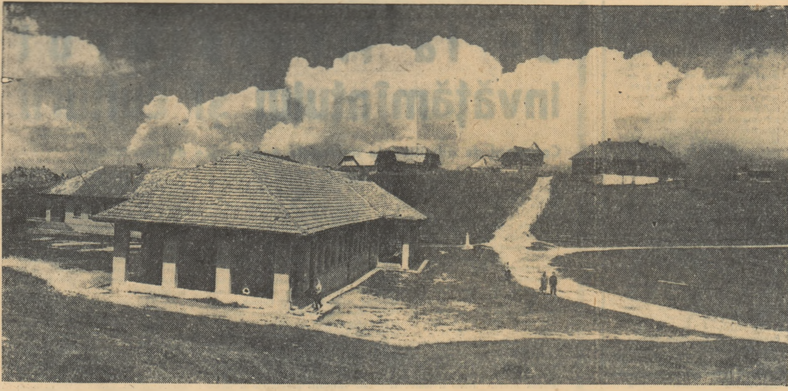
● Invățământul de 7 ani creat prin reforma învățământului din 1948 a devenit general și obligatoriu în orașe, centre muncitorești și centre raionale. În anul care urmează va fi generalizat în toate comunitățile și satele care au școli de 7 ani în 1948-1949, primul an de pregătire reformei învățământului, au funcționat 3549 unități școlare cu clasele V-VII în care au fost cuprinși 284.450 elevi. Până în anul școlar 1957/58 numărul acestor unități a ajuns la 4633 în care au fost cuprinși 438.039 elevi, față de 770 gimnazii și cursuri inferioare de liceu care au fost în 1938/39, cărora le corespund clasele V-VII de astăzi și care cuprindeau de patru ori mai puțini elevi. IN FOTOGRAFIE: O școală construită de curând la 1360 metri altitudine, în comuna Fundata, regiunea Stalin.