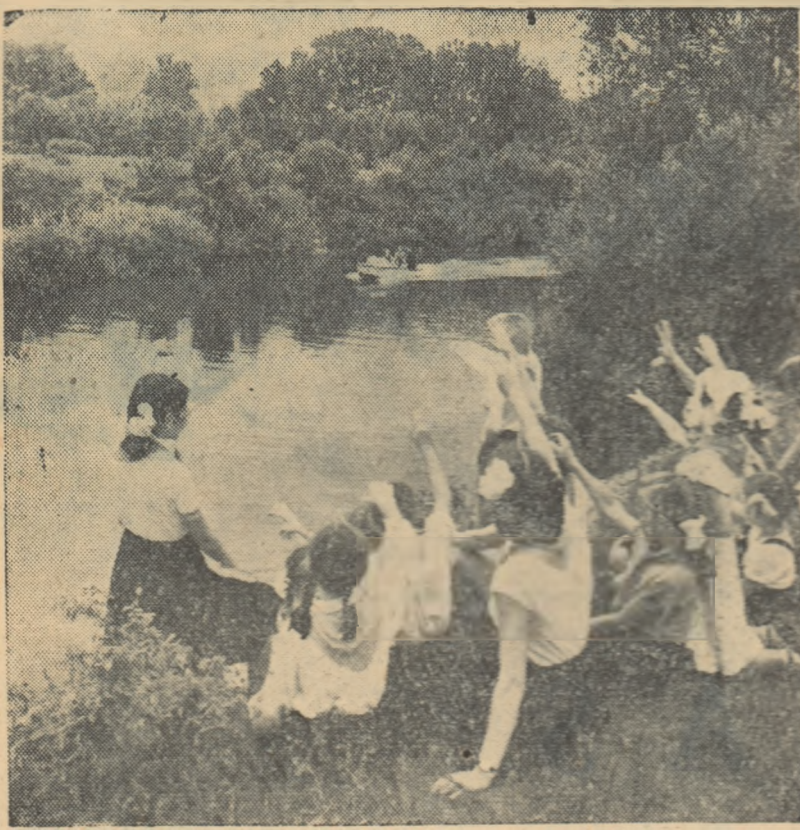
Pentru școlarii sovietici s-au deschis în vara aceasta numeroase tabere. Ei își petrec aici în mod plăcut vacanța.