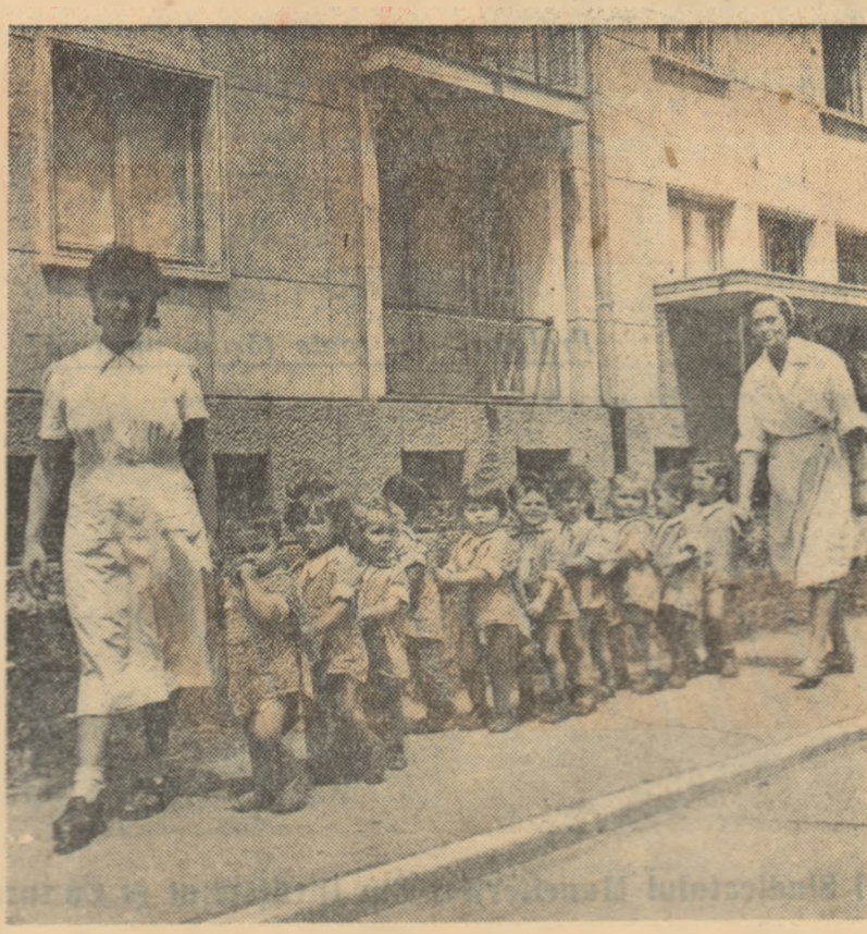
● Pentru a pregăti pe copiii de 3-7 ani pentru școala elementară și a risă productivitate femeilor mame, să participe la activități economice, sociale și politice în anii puterii populare, învățămîntul preșcolar a luat o largă extindere. În 1936/1939 funcționau numai 1577 instituții preșcolare cu 99.787 copii. Pînă în anul 1957/1958 numărul acestora a crescut la 50.787, în care au fost cuprinși 521.141 copii.

IN FOTOGRAFIE: Copiii de la o grădiniță din cartierul Zentari.