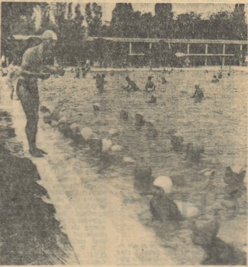
Pe terenul geografic al școlii din Orașul Stalin s-a construit un lac artificial betonat. În prezent, lacul este în curs de finalizare și va fi folosit pentru observații și lucrări practice.