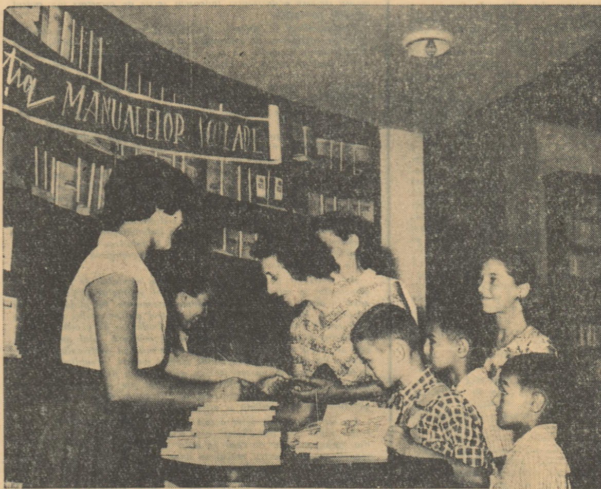
Noile manuale, tipărite anul acesta, sînt cerute cu interes de elevi.