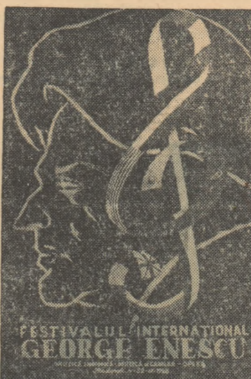
observăm că muzica lui Enescu, înverșinată din cîntecul popular, este izbîndă și prețioasă de acelu pentru care a fost scrisă.

Poate că, fiind pros aproape de eferescența festivalului, să nu putem deocîndă aprecia cu suficiență juste semnificația deosebită a acestui grandios spectacol ce se desfășoară sub ochii noștri. Sîm însă cu siguranță că în istoria muzicii rominești se scriu acum pagini pe care nu le-am întâlnit vreodată în trecut. Ne dăm seama că prestigiul artei noastre a crescut în anii de după eliberare atît de vertiginoși încît ne putem compara cu orice altă țară cu veche tradiție muzicală. Înțelegem cu o deplină maturitate uriașă contribuția a lui George Enescu la dezvoltarea creației contemporane. Și, în sfîrșit, nu putem să nu