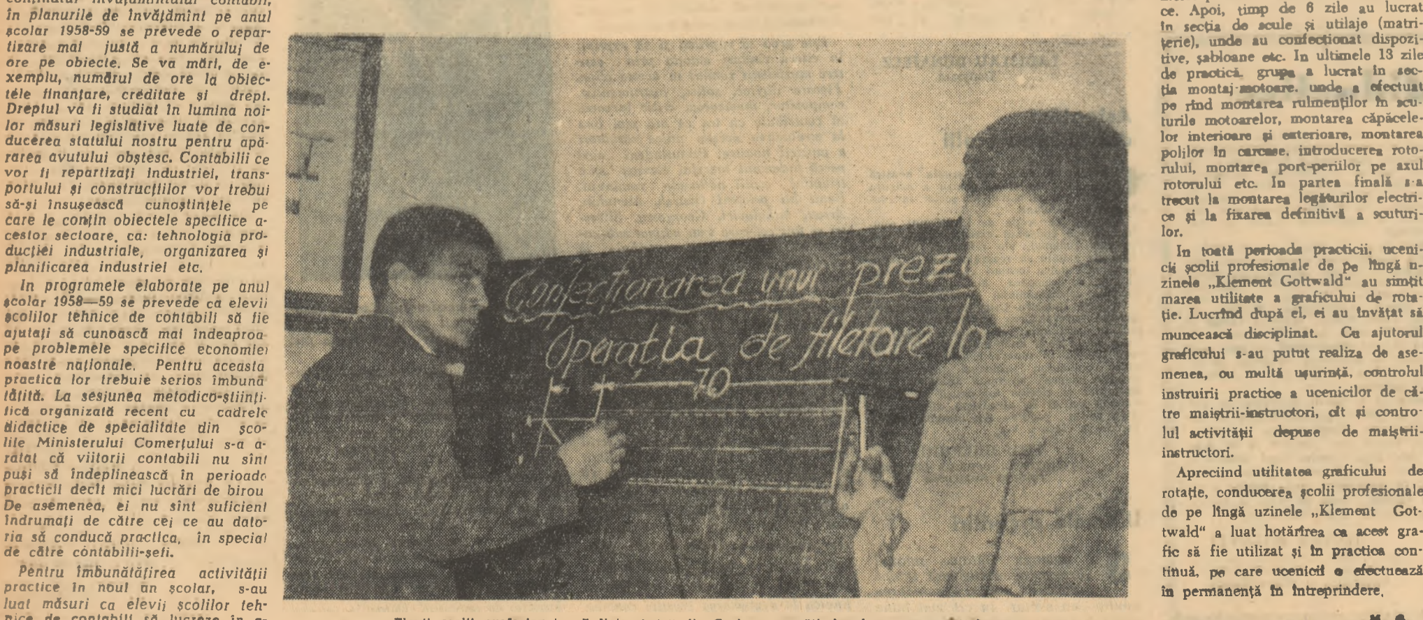
Elevii școlii profesionale „7 Noiembrie” din Craiova pregătind o lucrare practică.

În vederea înlăturării lacunelor care au existat în organizarea și conținutul învățămîntului contabil, în planurile de învățămînt pe anul școlar 1958-59 se prevede o reparitură mai justă a numărului de ore pe obiecte. Se va mări, de exemplu, numărul de ore la obiectele financiare, creditare și drept. Dreptul va fi studiat în lumina noilor măsuri legislative luate de conducerea statului nostru pentru apărarea avutului obștesc. Contabilii de vor fi repartizați industriei, transportului și construcțiilor vor trebui să-și însușească cunoștințele pe care le conțin obiectele specifice acestor sectoare, ca: tehnologia producției industriale, organizarea și planificarea industriei etc.