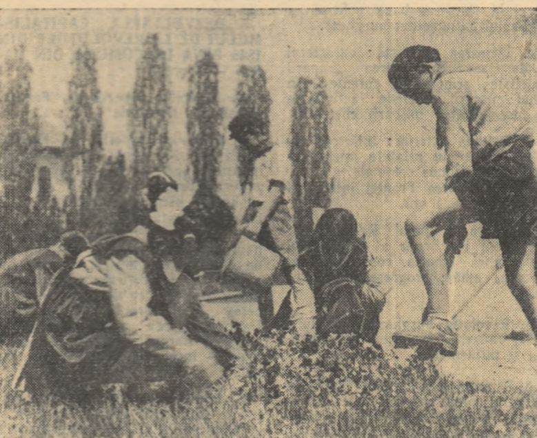
Pionierii contribuie la înfrumusețarea orașului lor.