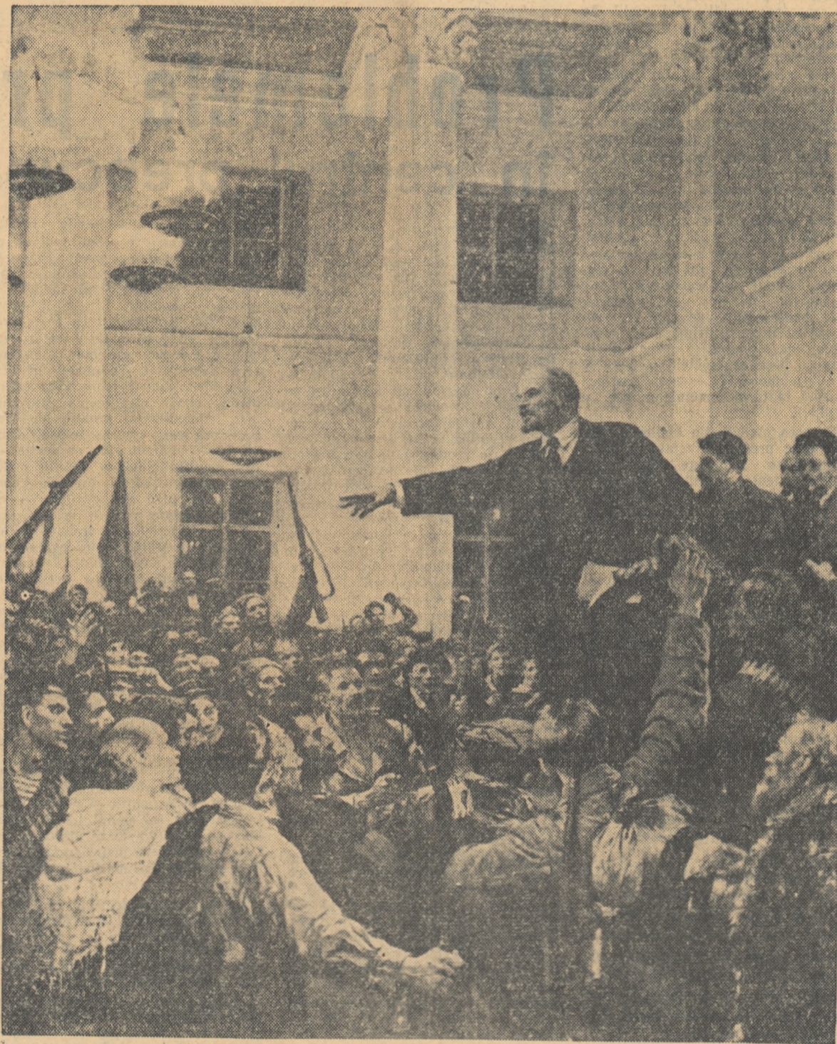
V. I. LENIN proclamînd puterea sovietelor