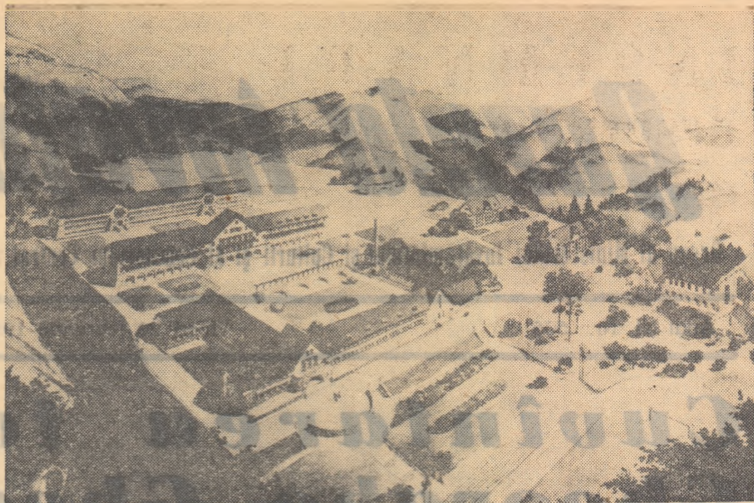
Macheta ansamblului arhitectonic al Grupului școlar minier din Lupeni. Majoritatea clădirilor ansamblului au fost terminate și date în folosință.

organizează numeroase prezențări de lucrări ideologice, literare și tehnice, cele din urmă fiind însoțite de proiecția unor diafilme.