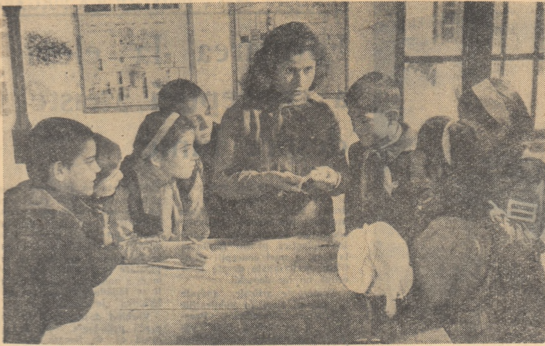
Se aleg semințele de măr pentru semănat în răsădnie.

Dintre manualele de istoria literaturii romine pentru clasa a X-a prezentate la concurs n-a fost premiat niciunul.