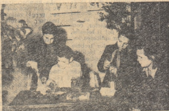
Mulți dintre pionierii care activează în cercurile Casei pionierilor din Huși, arată un interes deosebit pentru lucrările practice de științe naturale.