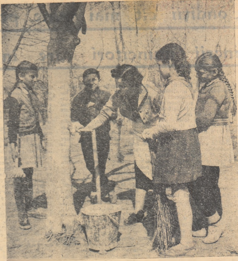
Pionierii și școlarii de la Școala de 4 ani din satul Mărginenii de Sus, comuna Dărmănești, raionul Ploiești, participă intens la lucrările practice agricole de primăvară. Iată o parte dintre ei efectuînd, sub îndrumarea învățătoarei, vîruierea pomilor.

Discuțiile purtate în consfătuire s-au oprit însă și asupra aspectelor negative legate de predarea cunoștințelor agricole. A reieșit astfel că o lipsă principală întîlnită la unele școli constă în faptul că orele de cunoștințe agricole au fost repartizate unor cadre necalificate sau unor profesori a căror specialitate nu are nici o tangență cu agricultura, deși în școlile respective se aflau profesori de științe naturale care puteau să predea lecțiile de cunoștințe agricole în condiții mult mai bune. Repartizarea orei la împlinire de către unii conducători de școli denotă că ei umbresc însemnătața pregătirii agricole a elevilor. S-a arătat, de aseme-