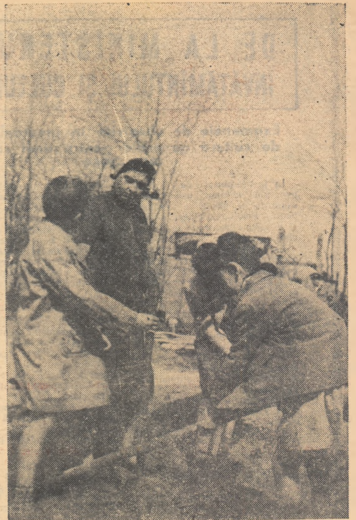
Peste ani, pomii sădiți astăzi de elevii din București și din comuna Rica, raionul Costești, vor da rod bogat.