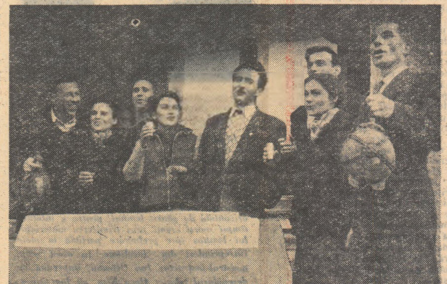
Brigada artistică de agitație a cîminului cultural din comuna Uliești, raionul Găești, regiunea Pitești, cuprinde majoritatea cadrelor didactice din localitate. Programele brigăzii sînt deosebit de apreciate de țărani muncitori.