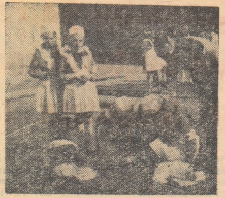
De curind s-au desfășurat în întreaga țară concursurile posturilor sanitare școlare. În fotografie, un aspect de la concursul desfășurat în raionul Lipova: colectivul postului sanitar al Școlii din Ghiococ la proba practică de prim ajutor.

secretar al organizației de partid de la Școala medie „D. Cantemir” București