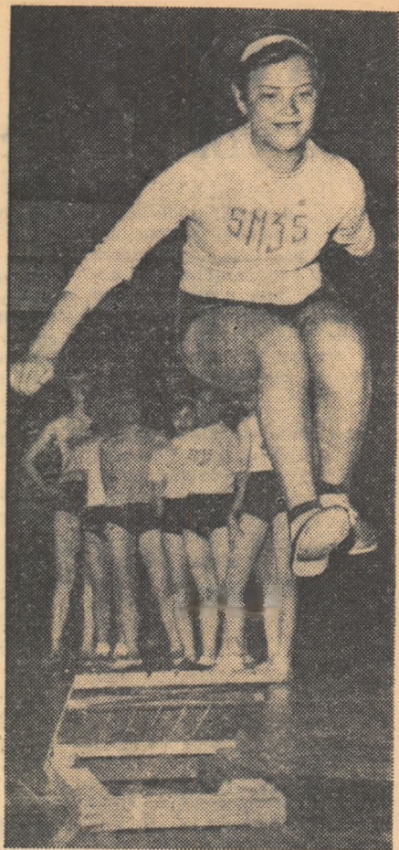
„Frumoasă săritură!” — par că spun privirile admirative ale colegelor. Sîntem în sala de gimnastică a Școlii medii nr. 35 din București, în timpul unei ore de atletism la clasa a VII-a.

Utilizîndu-se cadrul nr. 4 cu miez de fier se poate obține curent de o intensitate mult mai mare, care este capabil să aprindă un bec de 3,5 volți. Pentru a pune în evidență acest lucru montăm în locul galvanometrului un astfel de bec.