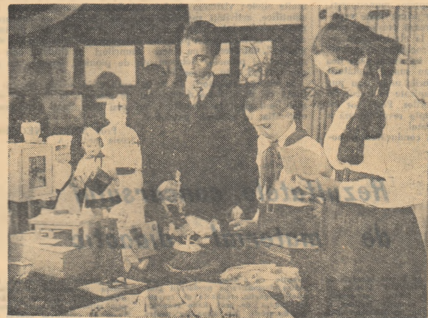
Elevii școlilor din Capitală au stabilit legături de prietenie cu școlari din numeroase țări. Iată un colț al expoziției cuprinzînd lucrări de artă populară, albume, desene și scrisori pe care elevii din București le vor trimite curînd în dar colegilor lor de peste hotare.