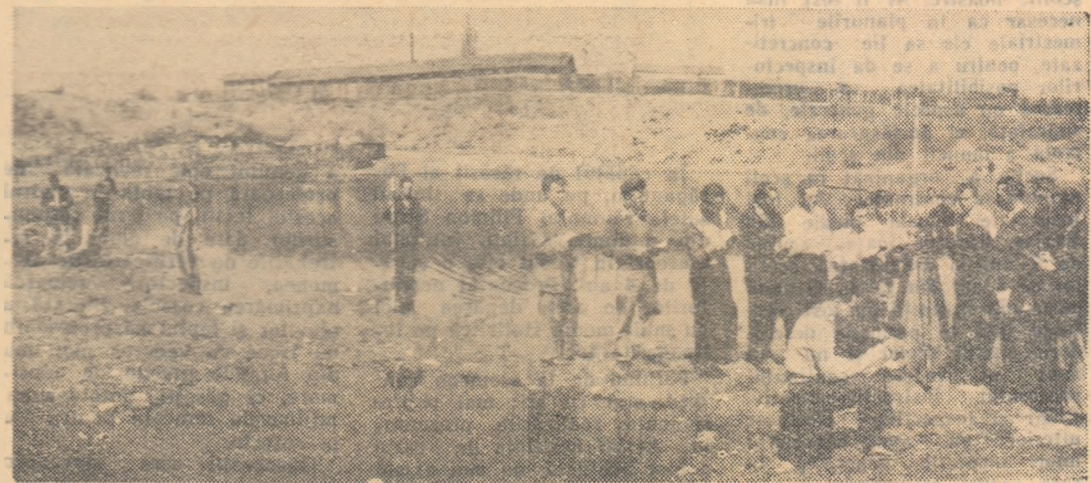
Centrul școlar silvic din Gurghiu, raionul Reghin, pregătește și cadre de tehnicieni pentru amenajarea, exploatarea și protecția apelor. În fotografie: elevii efectuează aplicații practice privind măsurările de unghi cu ajutorul tabelului.