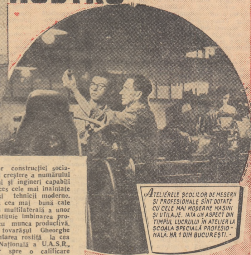
Atelierele școlilor de meserii și profesionale sînt dotate cu cele mai moderne mașini și utilaje. Iată un aspect din timpul lucrului în atelier la școala specială profesio- nală. Nr 1 din București.

Îndeplinirea sarcinilor construcției socialiste cere o necontenită creștere a numărului de muncitori, tehnicieni și ingineri capabili să folosească cu succes cele mai înaintate cuceriri ale științei și tehnicii moderne. Viața demonstrează că cea mai bună cale de formare și educare multilaterală a unor asemenea cadre o constituie imbinarea procesului de învățămînt cu munca productivă. Așa cum a arătat tovarășul Gheorghe Gheorghiu-Dej în cuvîntarea rostită la cea de a II-a Conferință Națională a U.A.S.R., drumul cel mai sigur spre o calificare profesională înaltă „duce prin școala muncii în fabrică, în uzină, în mină, în gospodăria agricolă colectivă”.