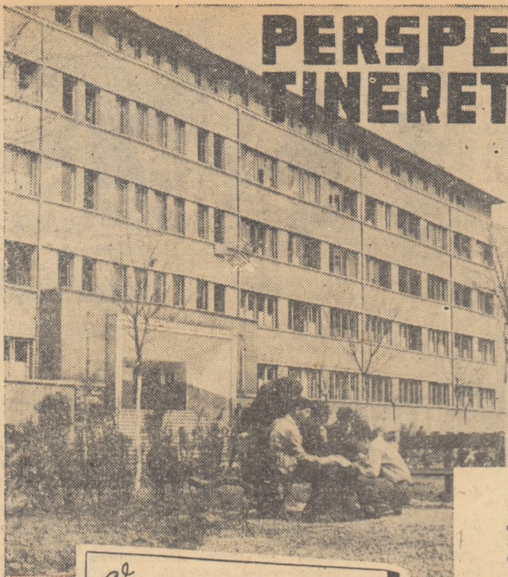
Vederea de ansamblu a grupului școlar pentru învățământul profesional și tehnic din Reșița