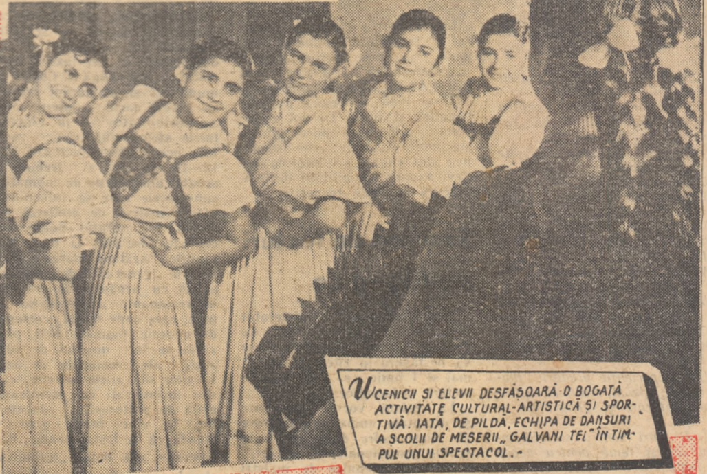
Ucenici și elevii desfășoară o bogată activitate cultural-artistică și spor- tivistă. Iată, de pildă, echipa de dansuri a școlii de meserii „Galvani Tei” în tim- pul unui spectacol.