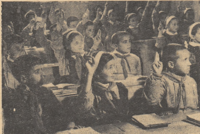
Așa se prezintă elevii clasei a III-a de la școala elementară de 7 ani din Periș, regiunea București, la lecțiile de recapitulare.

directorul școlii elementare din Strebaia, regiunea Craiova