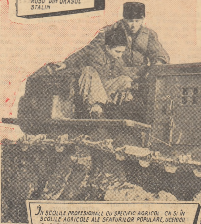
În școlile profesionale cu specific agricol, ca și în școlile agricole ale sfaturilor populare, ucenicii și elevii au la dispoziție cele mai bune condiții de calificare. Fotografia noastră prezintă o imagine de la practica în producție a ucenicilor școlii agricole din Focsani.