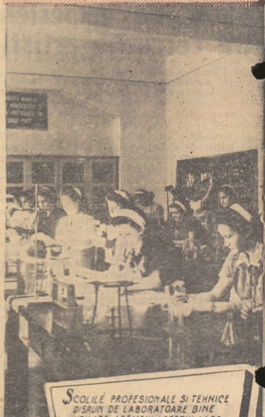
Școlile profesionale și tehnice dispun de laboratoare bine utilate asemenea acestui labo- rator al școlii tehnice sanitare din București.