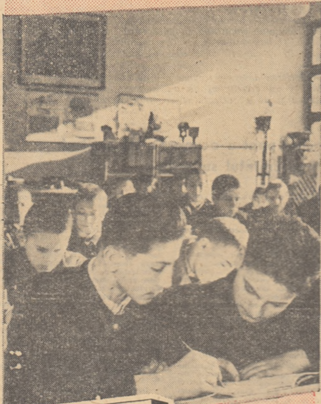
Oră de curs în cabi- netul de tehnolo- gie al grupului școlar „Steagul Rosu” din Orasul Stalin

Mănunchiul de fotografii cuprinse în această pagină, chipurile vesele, strălucind de bucuria tinereții, ale ucenicilor și elevilor pe care îi înfățișează aceste fotografii, reprezintă o imagine elocventă a minunatelor condiții de muncă și de viață care le sînt asigurate tinerilor din școlile profesionale și tehnice. Îndrumați de pedagogi, tot mai mulți absolvenți ai școlilor de cultură generală se îndreaptă cu dragoste către aceste școli, care le deschid perspective luminoase.