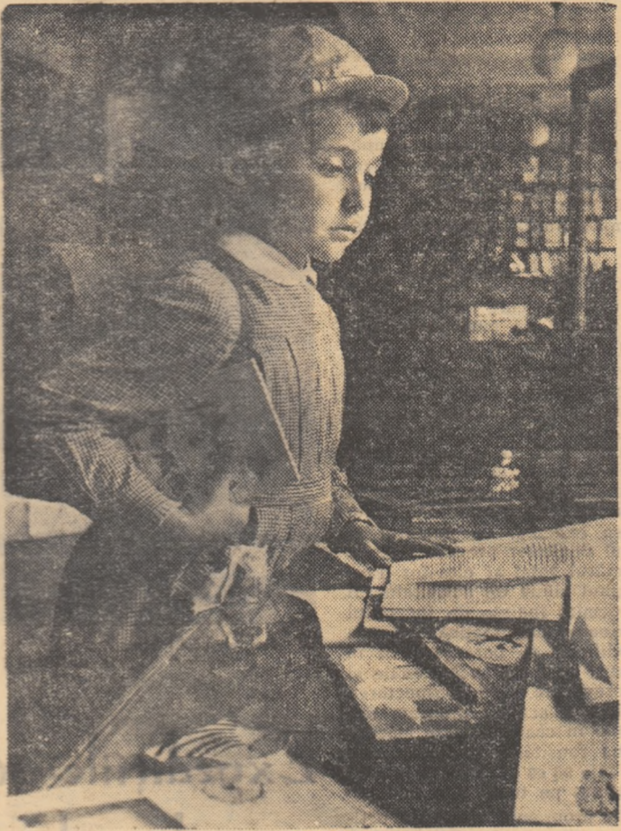
Se pare că povestea e frumoasă... Dar micul cititor e încă nehotărât. În „Librăria copiilor” sînt zeci de cărți frumoase pentru cei de vârsta lui. Pe care s-o alege mai întâi?...

Pe pajiștea verde din fața grupului de blocuri mari, frumoase, construite în anii din urmă pentru muncitorii din Orașul Stalin, au invadat un fel deosebit de flori. Au petalele ca cerul de sîrșit de mai și gingășia și frumusețea pe care numai florile de nu mă uita o pot avea. Sînt cei mai mici locatari ai cartierului muncitoresc, îmbrăcați în frumoasele lor uniforme albastre, cu funde mari, roșii la git.