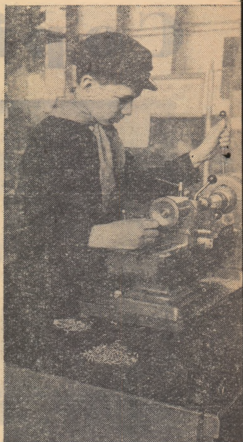
Un elev al școlii elementare Nr. 175 din București, în atelierul P.T.T.