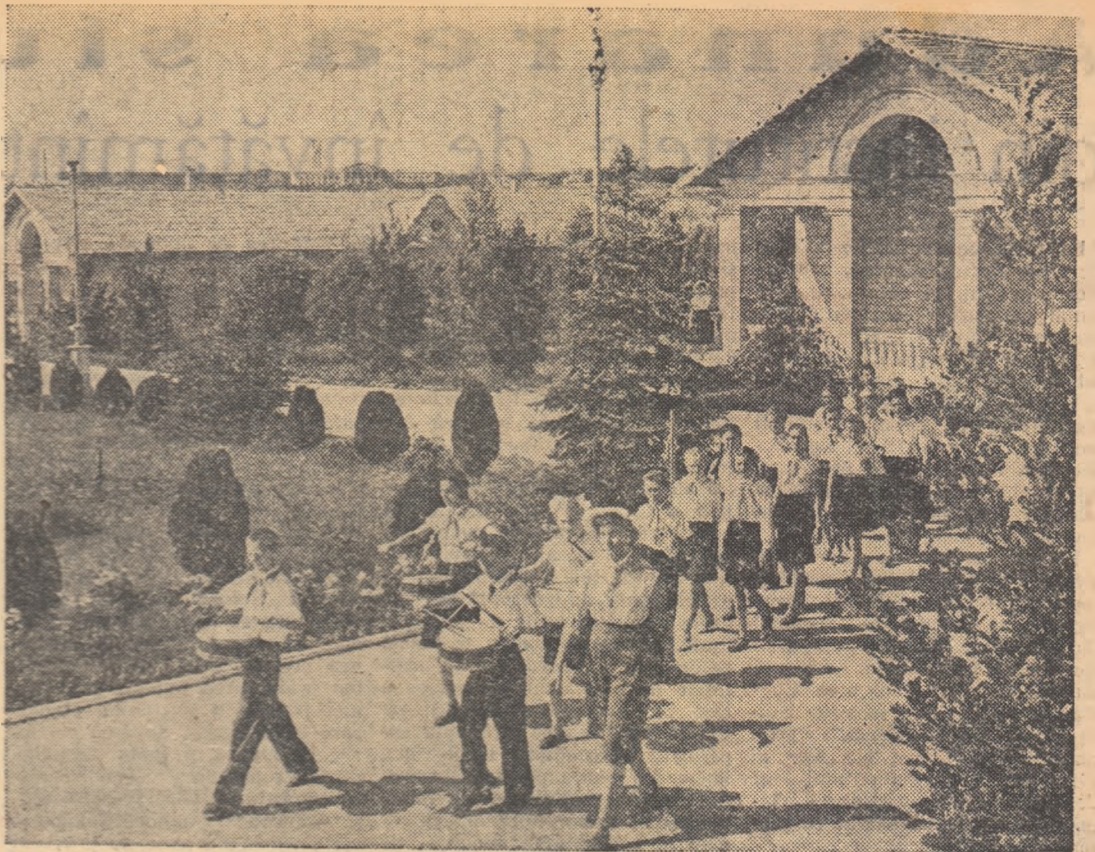
Pionieri sovietici în tabăra de pe insula Horița, pe Nipru.

Cauza lui Glezos este dreaptă și ea va triumfa.