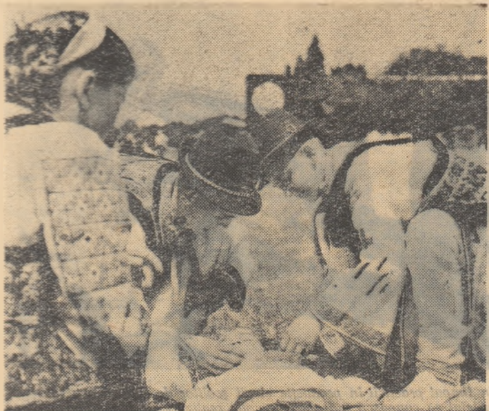
Cu îndemnare micii sanitari de la Școala din comuna Romîni, regiunea Bacău, clasați pe locul I la întrecere, dau primul ajutor.