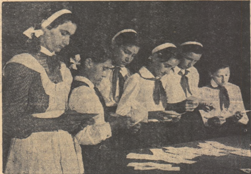
Candidatele au tras subiectul la examenul de limba română în cadrul concursului de admitere la Institutul de învățatori din București.