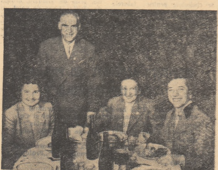
La ziua Invățătorului, un toast în cinstea fruntașilor