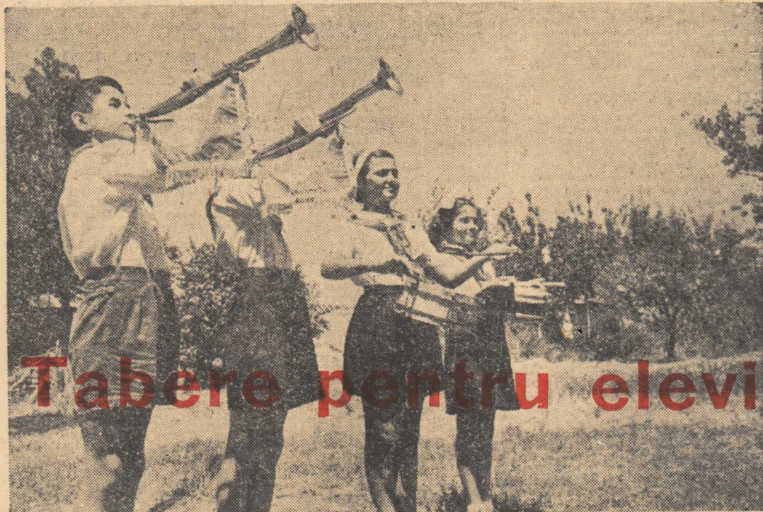
Tabere pentru elevi

De la 1 iulie și pînă în prezent elevii Școlii medii „B. St. Delavrancea” au efectuat cca. 4000 ore de muncă voluntară.