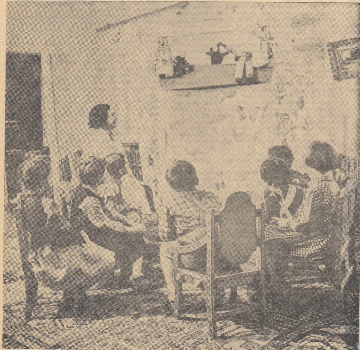
Într-o grădiniță de copii socialistă: Un spectacol amuzant!

Abonamentele se primesc de către difuzorii voluntari din unitățile școlare, factorii poștali și oficiile P.T.T.R. Costul unui abonament este de 3,25 lei pe 3 luni, 6,50 lei pe 6 luni și 13 lei pe 12 luni.