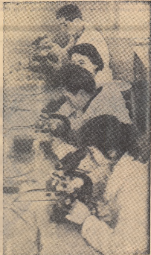
Laboratorul de analize al Grupului școlar veterinar din București este dotat cu aparate și utilaje dintre cele mai moderne, care permit efectuarea unor experiențe complexe. Iată un grup de elevi făcînd în laborator analiza la microscop a unor preparate.