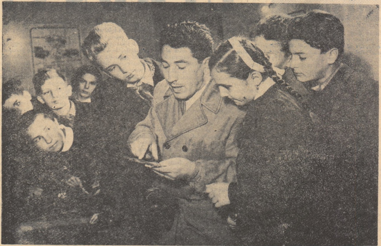
In atelierul Școlii elementare nr. 10 din Cluj. Profesorul-maistru dă explicații.