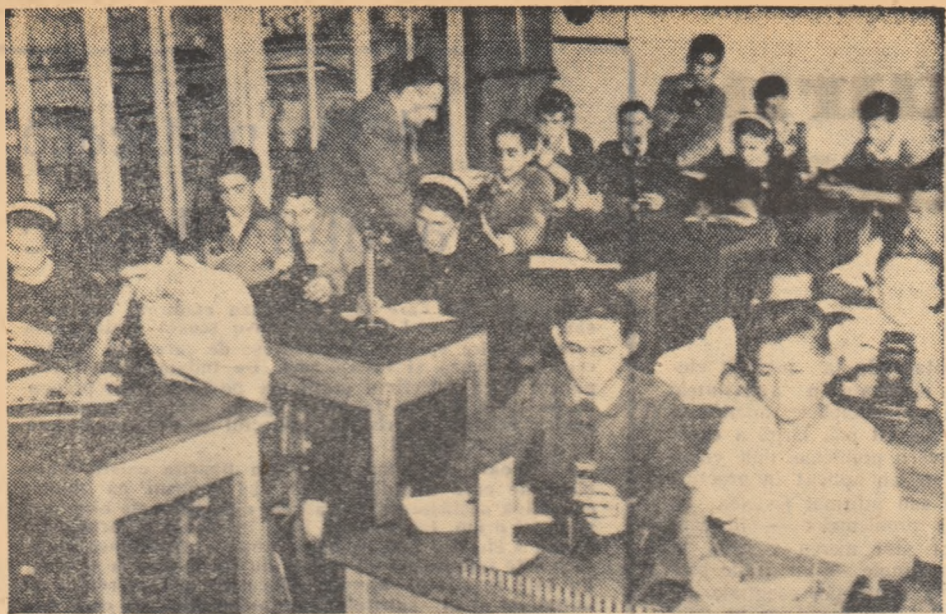
Tot mai multe școli profesionale și tehnice dispun de cabinete școlare bogat dotate. În fotografie, o lecție practică de fizică în cabinetul Grupului școlar petrol-chimie din Tirgoșle.