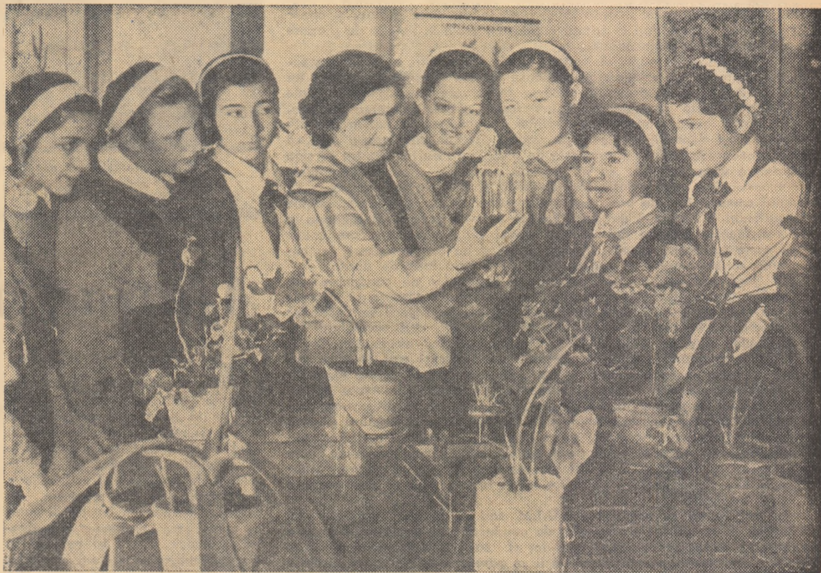
O oră de botanică la Școala de 7 ani nr. 120, din București. Lecție despre încolțirea semințelor.