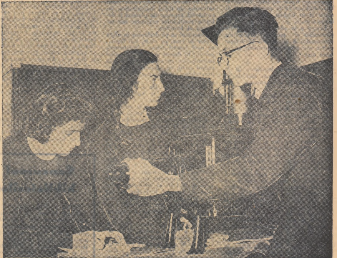
La Complexul școlar din Btrlad se folosește la lecții un bogat și variat material didactic. Iată-l, în fotografie, pe elevii clasei a IX-a „E” pregătind epidiascopul pentru proiecțiile necesare unei lecții de fizică.

Alături de învățătorii și profesorii lor, alături de întregul nostru popor muncitor, ei feliicită din toată inima vajnicul detașament muncitoresc al ceferiștilor, urîndu-i, la această sărbătoare a sa, noi și noi succese pe drumul socialismului.