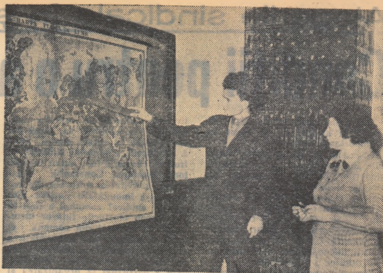
Numeroși muncitori și muncitoare de la Uzinele chimice din Săvoinești și de pe șantierul Combinatului chimic din Roznov urmează cursurile secției serale a Școlii medii „Petru Rareș” din Piatra Neamț. În fotografie, o lecție de geografie la clasa a VIII-a serală a acestei școli.