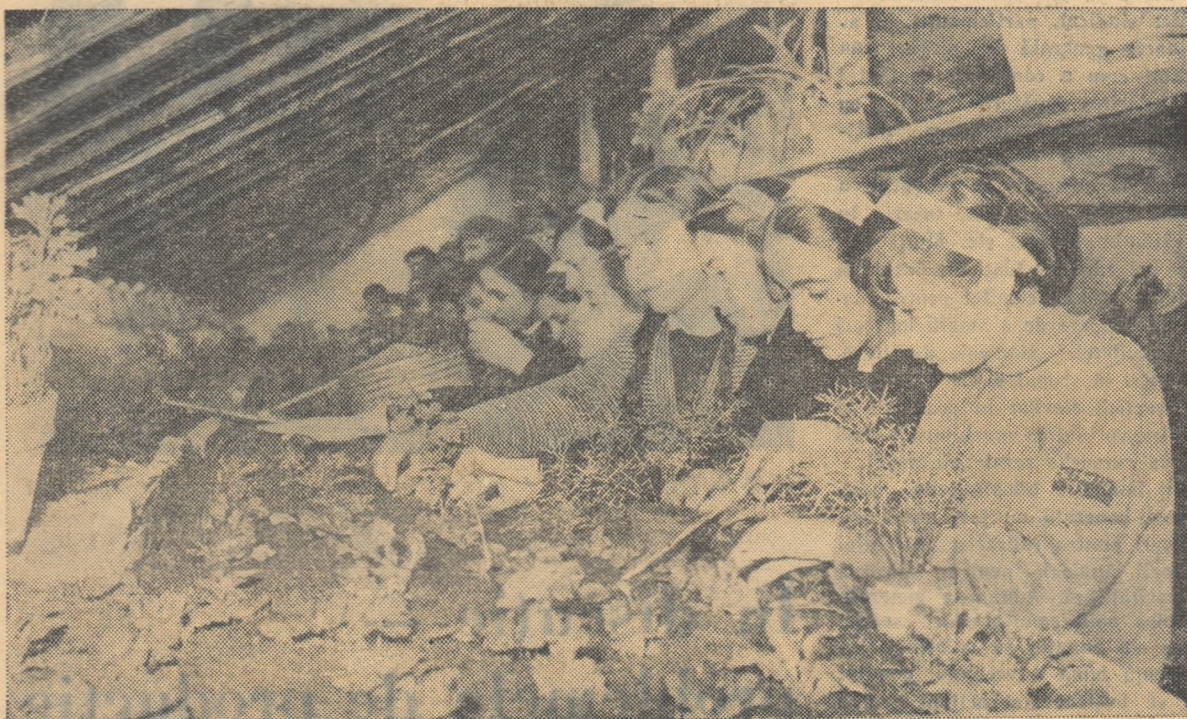
Se apropie primăvara. Elevii din anul II al Școlii pedagogice din Buzău îngrijesc în seră răsadurile pe care le vor planta în curînd pe parcela experimentală.