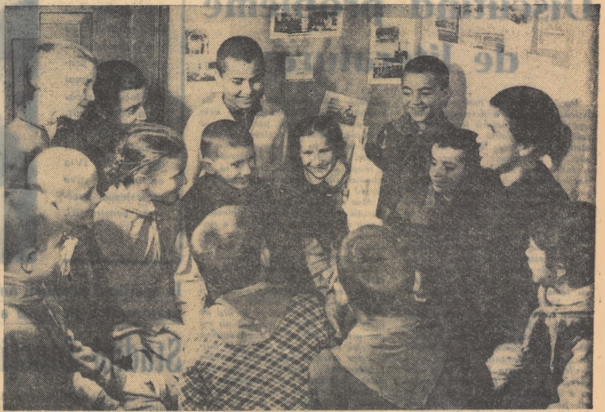
În numeroasele acțiuni și manifestări pe care le întreprinde, căminul din Ocnița, raionul Rîmnicul Vilcea, vădește o deosebită preocupare pentru copii. Foarte apreciate de școlarii de vîrstă mică sînt după amiezele în care învățătorii lor le citească basme.