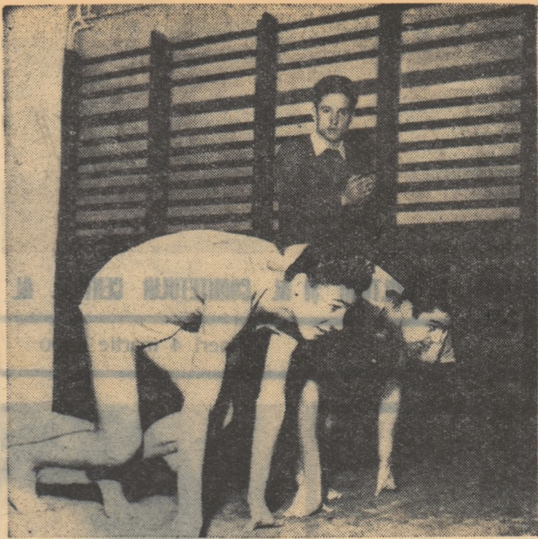
Pe locuri... Jiți gata... Oră de sport la Școala medie nr. 26 „Al. I. Cuza” din București.

Muncitoarele și țărăncile muncitoare, învățătoarele, educatoarele și medicii, femeile de știință și de artă, sîrbătoresc 8 Martie împreună cu întregul popor hotărîte să întărească legăturile de prietenie cu toate femeile iubitoare de pace și dornice de progres din lumea întreagă, să contribuie la întărirea păcii prin muncă dirză pentru construirea socialismului în patria noastră.