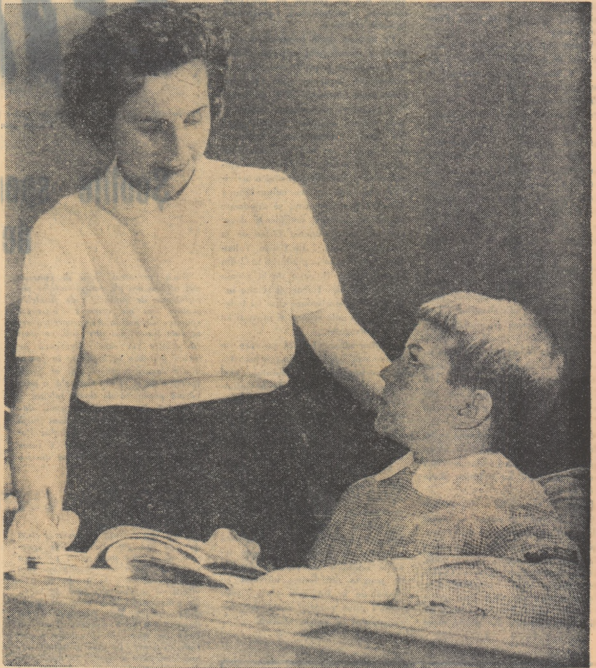
Sub privirea plină de căldură a învățătoarei cresc noi vîrstare ale patriei.