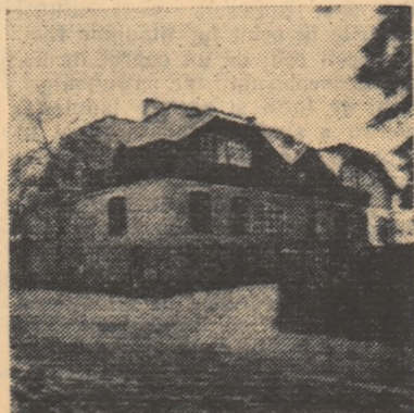
Noul local de școală din com. Talea, raionul Cîmpina, cu opt săli de clasă și laborator, la care și-au adus contribuția și elevii și părinții lor.