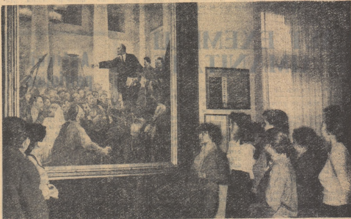
Numărul tinerilor din școli care vizitează Muzeul Lenin-Stalin din Capitală crește tot mai mult. Iată-le în vizită la muzeu pe elevele clasei de textile, clasă fruntașă la învățătură și disciplină, de la Școala tehnică de muncitori calificați a Ministerului Comerțului.

De asemenea, în vacanță clubul organizează un ciclu de filme pentru școlari și tineret.