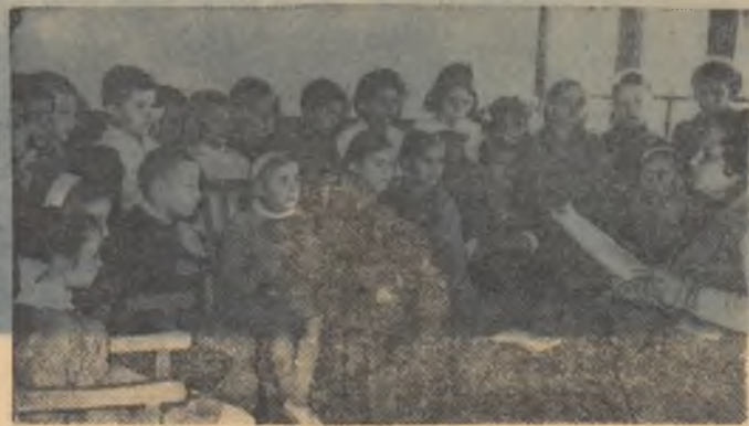
Școlarii din comuna Gura Ocnitei, regiunea Ploiești, ascultă cu emoție o lectură din cartea „Lenin și copiii”.

Profesorii, maștrii-instrucători și ucenicii de la Școala profesională „23 August” au ascultat o conferință cu tema „Figura de luptător revoluționar a lui Vladimir Ilici Lenin”. La colțul roșu al acestei școli au avut loc zilnic lecturi colective din volumele „Amintiri despre Lenin”. Peste 300 de ucenici ai școlii au participat la concursul de lucrări scrise cu tema „Viața lui V. I. Lenin”.