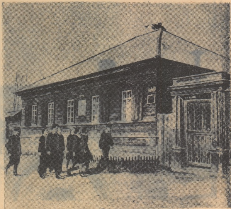
Casa din satul Șușenskoe, în care a locuit Lenin în anii 1898-1900.

(După „Ucitel'skaia gazeta" nr. 44/4634 din 12 aprilie 1960)