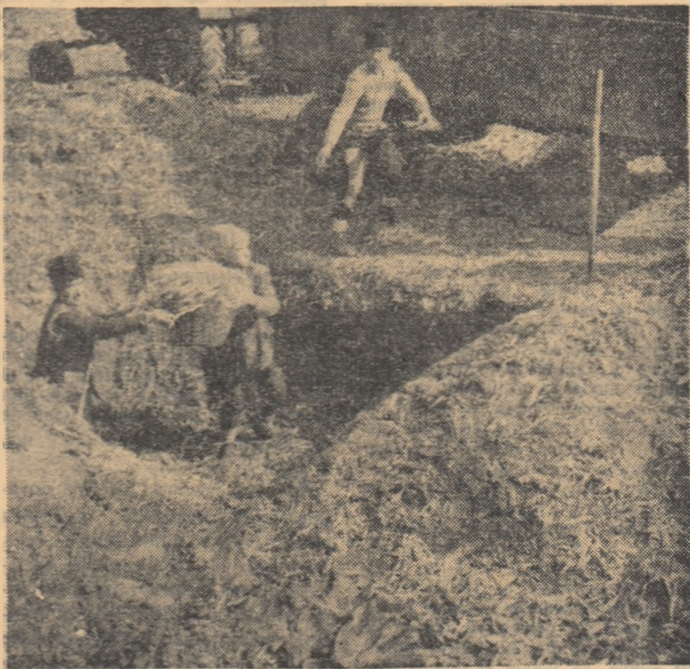
Siloz cu porumb