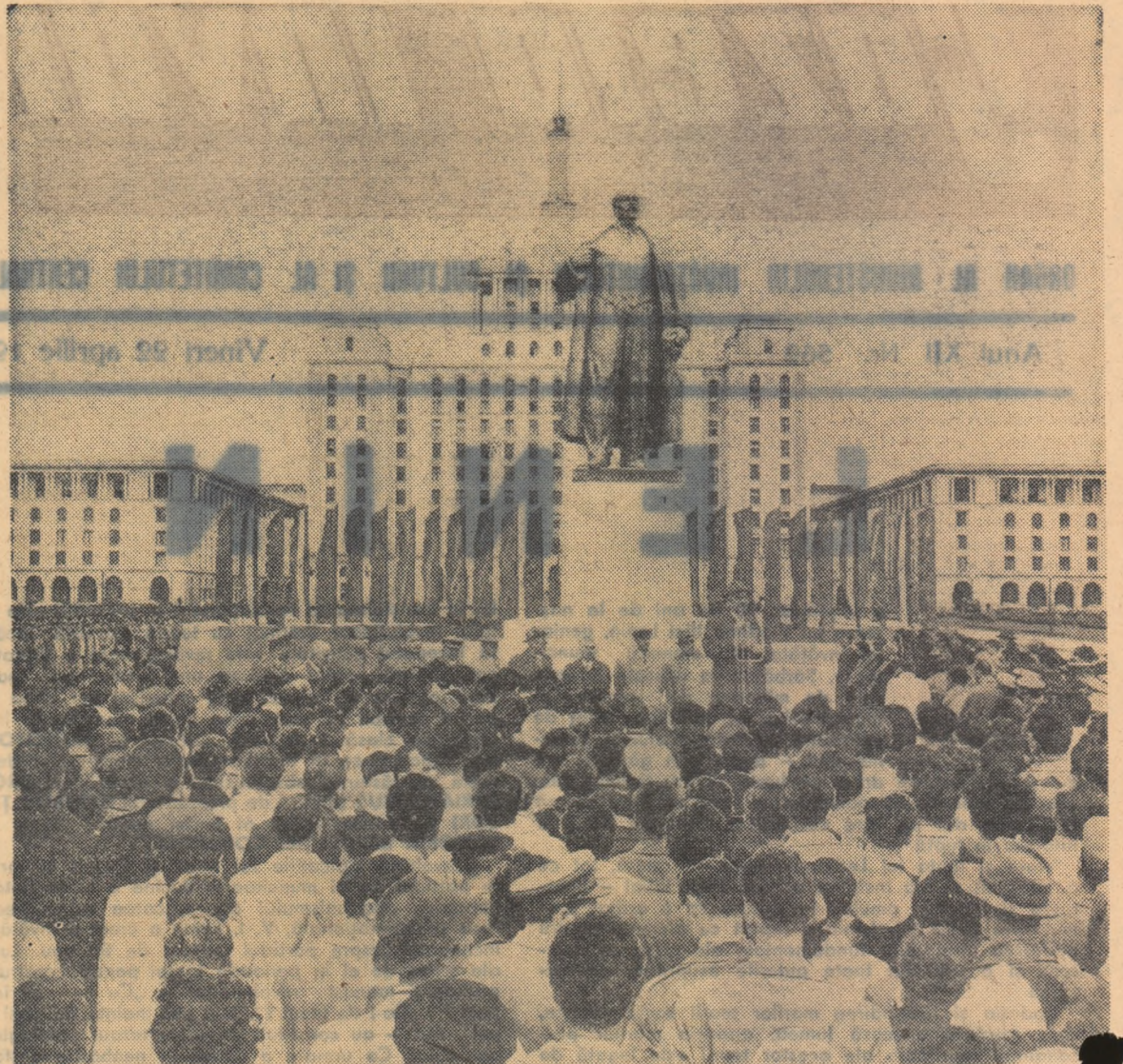
Joi dimineața, într-un cadru festiv, a avut loc dezvelirea monumentului V. I. LENIN din fața „Casei Științei”, realizare a sculptorului Boris Caragea.

Joi dimineața, la București, în Piața Științei a avut loc dezvelirea monumentului lui Vladimir Ilici Lenin, genialul învățător și conducător al oamenilor muncii din lumea întreagă, făuritorul Partidului Comunist al Uniunii Sovietice și al Statului Sovietic.