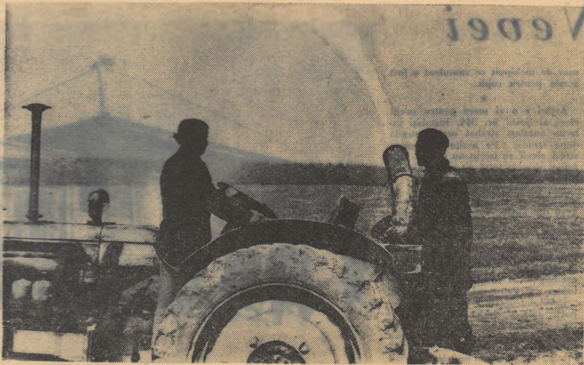
Irigatul griului prin aspersiune.