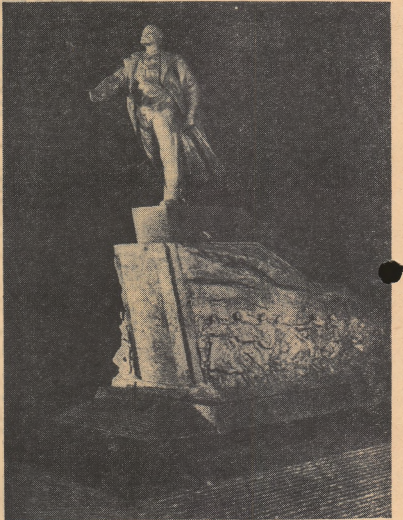
Proiect de monument consacrat lui V. I. Lenin. Autori: sculptor N. TOMSKI, arhitecți — B. RUBANENKO și H. GOLUBOVSKI

Lucrarea cuprinde capitolele: „Lenin despre partinitatea educației și școlii”, „Lenin și rolul școlii în societatea socialistă”, „V. I. Lenin despre conținutul realist-științific al învățământului”, „Legătura dintre școală și producție — principiu de bază al învățământului”, „Învățătura leninistă despre educarea tinerei generații în spiritul moralei comuniste”, „V. I. Lenin despre rolul și sarcinile cadrelor didactice”.