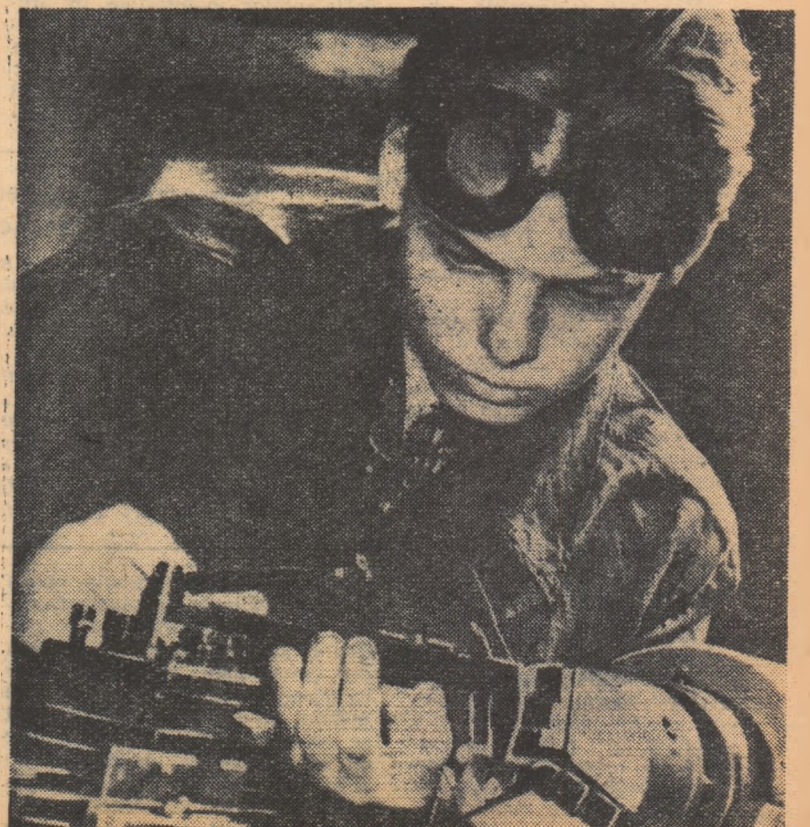
Aplicații practice la o lecție de studiul mașinilor.