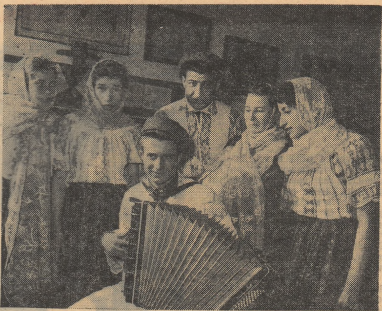
Brigada artistică a căminului cultural pregătește un nou program.