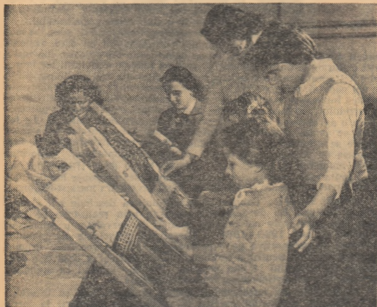
Școala populară de artă din Oradea își sărbătorește anul acesta un deceniu de activitate. În prezent aici funcționează secții de muzică (cu clase de pian, vioară, violoncel, acordeon, instrumente de suflat, canto), de teatru (cu clase de actorie), de dansuri populare și de artă plastică (cu clase de grafică, pictură, sculptură și țesături).