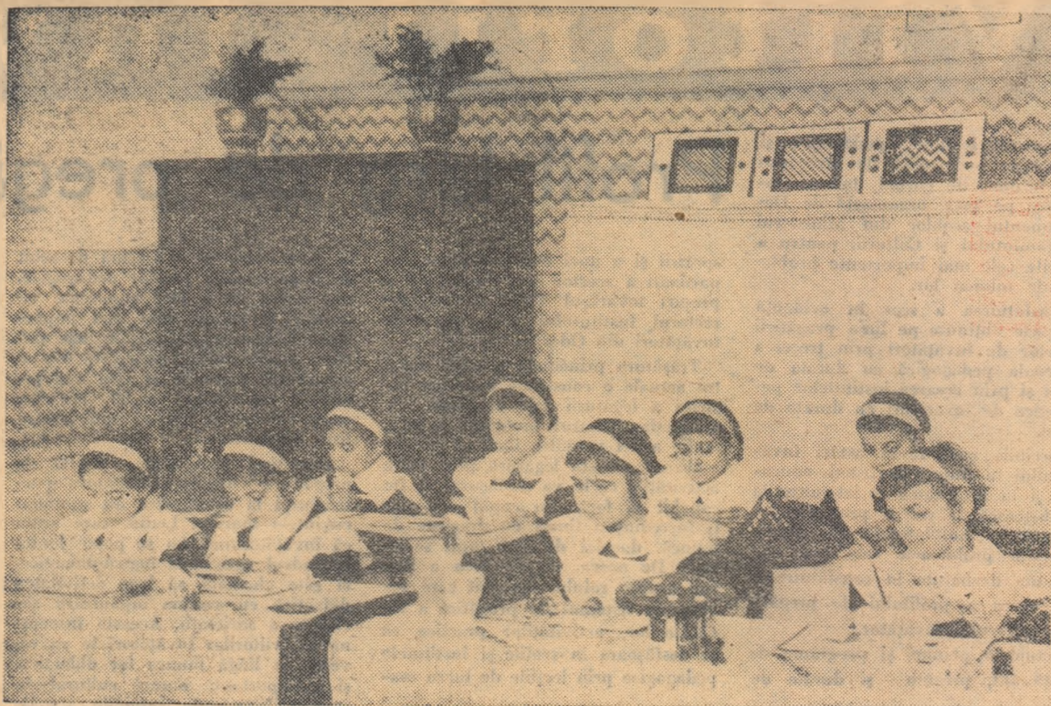
O clasă a Școlii speciale din Alexandria