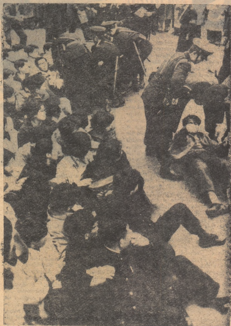
Studentii japonezi în timpul unei manifestații împotriva ratificării tratatului militar japoano-american.