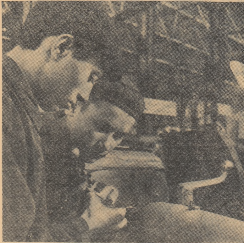
La o școală profesională C.F.R.

directorul Grupului școlar „Steagul Roșu” din Orașul Stalin