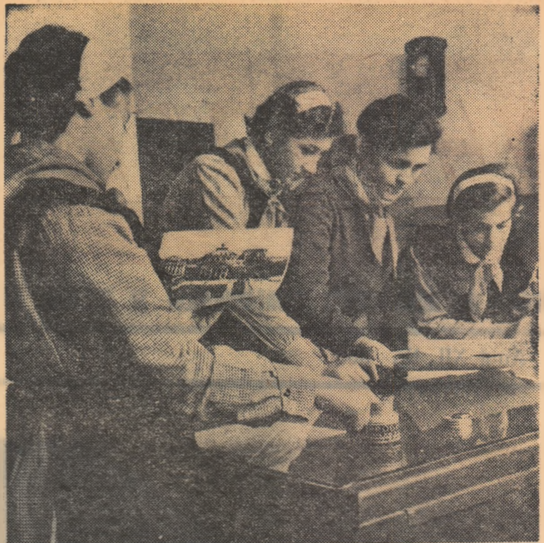
Elevii și pionierii de la Școala medie nr. 5 din Capitală desfășoară, în cadrul activității din afara clasei, acțiuni interesante cu un bogat conținut educativ. Iată, în clișeu de față, câteva pioniere alcătuind un album care înfățișează frumusețile patriei noastre.

Ritmul tot mai viu al construcțiilor școlare creează și în regiunea Craiova, ca și în toate regiunile țării, condiții tot mai bune pentru dezvoltarea învățământului, pentru desfășurarea tot mai rodnică a muncii instructiv-educative.