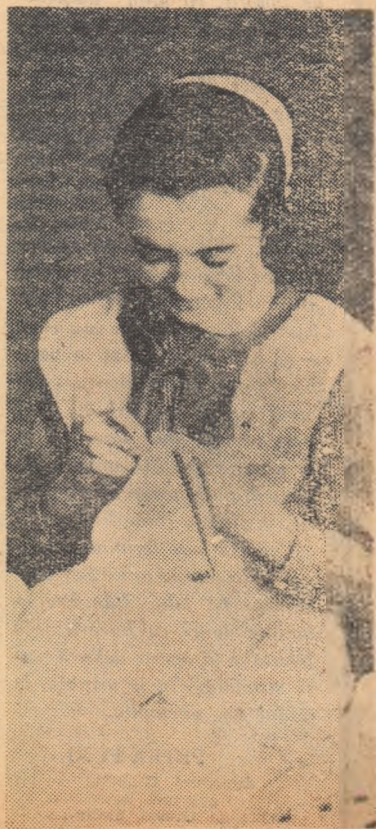
La lecția de lucru manual.

Mulți învățători, îndrumați de cercul pedagogic, întocmesc albume pe teme ca „Să ne cunoaștem regiunea”, „Realizările regimului democrat-popular în regiunea noastră” etc., care cuprind fotografii și desene ce ilustrează aspecte din frumusețile și bogățiile regiunii, din munca desfășurată în cadrul ei.