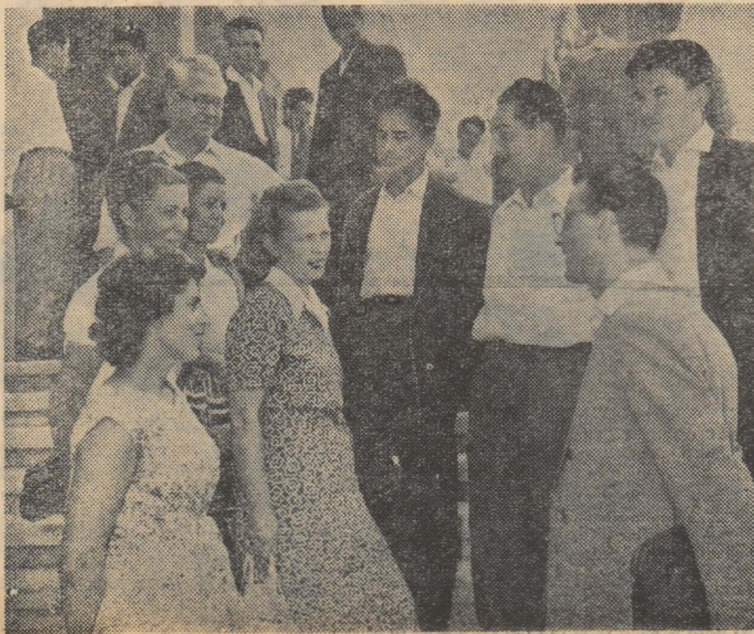
Alt grup de participanți la conferință, în pauză

Sindicatul nostru nu revine de asemenea sarcina de a se preocupa mai îndeaproape de promovarea și calificarea cadrelor de cercetare și ajutorarea. În această direcție, la unele institute au fost organizate cursuri și cercuri pentru cali-