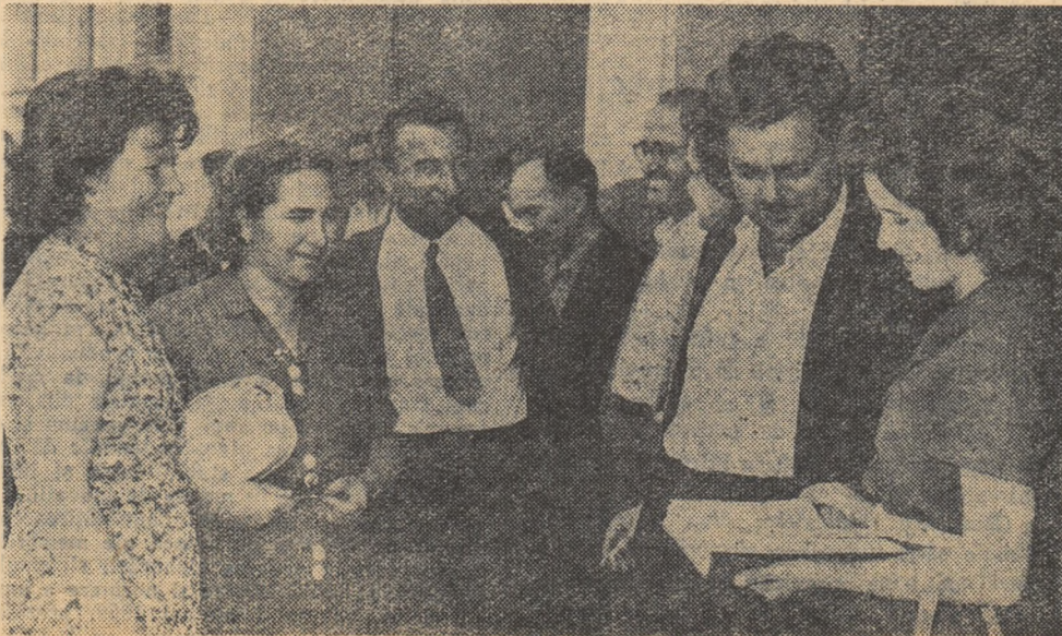
Un grup de participanți la Conferință discutînd într-una din pauze.

Realizarea sarcinii trasate de partid în legătură cu formarea noii intelectualități ieșită din popor și legată de interesele lui —