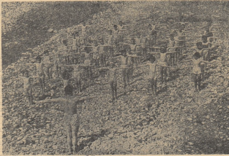
In aerul răcoros al dimineții, gimnastica de înviorare din tabără e o adevărată plăcere.

Condițiile materiale bune create de partid și guvern pentru desfășurarea optimă a activităților recreative, reconfortante și educative din tabere trebuie folosite de către pedagogii cu toată grija, cu tot simțul datoriei, astfel încît timpul petrecut de copii în aceste unități să aibă rezultatele dorite.