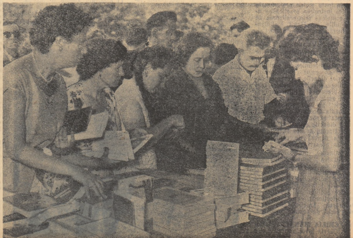
Într-o pauză a conferinței, în stîndul cu nouă literatură.