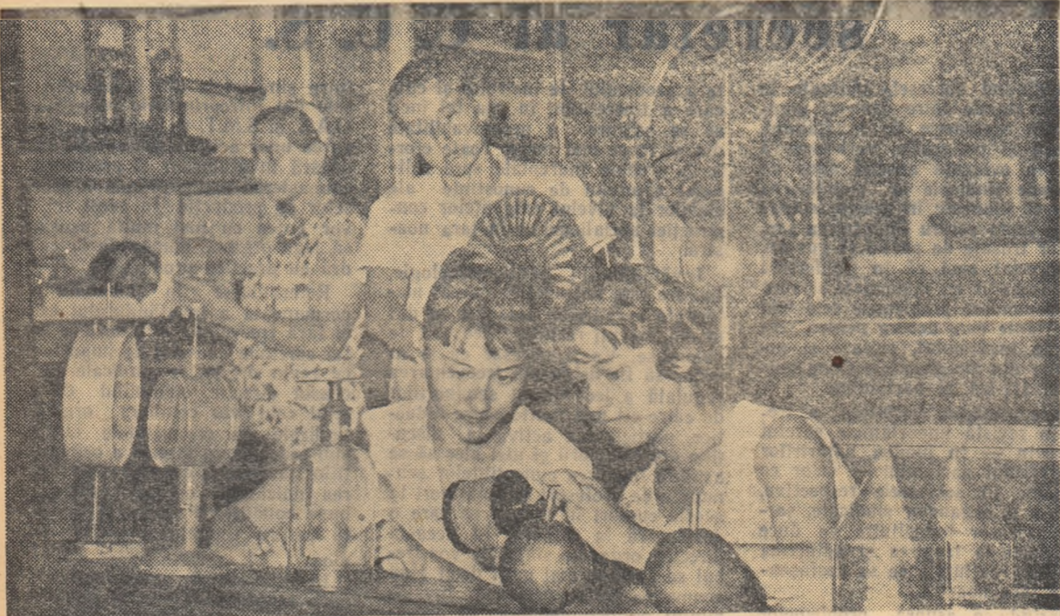
Răspunzând chemării școlii, elevii pasionați ai experiențelor de fizică pregătesc din timp la laborator fiecare aparat și instrument pentru primele lecții din noul an școlar.