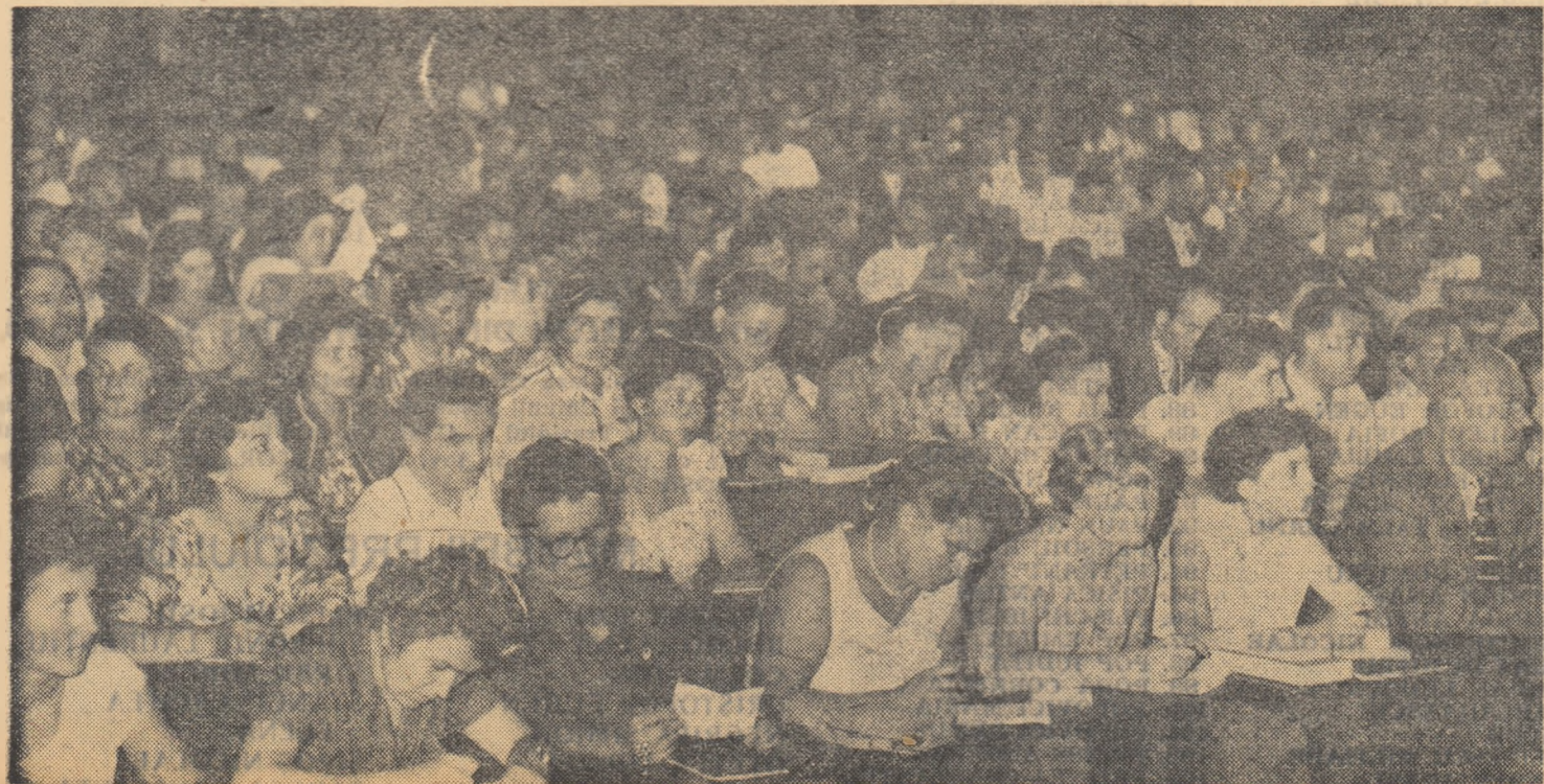
Participanții la Conferință ascultă cu deosebită atenție raportul de activitate al C.C. al S.M.I.C.

Paralel cu sarcina reducerii numărului de elevi nepromovați, în fața școlii noastre se pune problema îmbunătățirii cunoștințelor elevilor peste nivelul notelor-limită, problema luptei împotriva mediocrității. Trebuie să recunoaștem că mai sînt profesori care se mulțumesc ca elevii lor să se strecoare dintr-o clasă în alta, obținînd la majoritatea materiilor, mai ales la cele de bază — limba română, matematica, fizica, chimia, științele naturale — medii de 5 și 6. Este evident că asemenea elevi termină școala fără o bază solidă de cunoștințe, fără să-și însușească o temeinică pregătire pentru viață. Aceasta se datorește în mare măsură și deficiențelor existente în munca membrilor noștri de sindicat, a colectivelor pedagogice. Insuficiența pregătire pentru lecții a unor învățători și profesori, existența în învățămînt a unui număr încă destul de mare de cadre care nu depun suficient efort pentru calificarea lor, nivelul științific și ideologic scăzut al conținutului predării, slaba preo-