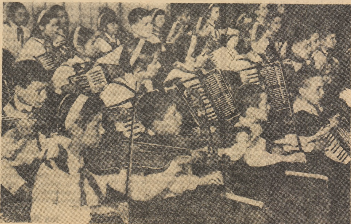
În sala Teatrului C.C.S. din Capitală a avut loc serbarea școlilor medii și elementare din regiunea București închinată zilei de 30 Decembrie. Cele mai bune formații artistice din regiune — coruri, orchestre, echipe de dansuri, recitatori — au prezentat un bogat program artistic. În fotografie, orchestra Casei pionierilor din Alexandria