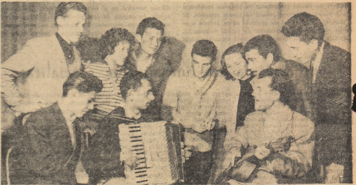
Brigada artistică a elevilor de la Grupul școlar de petrol-chimie din Făgăraș pregătește un nou spectacol