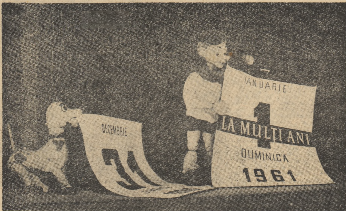
Scenă din spectacolul pregătit pentru Anul nou de Teatrul de păpuși și marionete „Tândărică” din București