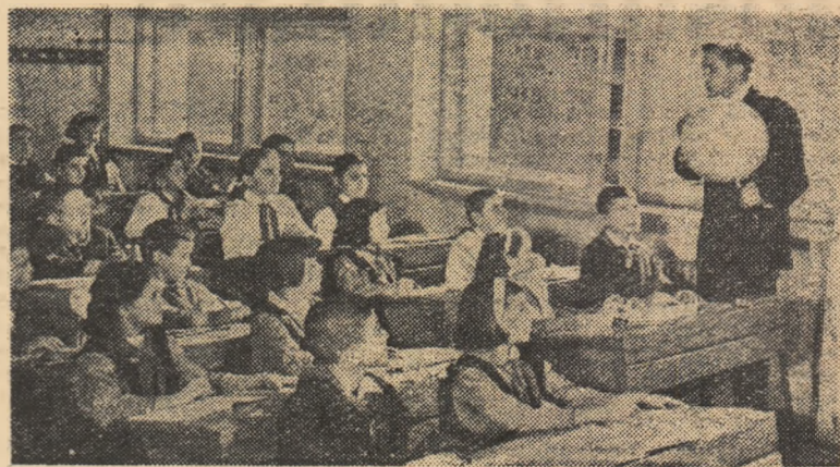
Oră de geografie la Școala de 7 ani nr. 4 din București

Școlile din regiunea București obțin rezultate tot mai bune în munca instructiv-educativă. Aceste rezultate se datoresc în mare parte organelor de învățămînt din această regiune, care, îndrumate și sprijinite de organele de partid, acordă multă atenție îmbunătățirii activității cadrelor didactice. În acest scop secția regională de învățămînt și cultură editează un buletin de informații care este difuzat la raioane și în școli și a elaborat un îndreptar metodic al muncii directorului. Printre acțiunile întreprinse în regiune se mai numără și cursurile de pregătire organizate acum, în vacanța de iarnă, pentru profesorii de limbă română și matematică ce nu au studii de specialitate, ca și instructajul organizat pentru pedagogii de la internatele din regiune.