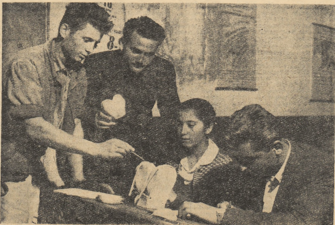
Un grup de tineri colectivști din comuna „23 August”, regiunea Dobrogea, elevi la cursurile serale ale școlii din comună, studiind un mulaj în laborator

M-am gîndit la cîteva soluții pentru a îndrepta această situație. Una din ele este colaborarea strînsă și susținută cu profesorii de matematică. Profesorul de fizică poate arăta colegilor săi care predau matematica acele cunoștințe ce le vor fi necesare muncitorilor-elevi în desfășurarea anumitor lecții de fizică și le poate propune