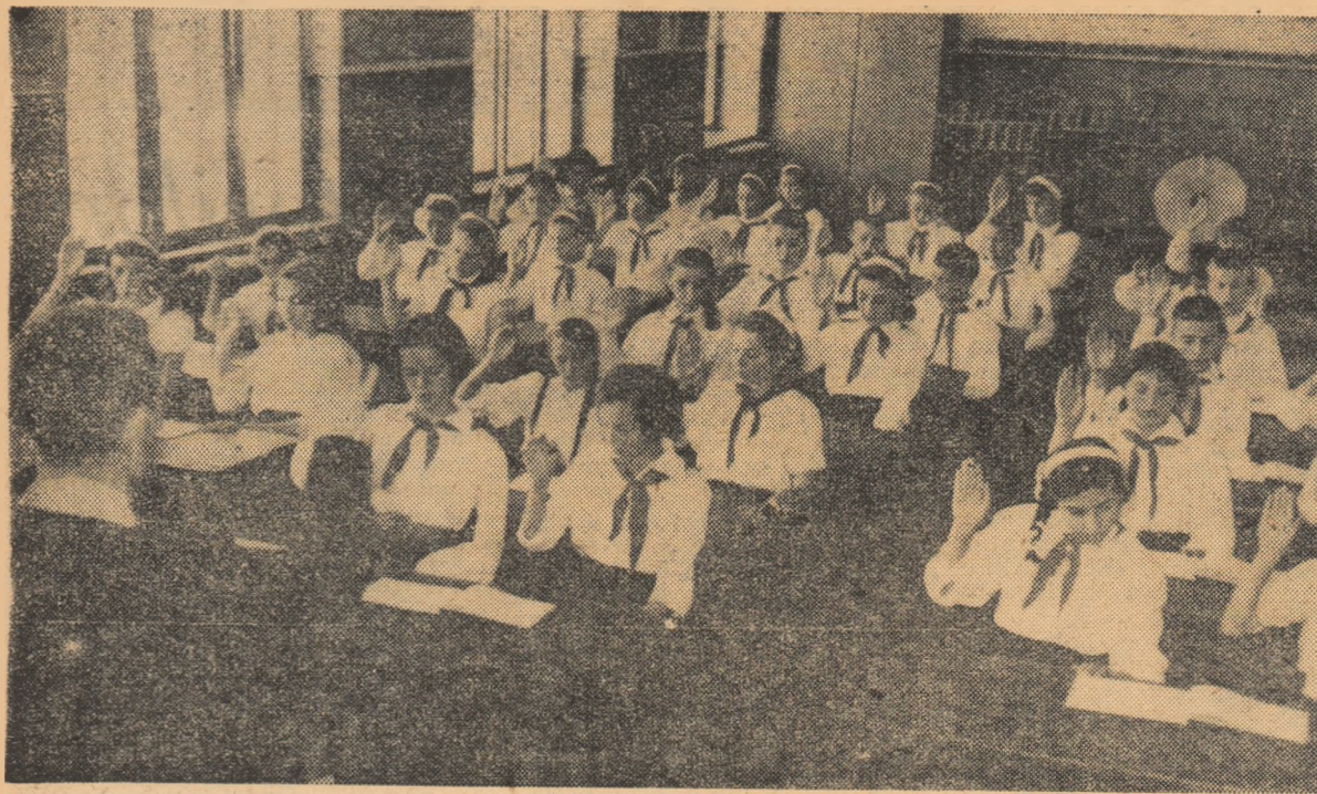
Intr-o oră de muzică la Școala medie nr. 1 „N. Bălcescu” din Craiova.