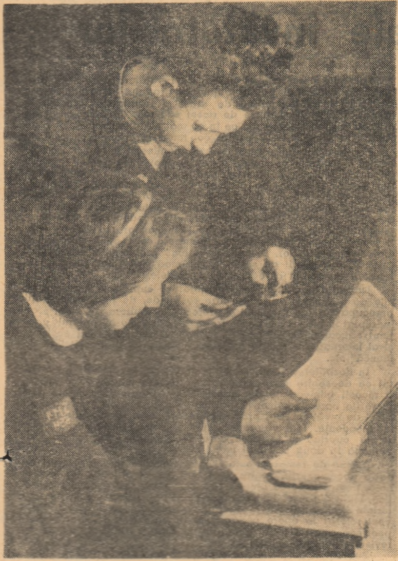
Elevii clasei XI-a de la Școala medie nr. 1 „Nikos Beloiannis” din Timișoara desfășoară o bogată activitate practică. Iată-i pe doi dintre ei verificând în uzină unde își fac practica exactitatea pieselor confectionate și pregătite pentru asamblare.