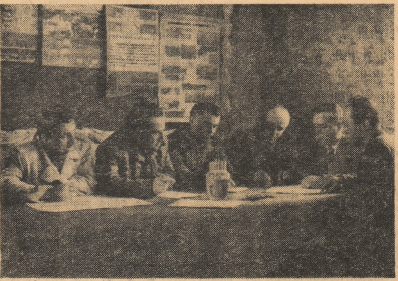
La cîmîinul cultural al comunei Bogza, raionul Rîmnicul Sărat. Colectivul de conferențieri, din care fac parte și cadrele didactice din comună, pregătesc planul de activitate pe trimestrul în curs.