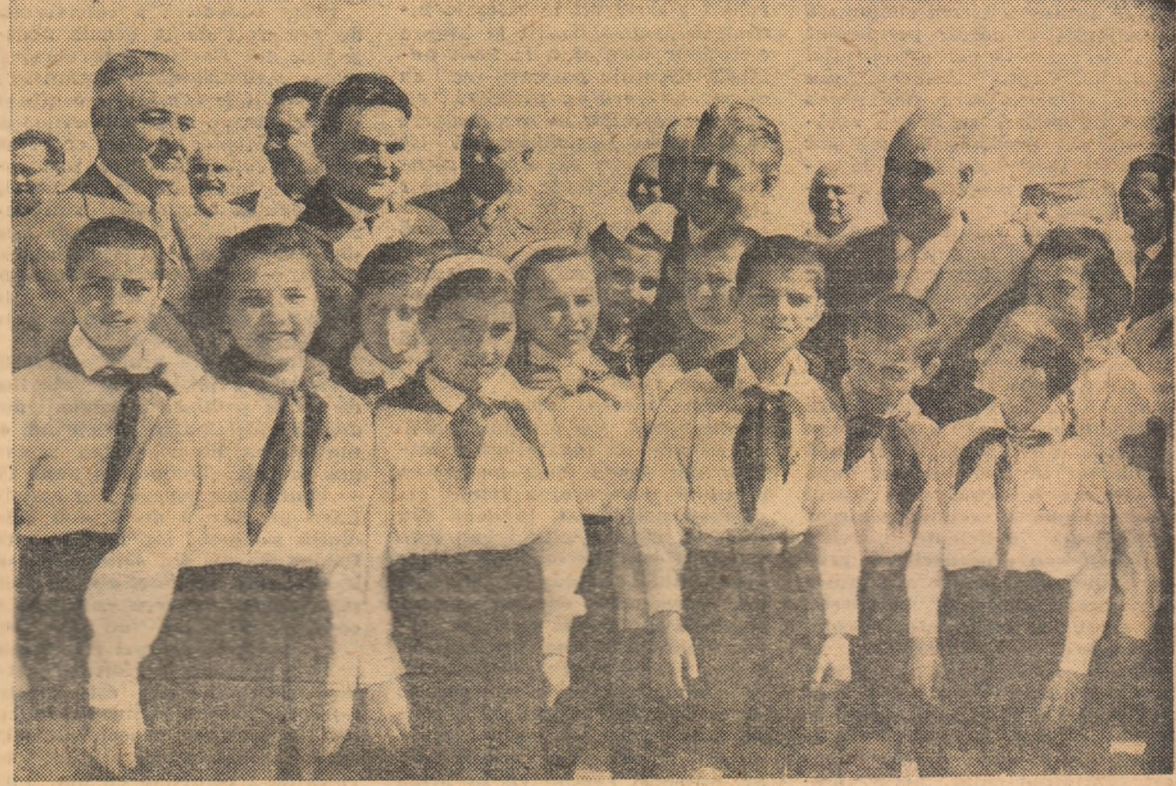
Miercuri la amiază a sosit în Capitală delegația de partid și guvernamentală a R. S. Cehoslovace care face o vizită de prietenie în țara noastră la invitația Comitetului Central al Partidului Muncitoresc Român, Consiliului de Stat și guvernului R. P. Romine. În fruntea delegației se află tovarășul Antonin Novotny, prim-secretar al Comitetului

Central al Partidului Comunist din Cehoslovacia, președintele Republicii Socialiste Cehoslovace. Caldă primire făcută de poporul nostru solilor poporului cehoslovac constituie o puternică manifestare a prieteniei frățești statornicite între cele două țări.