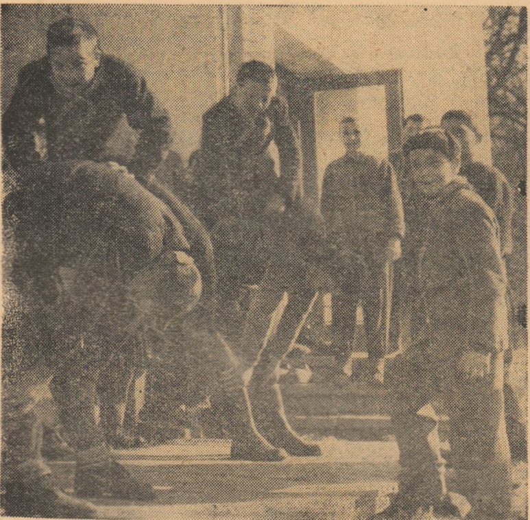
„Capra”, nelipsitul-joc din toate recreațiile...

Învățător, comuna Frințești, raionul Rîmnicul Vilcea