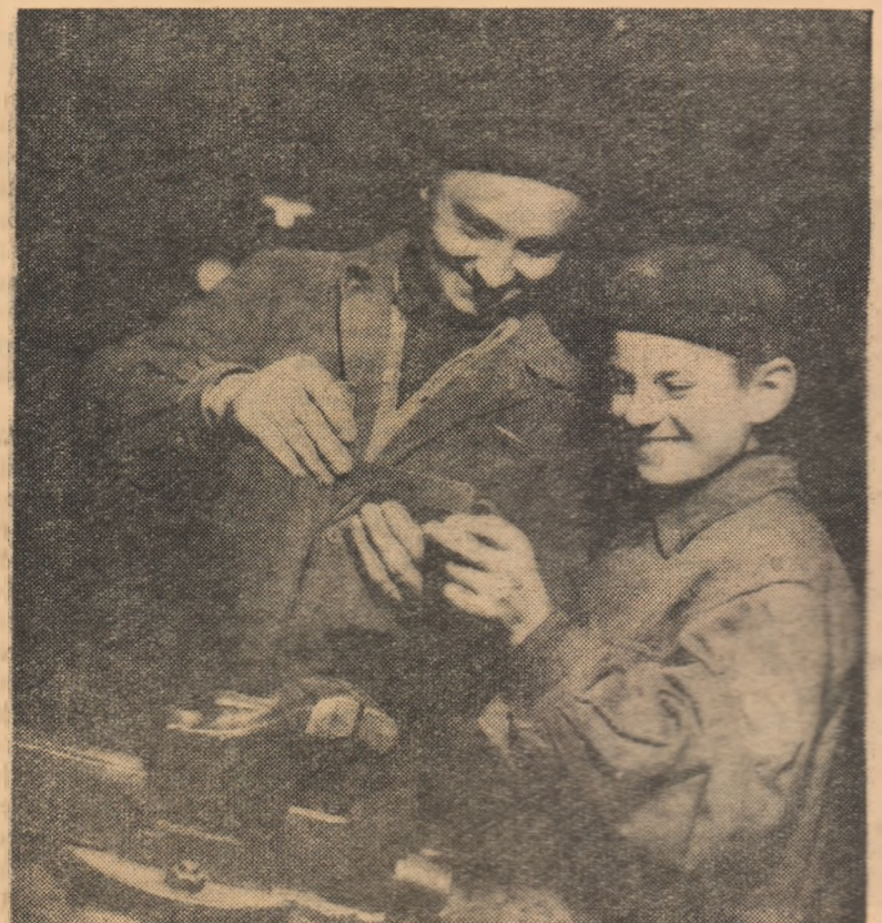
Unul din atelierele Grupului școlar „Steagul Roșu” din Brașov.

inspector în Ministerul Metalurgiei și Construcțiilor de Mașini