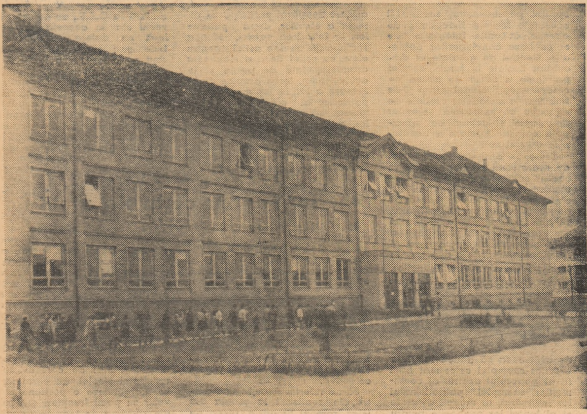
Șiruri nesfârșite de elevi, copiii ai Cehoslovaciei socialiste, se îndreaptă zilnic spre școlile lor dragi.