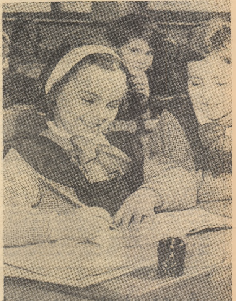
La terminarea școlii de 8 ani acești elevi, ca și sute de mii de colegi de-ai lor din întreaga țară, vor stăpîni cunoștințe temeinice, strîns legate de viață, de practică.