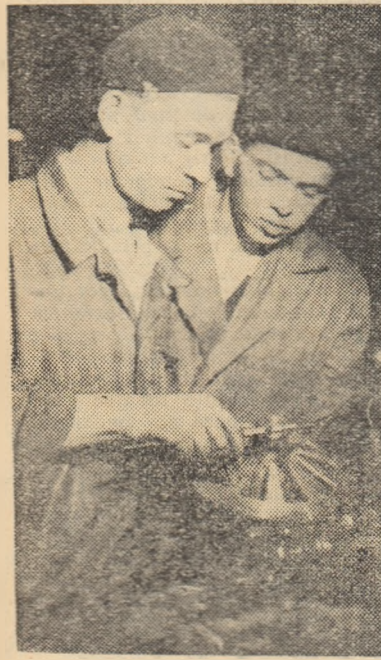
Cunoștințele dobîndite în școala serală îi ajută pe tinerii muncitori să obțină rezultate tot mai bune în munca din producție.

Am putea încheia aici relatarea asupra desfășurării lecției afirmînd că aceasta a decurs satisfăcător și adăugînd doar câteva aprecieri critice. De exemplu faptul