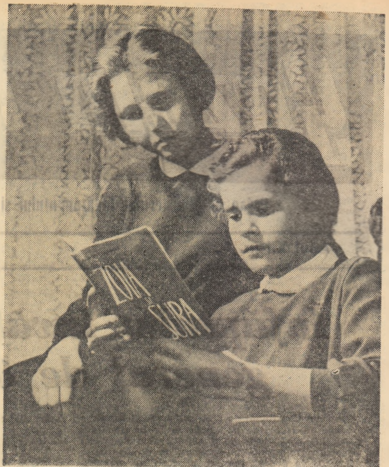
Cu fierbinte admirație citesc elevii școlilor noastre cartea care vorbește despre înalta pildă de eroism a Zoicei Kosmodemianskaia și a fratelui ei Șura.

În ultima parte a orei de dirigiență s-au recitat versuri și s-au cîntat cîntece închinaste marilor prieteni.