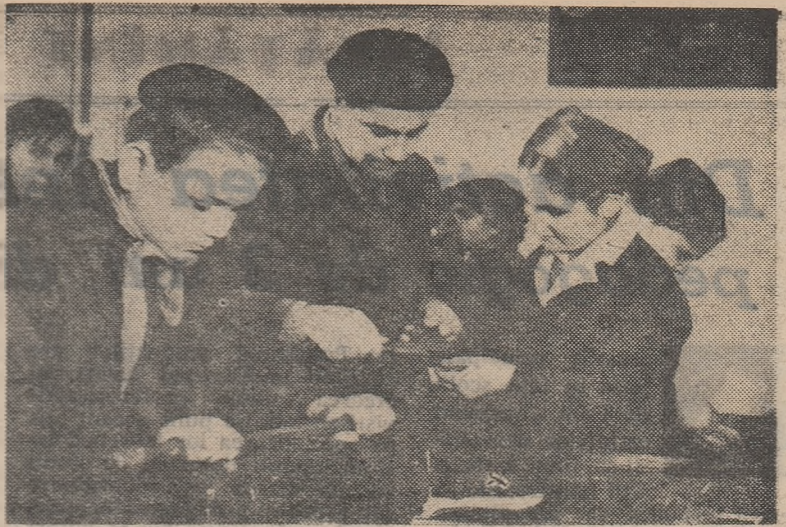
Elevii ai clasei a VII-a de la Școala medie nr. 10 din Capitală în sala de lucrări practice.