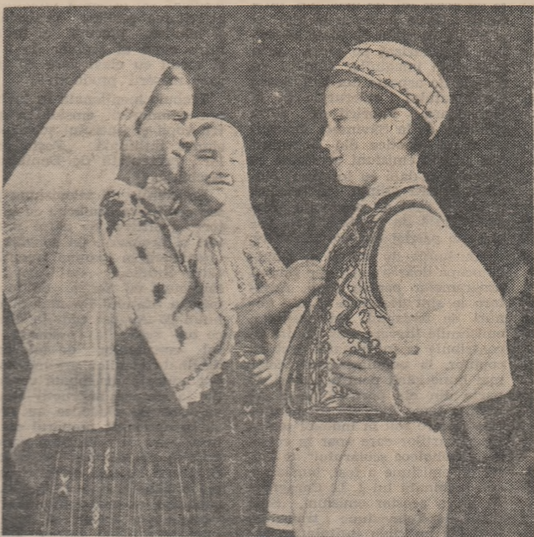
Echipa de dansuri de la Școala de 8 ani nr. 165 din Capitală, care participă la concursul cultural-artistic al pionierilor și școlărilor, se pregătește să intre în scenă.

În vederea viitoarei activități practice a început pregătirea terenului. Elevii au săpat cu cazmaua o suprafață de 5.000 m.p., restul terenului fiind arat cu tractorul. S-a întocmit din vreme și planul exploatarea științifică a terenului, care a fost împărțit în parcele cu diferite de-