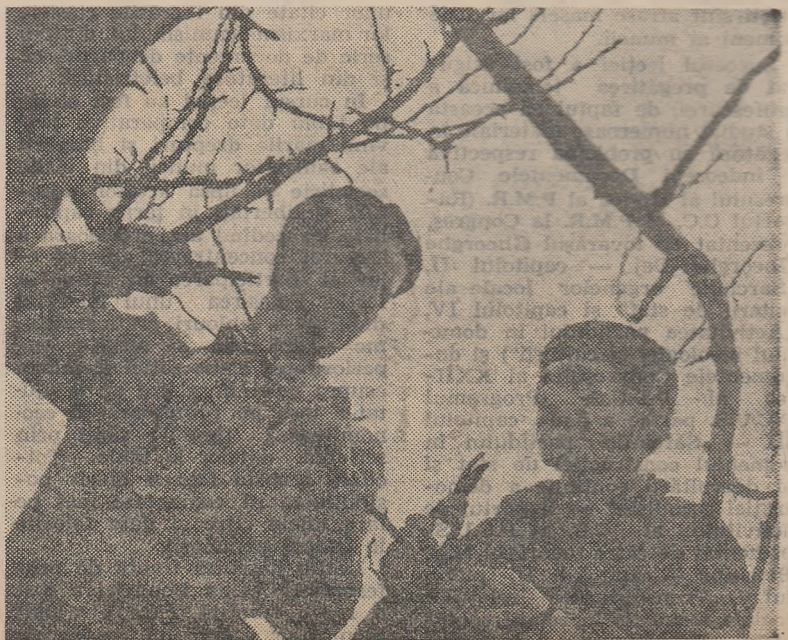
O dată cu primăvara, elevii școlilor agricole care iac practică la G.A.S. Crevedia au început să efectueze lucrări de îngrijire și curățire a