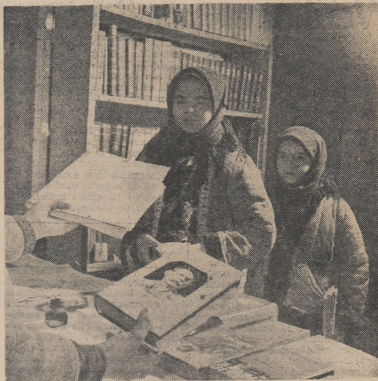
După orele de școală, elevii din comuna Comănești, regiunea Suceava, poposesc adesea la biblioteca căminului cultural. Ei găsesc aici cărți interesante, care le îmbogățesc cunoștințele, le lărgesc tot mai mult orizontul cultural.