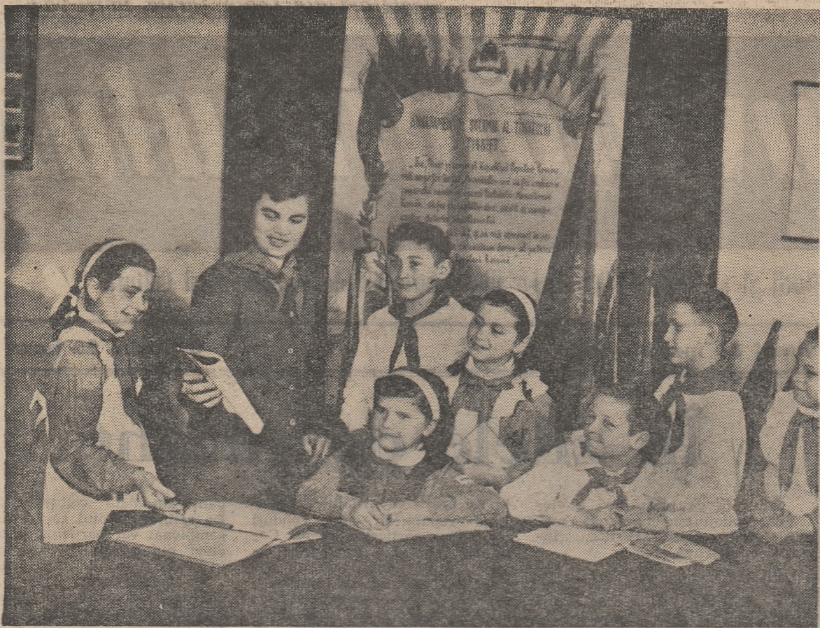
In camera pionierilor de la Școala nr. 175 din Capitală se discută despre materialele care se vor scrie la gazeta de perete.

Cadrele didactice vor găsi de asemenea în acest număr al revistei de referate și alte materiale utile muncii lor, referitoare la metodică predării matematicii, fizicii, chimiei, științelor naturale, bazelor cunoștințelor politice, economiei politice și literaturii, precum și articole despre organizațiile de copii și tineret din Uniunea Sovietică.