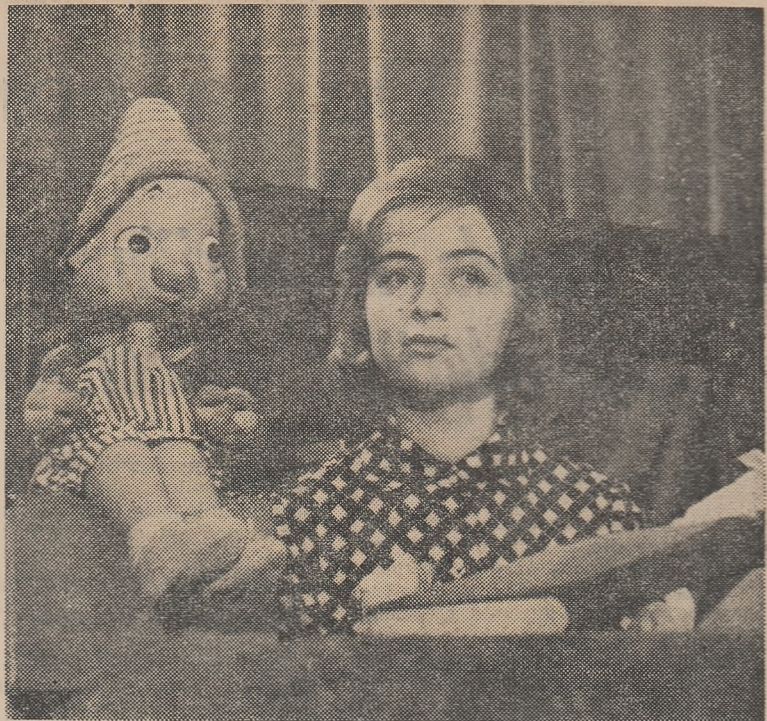
Li cunoașteți? Sînt Daniela și Așchiuță, personaje mult îndrăgite de pionieri și școlari.