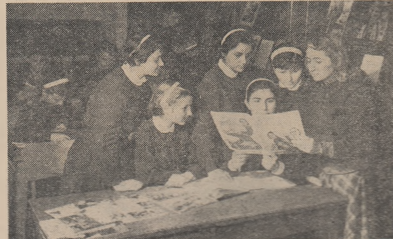
În biblioteca Complexului școlar din Birlad.