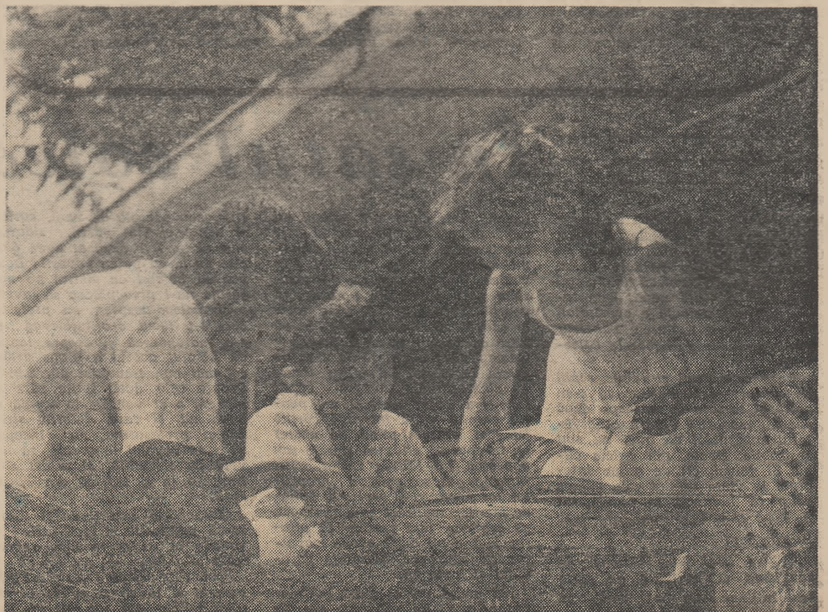
La biblioteca amenajată pentru ei în parcul Herăstrău copiii citesc minunate cărți