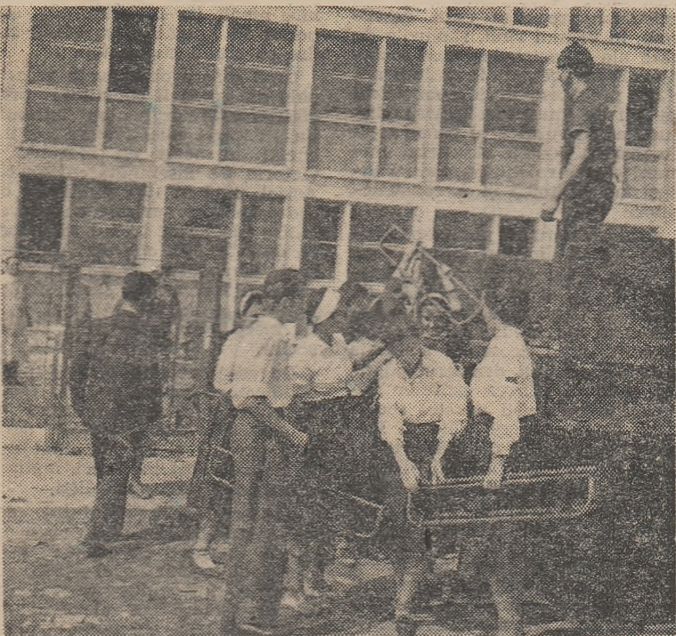
A sosit mobilier nou pentru școală