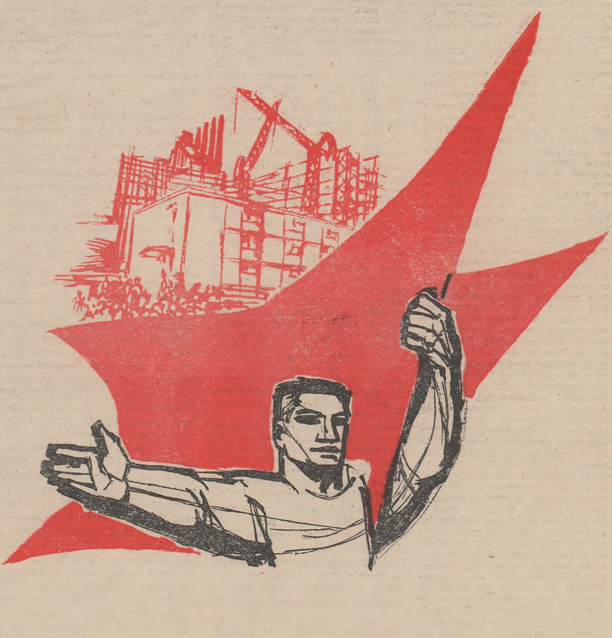
Desen de MARCEL CHIRNOAGA

În anii puterii populare învățămîntul nostru a cunoscut dimensiuni cu totul noi, inimaginabile înainte de 23 August 1944. Numai în anul școlar trecut cursurile celor 15 638 de școli de cultură generală au fost urmate de peste 2 800 000 de elevi, cu peste 1 200 000 mai mult decît în anul școlar 1938-1939. Cele 930 de școli profesionale, tehnice și tehnice de maiștri au fost frecventate în anul trecut de 223 890 de elevi. Hotărîrile de partid și de stat cu privire la generalizarea învățămîntului de 7 ani, cu privire la trecerea la școala de