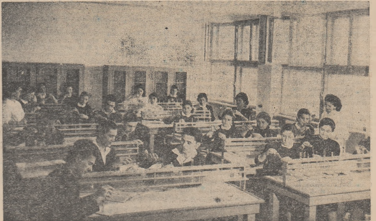
Laboratorul de chimie al școlii medii nr. 2 din Galați, ca multe alte laboratoare cu care sînt înzestrate școlile noastre, oferă elevilor condiții din cele mai bune de învățatură