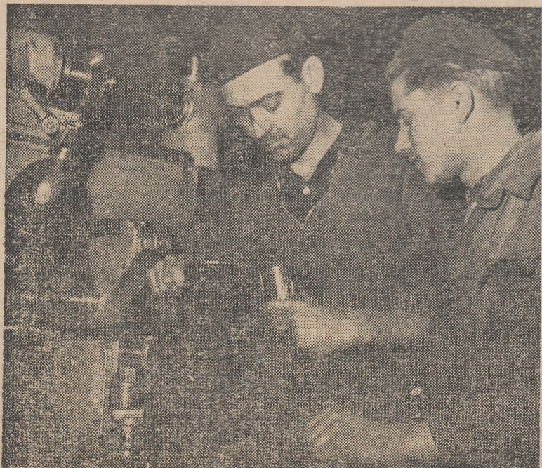
Ucenicii școlii profesionale de pe lîngă uzinele „Iosif Rangheț” din Arad sînt îndrumați cu dragoste și pricepere de cei mai buni muncitori