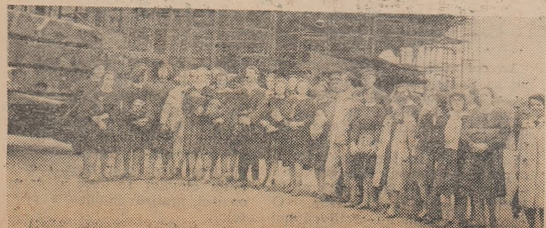
Gata să viziteze șantierul