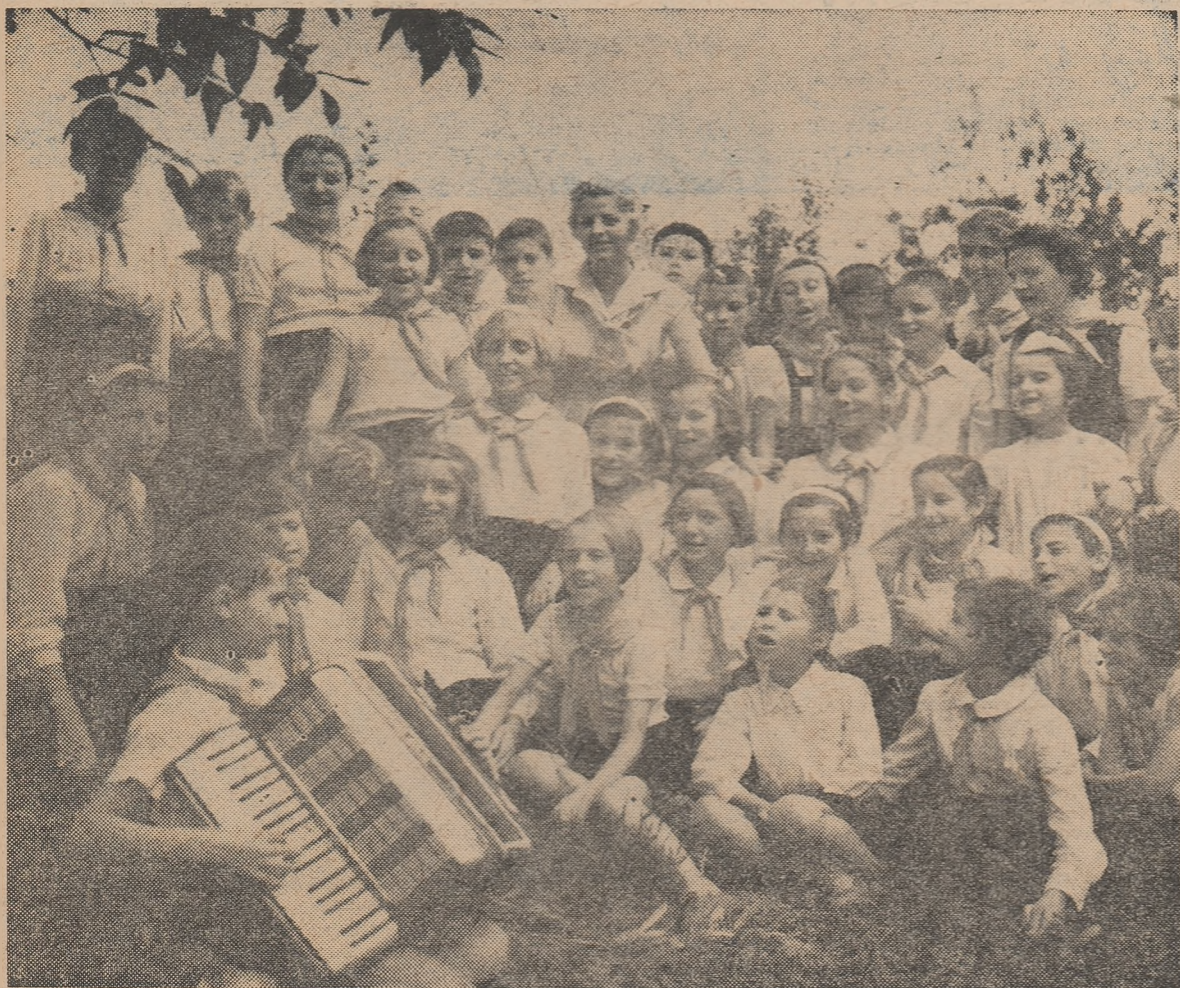
Popas in drumeție