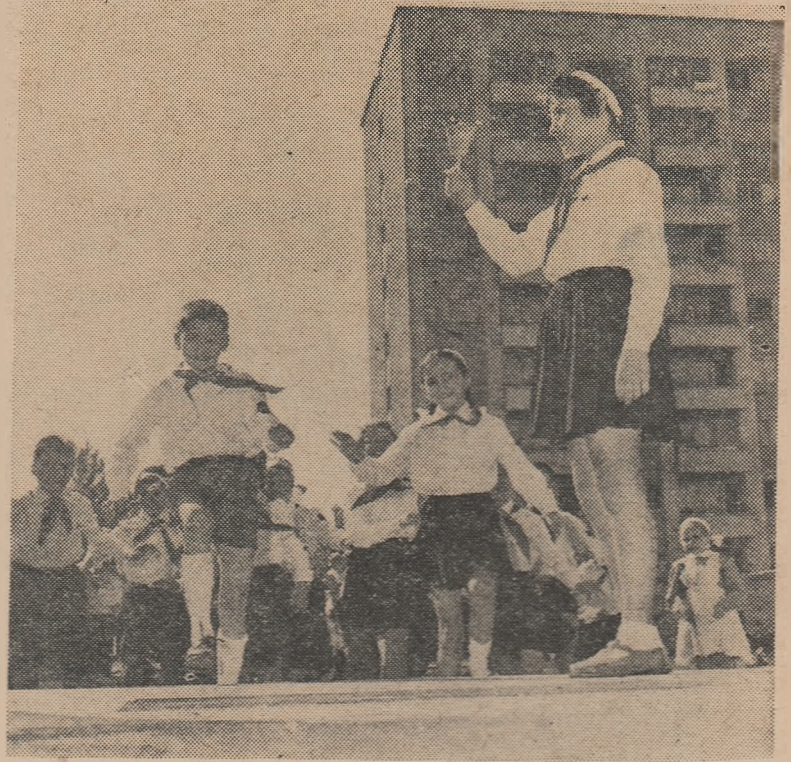
La sfîrșitul recreației clopoșelul îi cheamă pe elevi în clasă