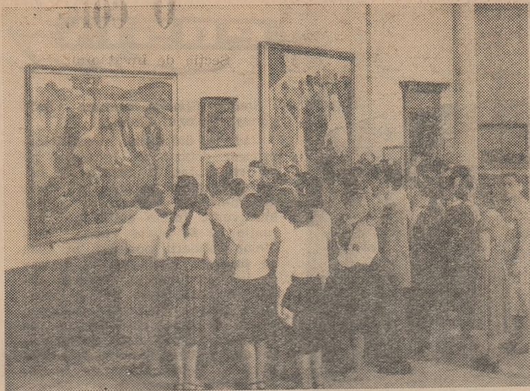
In vizită la Galeria de artă R.P.R.

Cadrelor didactice care, din motive bine întemeiate, n-au depus lucrările personale la institute în termenul stabilit prin regulament, le pot înainta pînă cel mai târziu la data de 10 noiembrie a.c. Lucrările trimise după această dată nu vor mai fi luate în considerare.