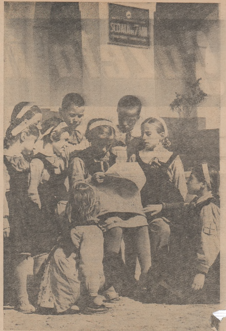
Atenția elevilor este reținută de lecturile interesante pe care le găsec în „Scinteia pionierului”

„Gazeta învățămîntului” urează colectivului redacțional al noii publicații, care întregeste frontul presei pedagogice din țara noastră, spor la muncă și succes în importanta activitate căreia i