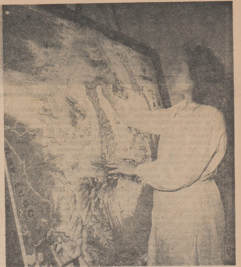
Cu grijă și atenție la I.M.D. hărțile sînt revizuite înainte de a fi trimise în școli

Școala medie nr. 36 are o clădire nouă, construită doar de cîteva ani. Profesorii și elevii acestei școli au toate condițiile pentru a desfășura o muncă rodnică. Laboratoarele școlii dispun de material modern. Școala are sală de festivități și sală de gimnastică, de asemenea utilizate după ultimul cuvînt al cerințelor pedagogiei științifice. Din păcate, grija conducerii școlii pentru folosirea materialului didactic modern cu care a fost înzestrată aceasta lasă de dorit. Astfel, în 1960 au fost trimise acestei școli două aparate de proiecție în valoare de peste 56.000 lei. De atunci ele zac neutilizate în magazie. Directorul școlii, tov. Mihai Vasiliu,