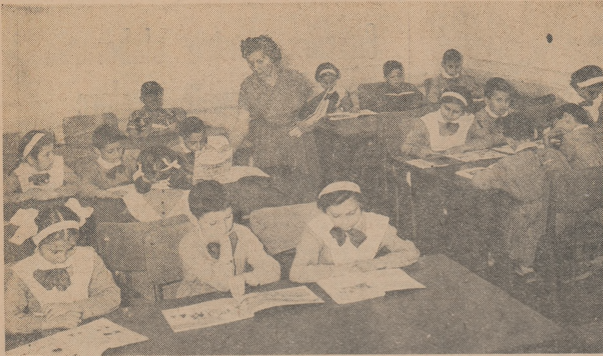
In sala de lectură pentru copii a Bibliotecii centrale, micii cititori care au îndrăgit cărțile vin în număr tot mai mare