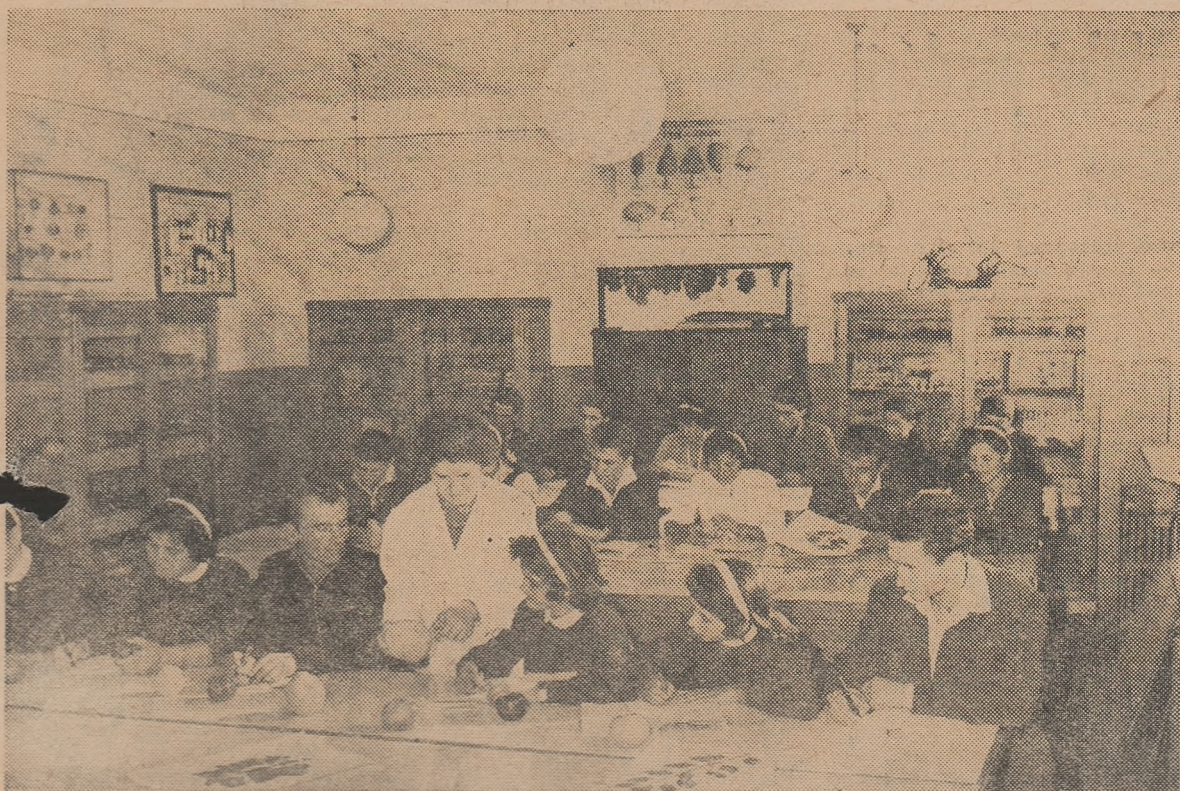
Elevii anului II ai Școlii tehnice horticole din Tirgșorul Nou, regiunea Ploiești, la o lecție practică de pomologie