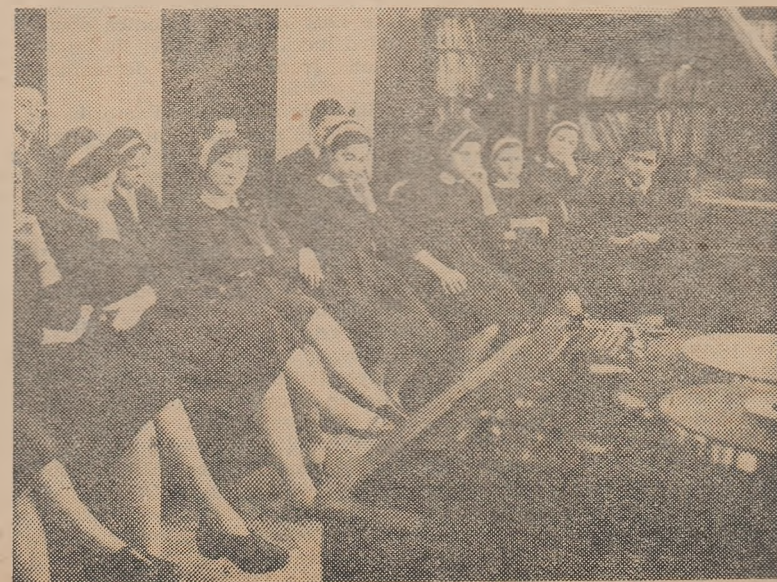
În timpul liber elevii claselor a XI-a de la Școala medie nr. 28 din București participă la auditiile muzicale organizate în școală

La întrebările pe care le puneți vă pot răspunde organele locale de învățămînt.