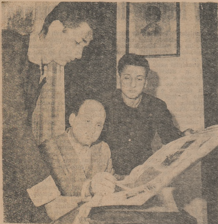
La Grupul școlar profesional și tehnic „23 August” din Capitală Studind părțile componente ale struagului.