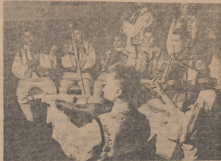
Taraful Centrului școlar agricol din comuna Sendriceni, regiunea Suceava, este cunoscut prin bogata sa activitate în toată regiunea.