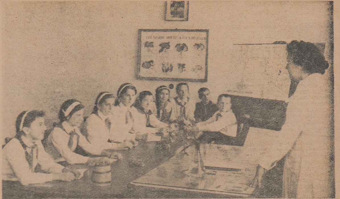
La cercul de viticultură de la Palatul Pionierilor din București

Abonindu-vă pe un an întreg vă asigurați colecția completă a gazetei. Costul unui abonament pe un an este de 13 lei. Abonamentele se fac la oficiile poștale, factorii poștali și la difuzorii voluntari din unitățile de învățămînt.