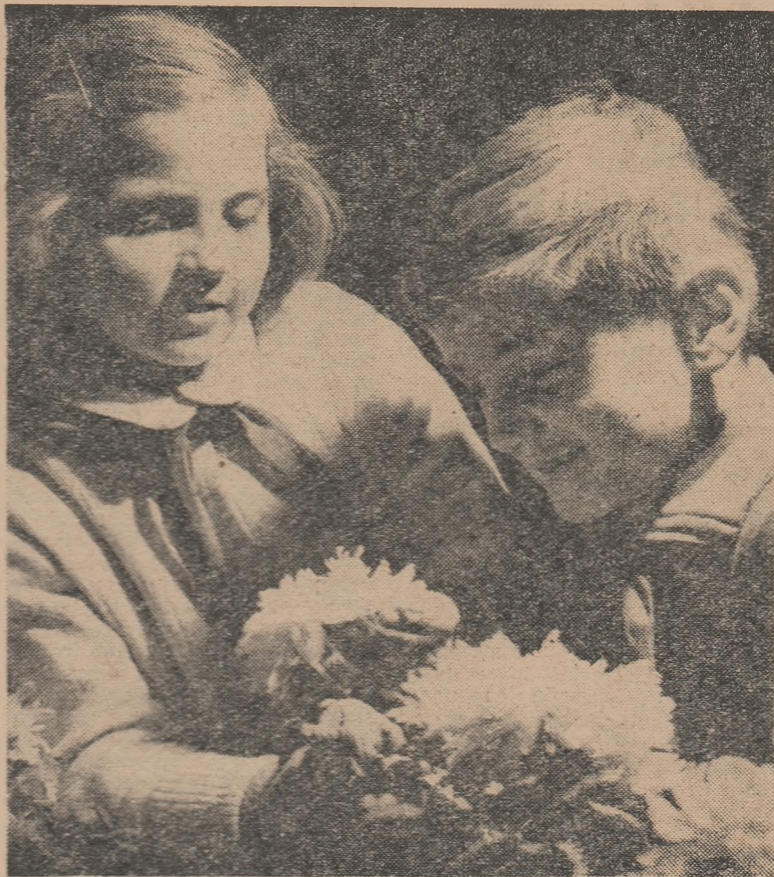
Cite petale are iloarea? Grea problemă pentru micii naturaliști!