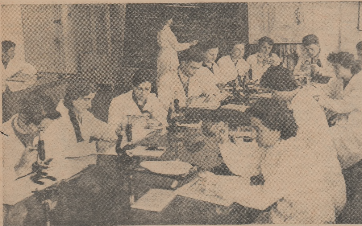
Lucrări practice în laboratorul de zoologie de la Institutul pedagogic de 3 ani din Bacău.