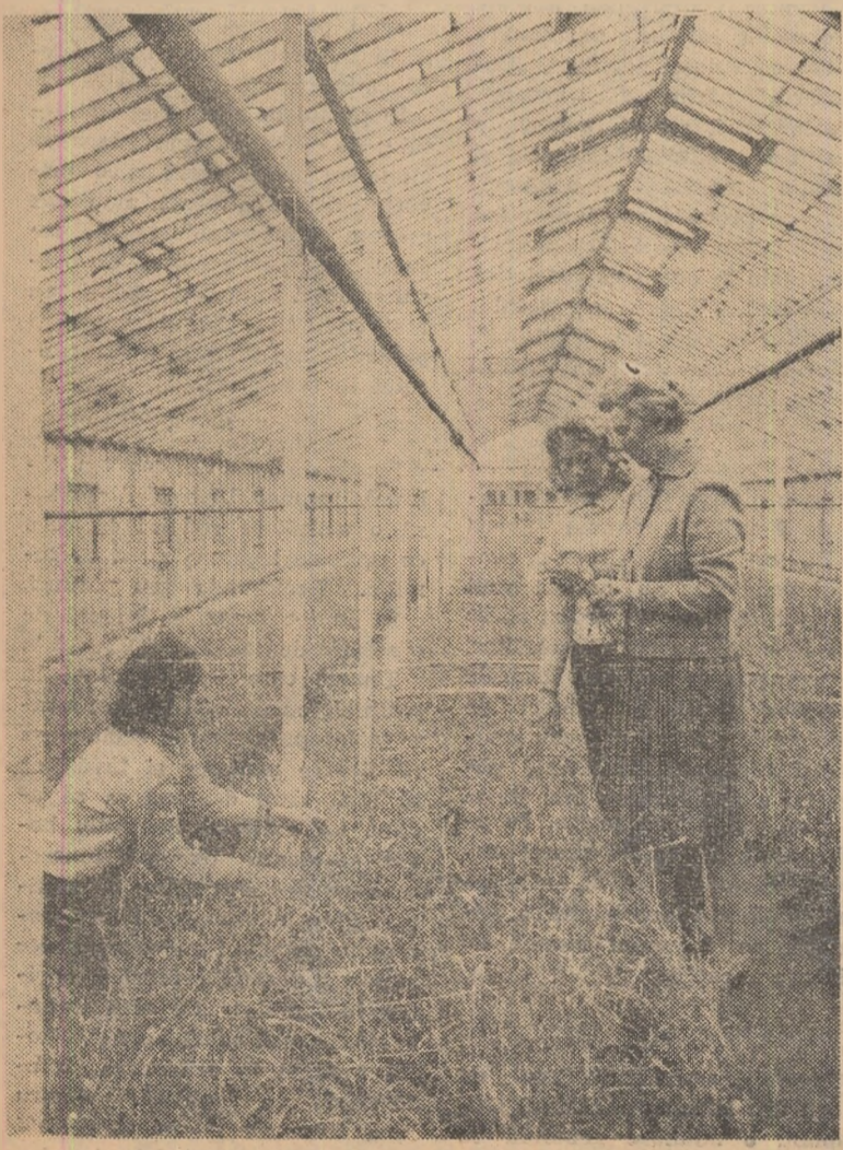
Explicații în seră la Popești-Leordeni

În același timp, delegația a împărtășit din experiența școlii din țara noastră care este privită cu interes de pedagogii sovietici.