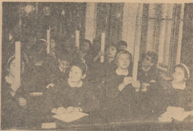
Studiul mișcării uniforme rectilinii în laboratorul de fizică al Școlii medii nr. 3 din Timișoara.