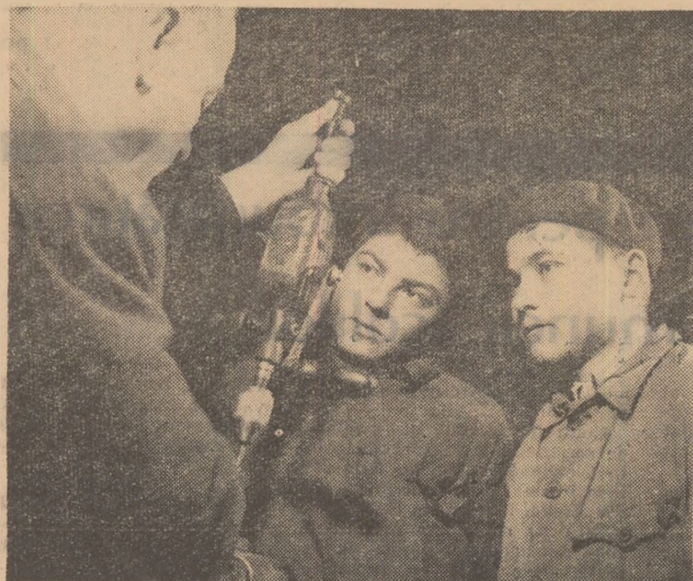
Demonstrații practice cu mașina de găurit la Școala profesională de muncitori agricoli din Călugăreni