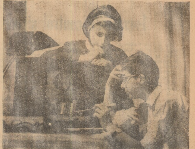
Radiofonia a devenit o adevărată pasiune pentru elevii clasei a IX-a de la Școala medie nr. 27 din Capitală.