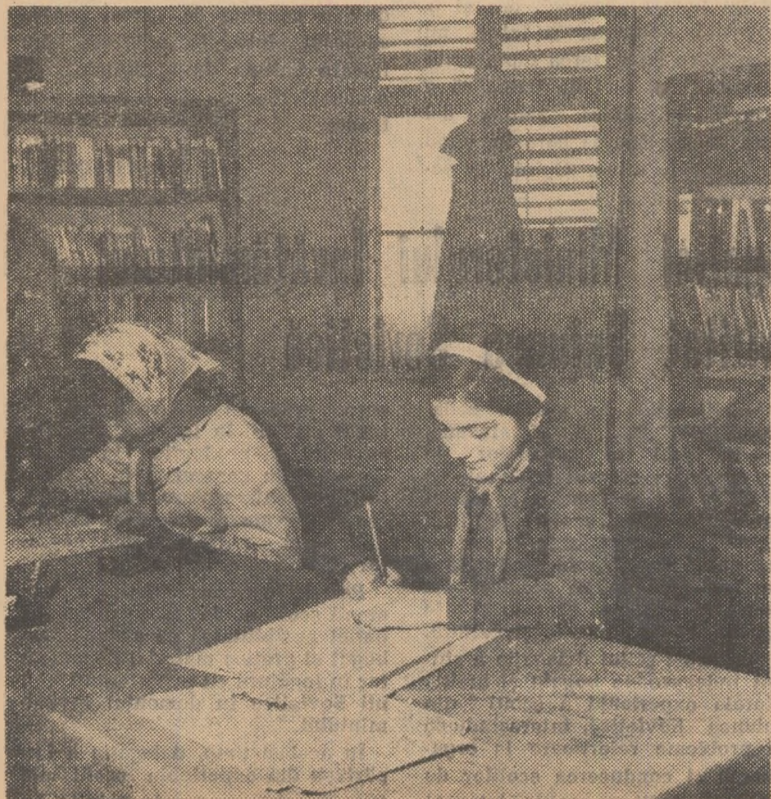
Scolărije în biblioteca din comuna Lunca

Temele care sînt discutate în ședințele cu părinții au fost fixate la începutul anului școlar, așa că fiecare profesor și învățător să aibă timp de ajuns ca să adune un material ilustrativ bogat, să aleagă exemple concrete, care să-i intereseze pe auditorii. Pînă în prezent au fost prezentate expuneri pe următoarele teme: „Educația estetică a copiilor în familie”, „Ce cărți trebuie să citească copiii noștri”, „Rolul familiei în orientarea profesională a copiilor”. Pentru luna februarie este planificată tema „Căile și metodele de educare ateist-științifică a copiilor”.