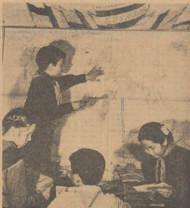
La clubul Prieteniei între popoare din orașul Hasaverta, R.S.S.A. Daghestană, pionierii fac schimb de mărci, insigne etc.