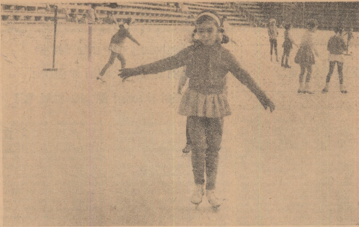
In pofida acestei toamne prelungite numeroși copii merg zilnic la patinoar.