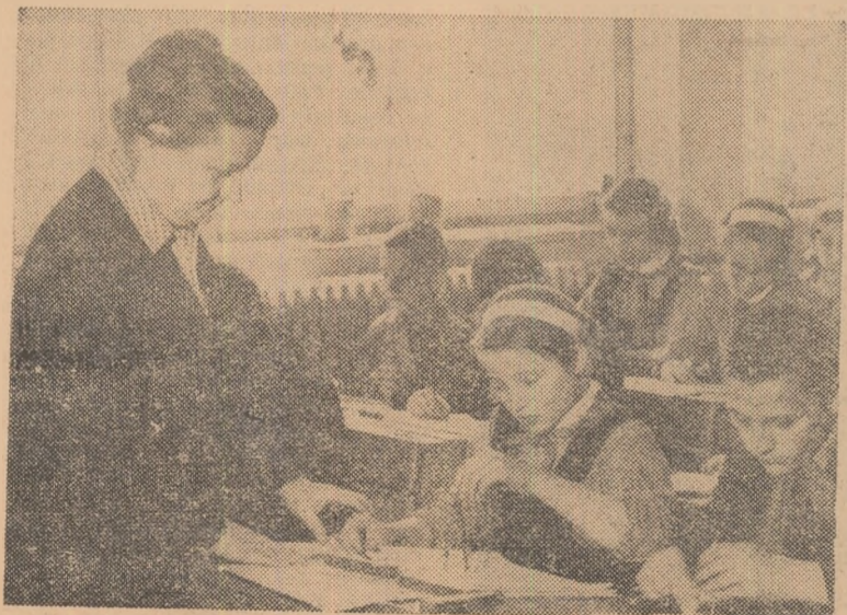
La ora de desen