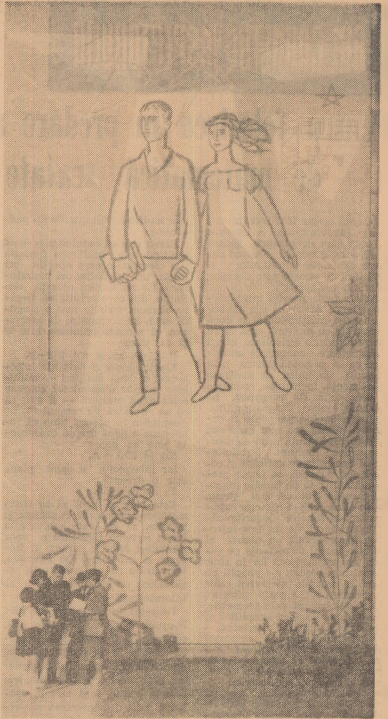
Fațada ornamentată plastic a Școlii medii nr. 34 este unul din succesele evidente ale colaborării creatoare între arhitecți și artiștii plastici

Este limpede că asemenea aglomerări nejustificate de elemente decorative al căror stil este foarte deosebit nu pot contribui la aspectul estetic al școlii,