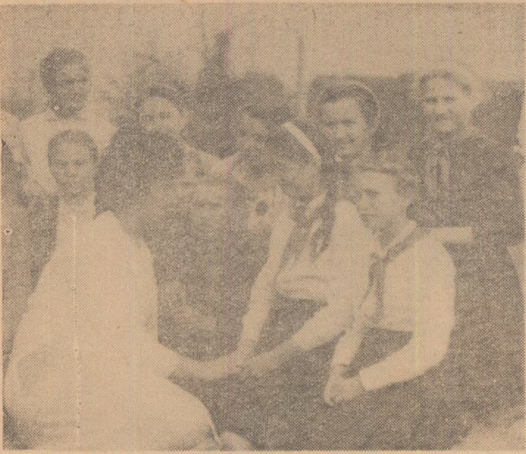
Diriginta se vorbește cu elevele ei (la Școala de 8 ani din Caraorman)