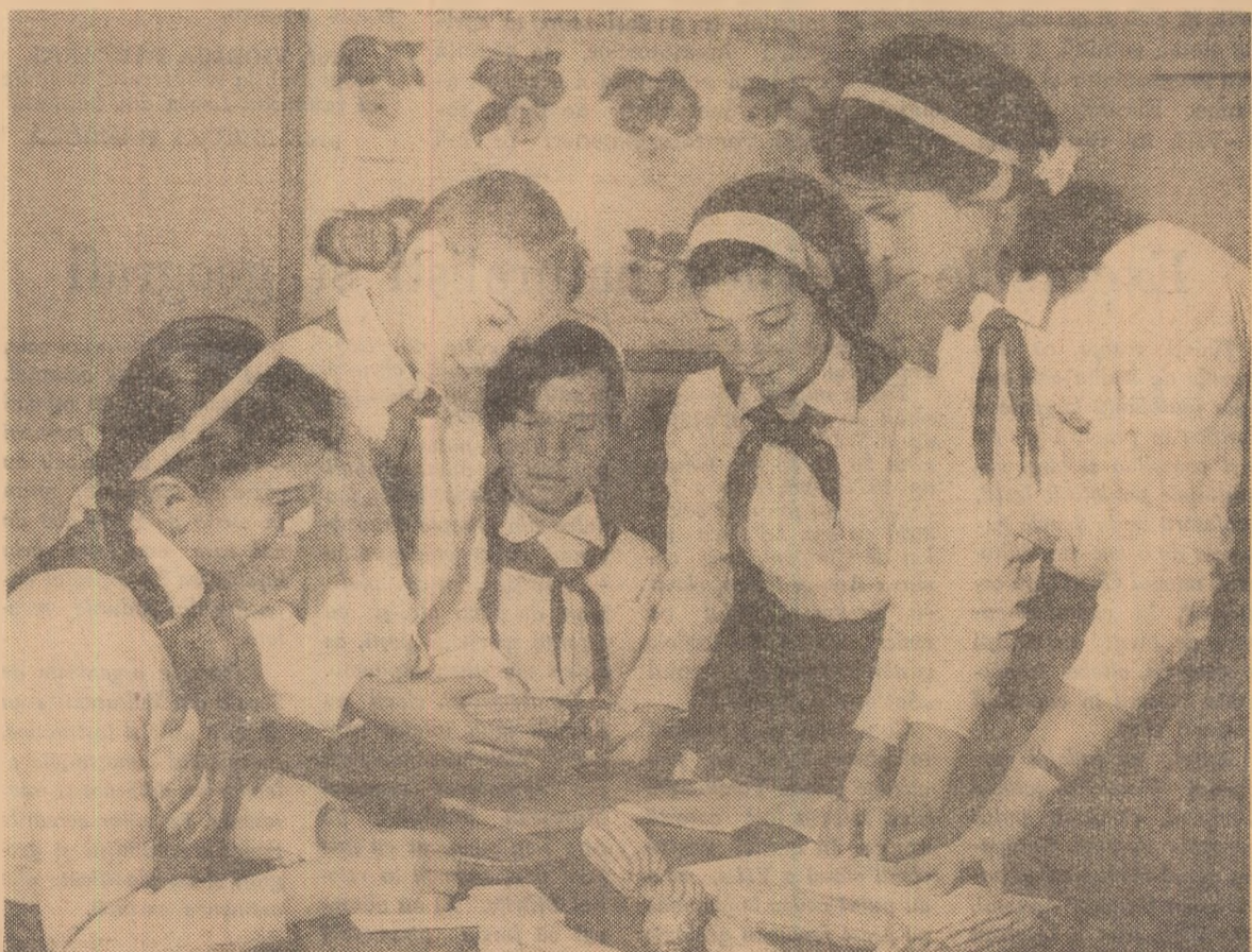
Agronomii de mîine.