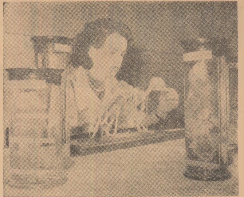
La I.D.M. se finisează un material didactic pentru lecțiile de științe naturale.

inspector general în Ministerul Învățământului