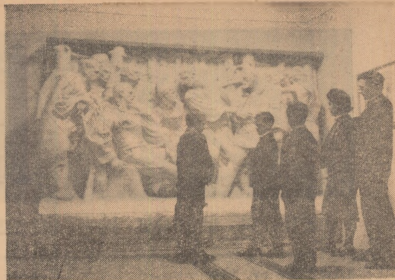
Cu elevii la muzeul regional din Timișoara.