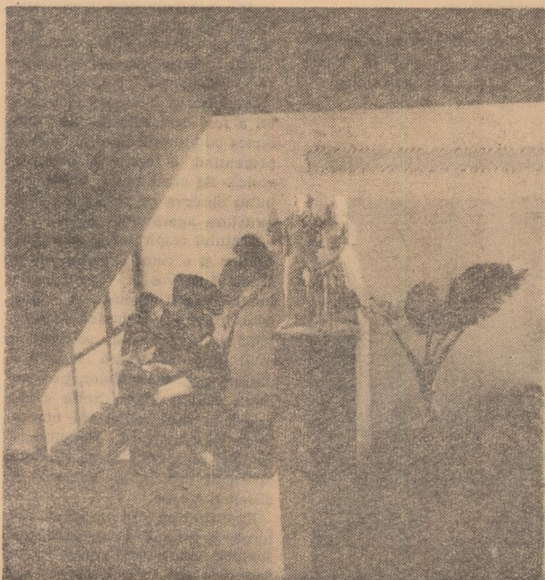
Luminos, frumos ornamentat, holul școlii îi imbie din prima clipă pe elevi către o activitate rodnică de studii