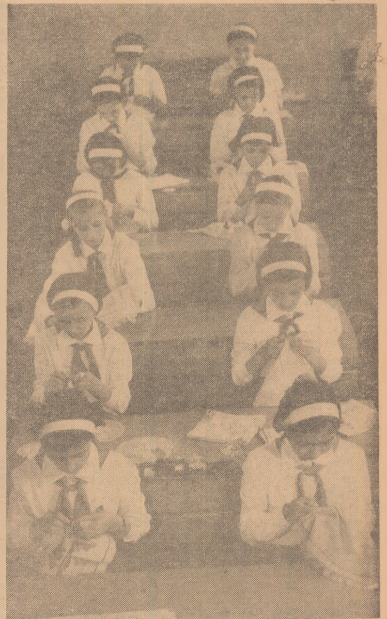
„Oră de lucru manual”