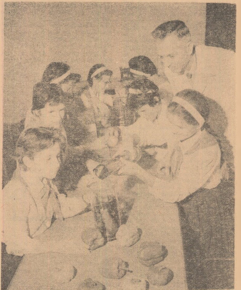
Lucrări practice de conservare a fructelor în formol — la stațiunea micilor naturalisti din Bulea.