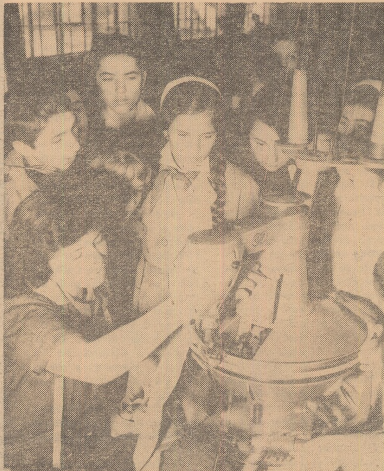
Vizita în fabrică — un prilej de a cunoaște nemijlocit frumusețea muncii direct productive

Se face uneori auzită părerea că această problemă ar putea fi rezolvată numai cu ajutorul unor „specialiști” în orientarea profesională, a unor „comisii de specialitate”, în cadrul unor laboratoare cu aparatură specială. În ceea ce ne privește, deși nu sîntem împotriva unei munci de specialitate în acest domeniu, considerăm că existența unor specialiști constituiți ca un corp separat de școală ar rupe procesul complex al educației, fenomen cu totul neindicat. Înseși datele de laborator, în ultimă instanță, trebuie verificate în procesul viu al muncii didactico-