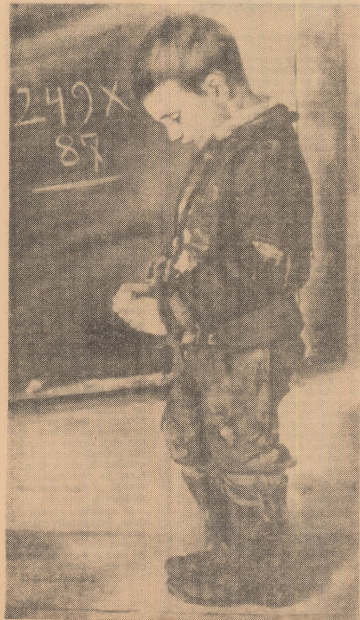
Un școlar de altă dată în viziunea lui Octav Băncilă