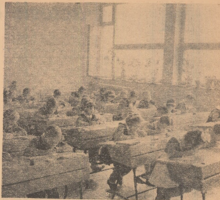
Oră de compunere.