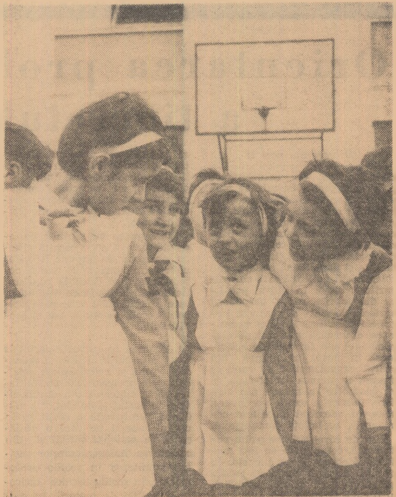
De vorbă cu colegii mai mici.