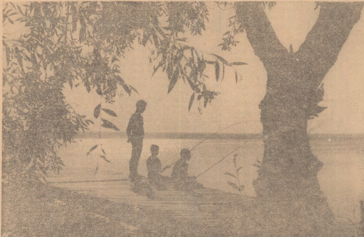
„Micii pescari amatori”