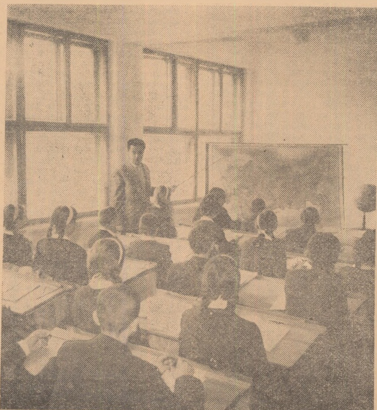
Atenți la explicația profesorului, elevii din Govora urmăresc lecția de geografie

SANDU MIHAIL Institutul de științe pedagogice București