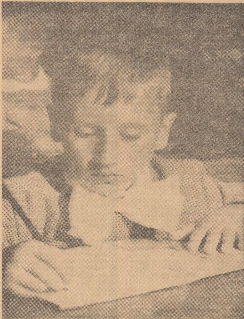
Pregătirea lecțiilor — datorie pe deplin înțeleasă încă din clasa I