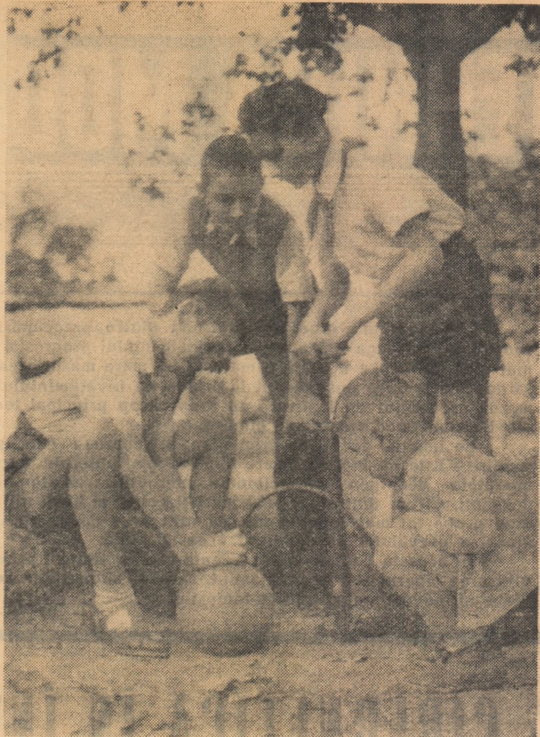
Mingea — tovarăș drag de joacă

Stîlpii se vor monta pe direcția axului mic al terenului, la 1 m. distanță de delimitarea spațiului de joc. Înălțimea totală a stîlpiilor va fi de 3,60 m, un metru fiind îngropați în pămînt. Stîlpii se pot confecționa din lemn sau din țevă (cu diametrul de 12—14 cm). Plasa se fixează pe cîrligele instalate pe stîlpi, la înălțimea de 2,10 m pentru elevii din școlile de 8 ani și de 2,24 m