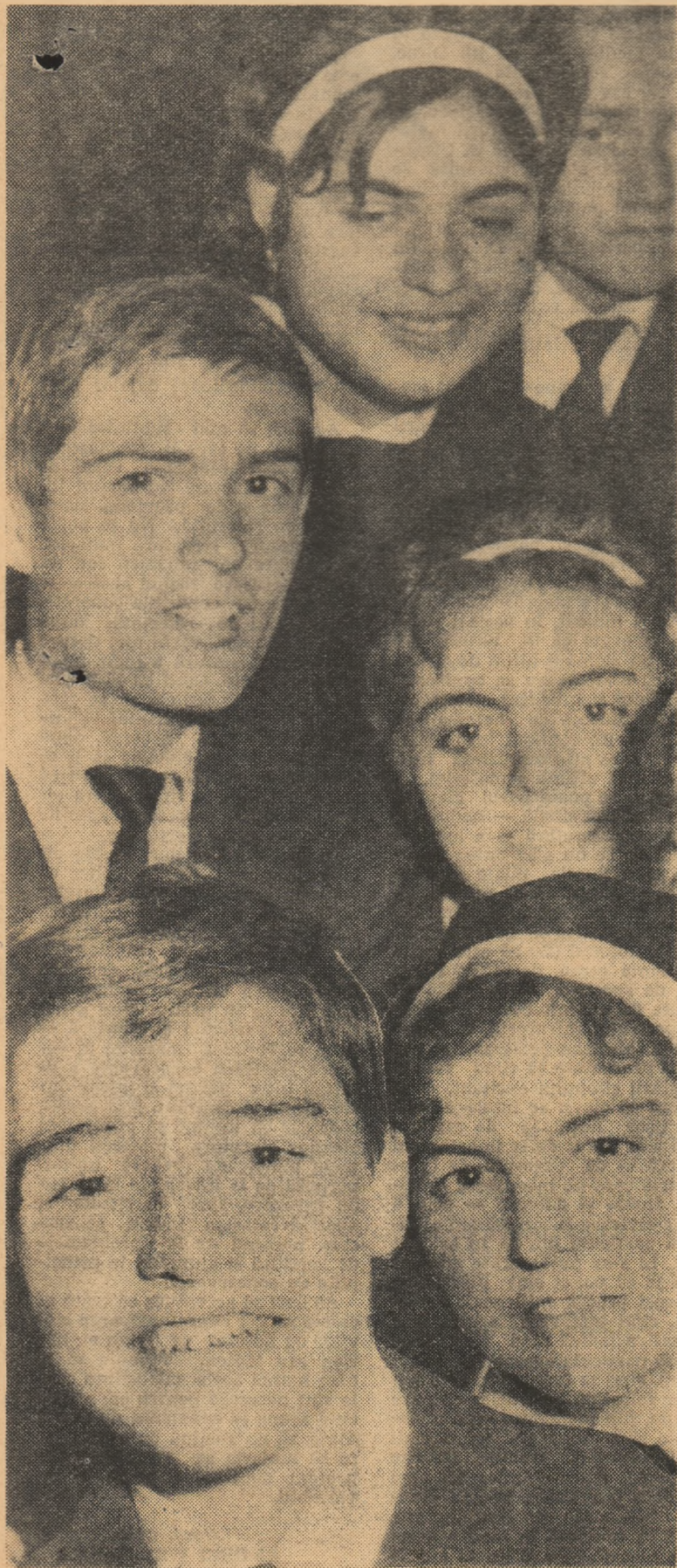
Încercare în viitor