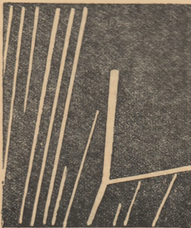
Traiectoriile particulelor alfa la transmutarea azotului în oxigen