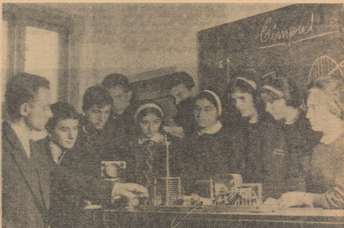
O oră de fizică la Școala medie din Baia Sprie, regiunea Muramureș