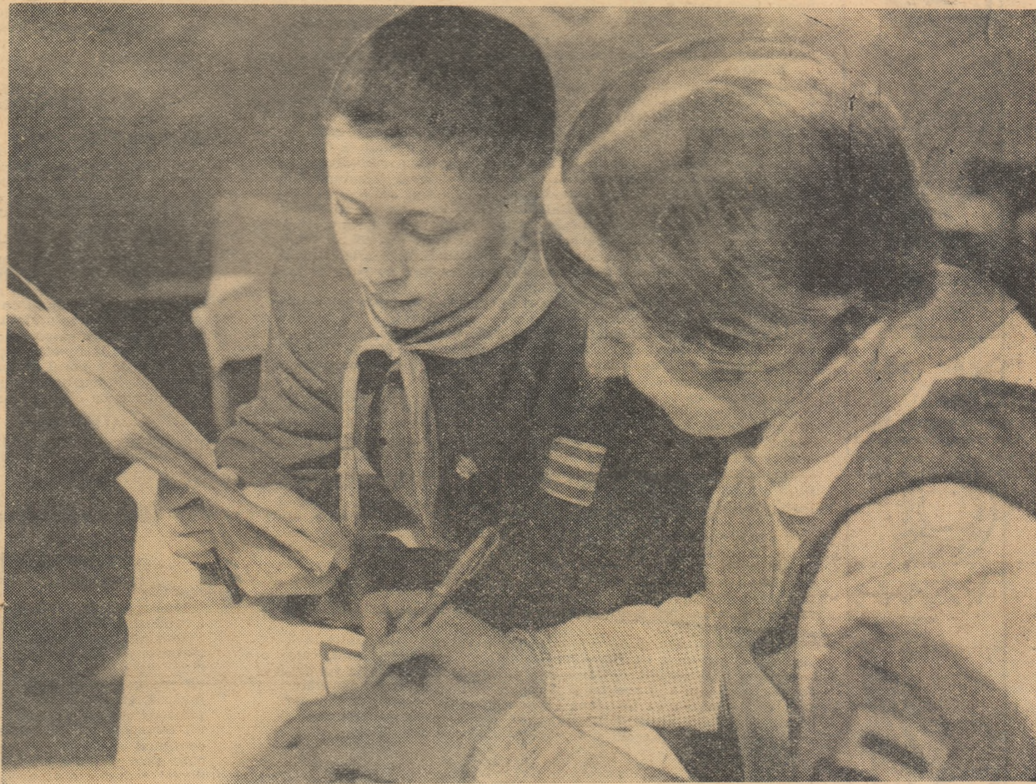
Colegi de școală