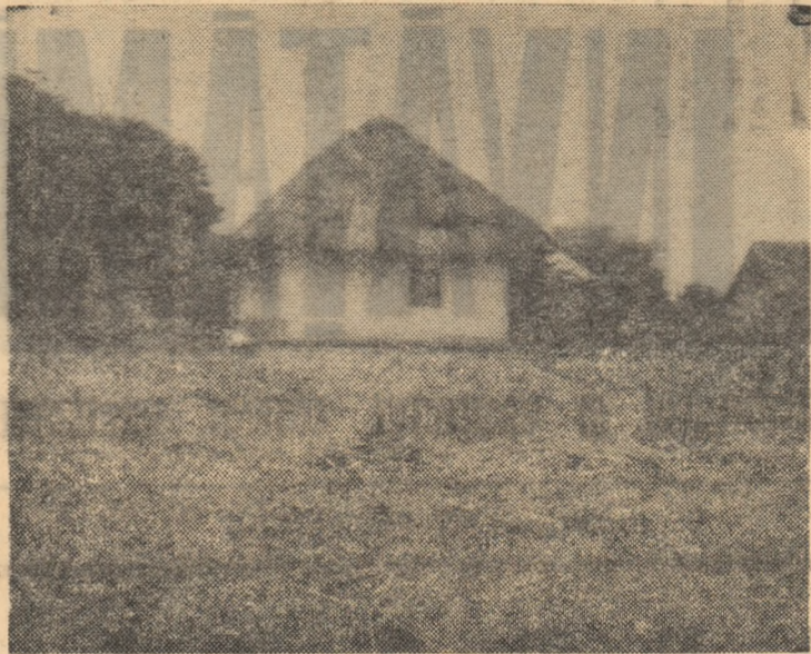
Localul în care a funcționat prima școală primară din Ipotești

Nepăsarea regimului burghez-moșieresc față de cultura maselor populare și prelungita dezinteresare vinovată față de amintirea poetului mort în 1889 se pot urmări și în istoria școlii din satul Ipotești.