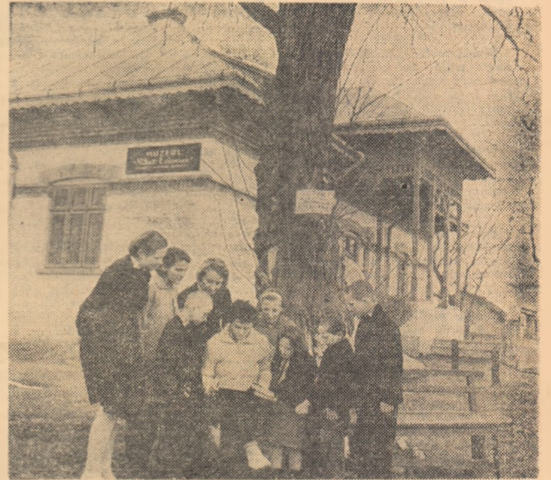
Școlari în vizită la Muzeul „Mihai Eminescu” din Ipotești