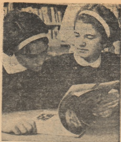
Primele lecturi din vacanță...

În broșura „Admiterea în învățămîntul superior”, ediția 1964, pag. 89, rîndul 14 de sus, se va citi „chimie anorganică” în loc de „chimie organică”.