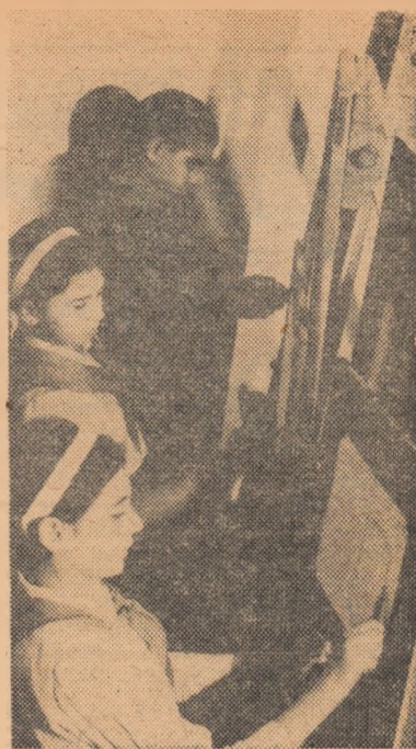
La cercur de pictură de la Casa pionierilor din Roman

Abonamentele se primesc de către factorii postali, oficiile P.T.T.R. și difuzorii voluntari din școli.