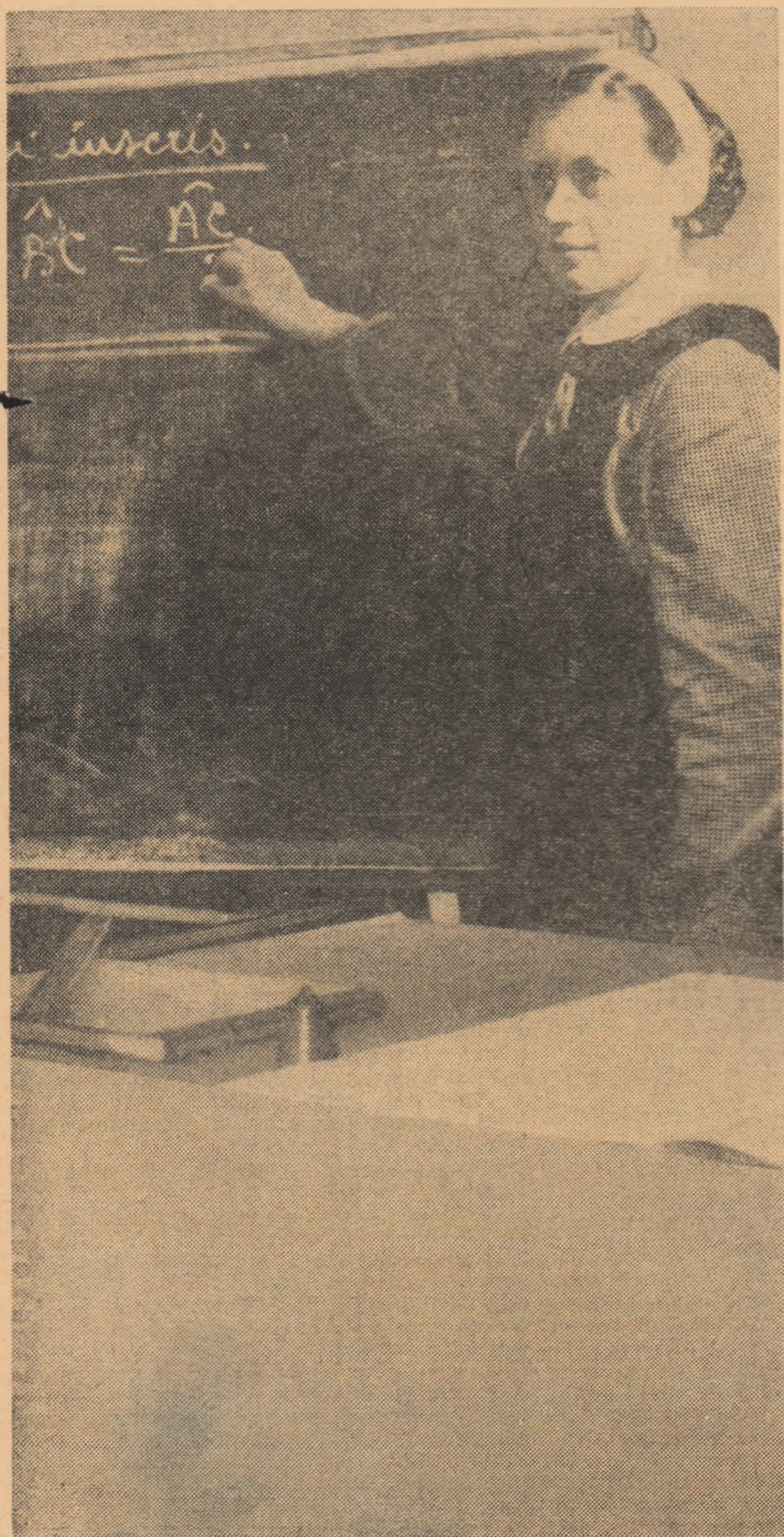
La o oră de geometrie în clasa a VII-a, la Școala de 8 ani din satul Giulești, raionul Fălțiceni.