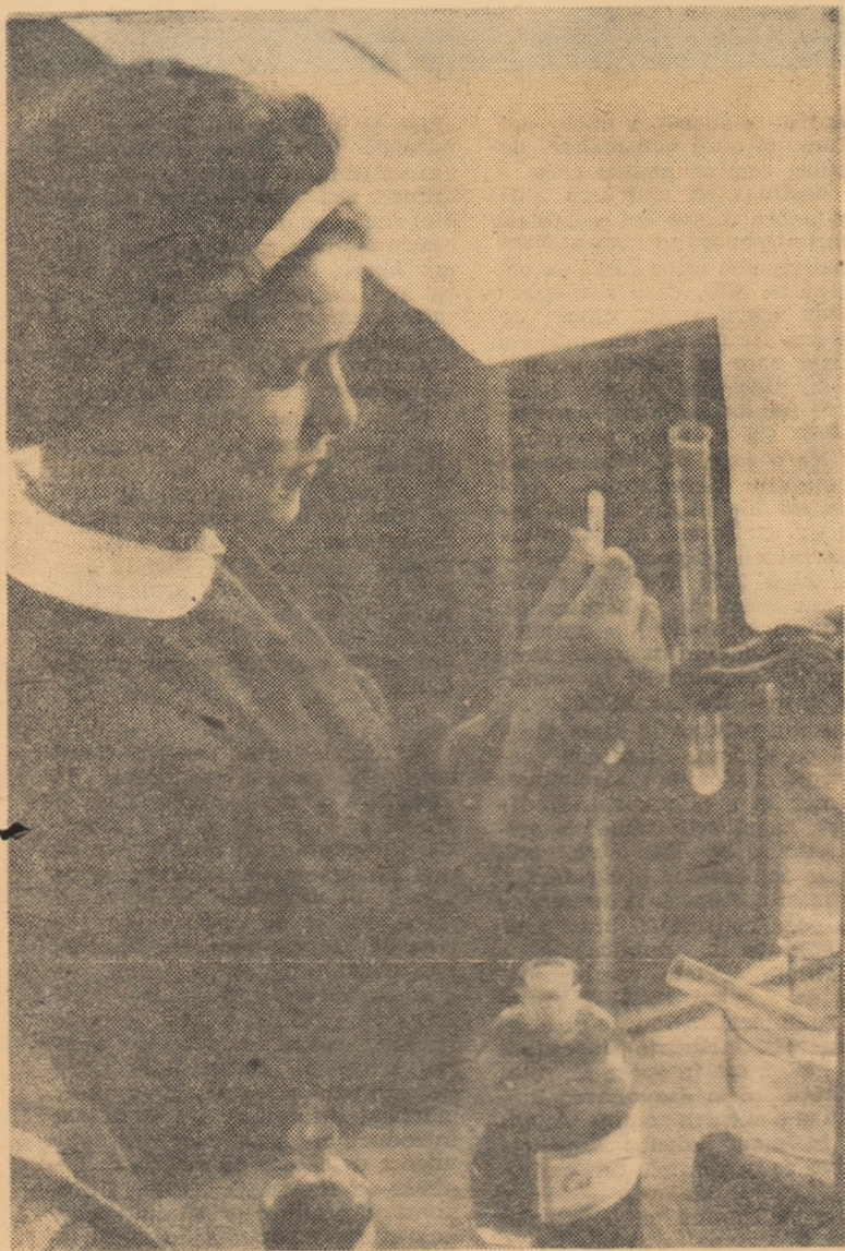
Experiență de chimie în laboratorul Școlii medii nr. 3 din Brașov