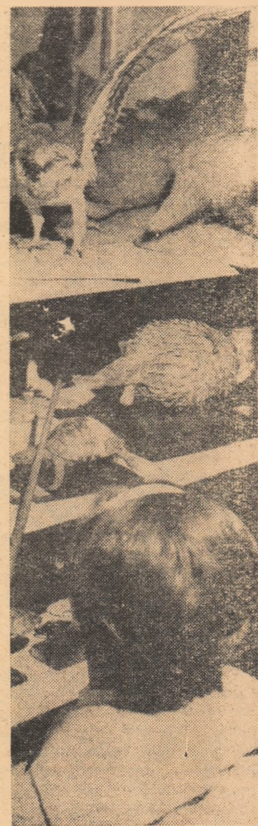
Datorită materialului intuitiv bogat folosit în cursul predării, lecțiile de științe naturale desfășurate la Școala medie nr. 1 din Beiuș sînt urmărite cu viu interes de către elevi.