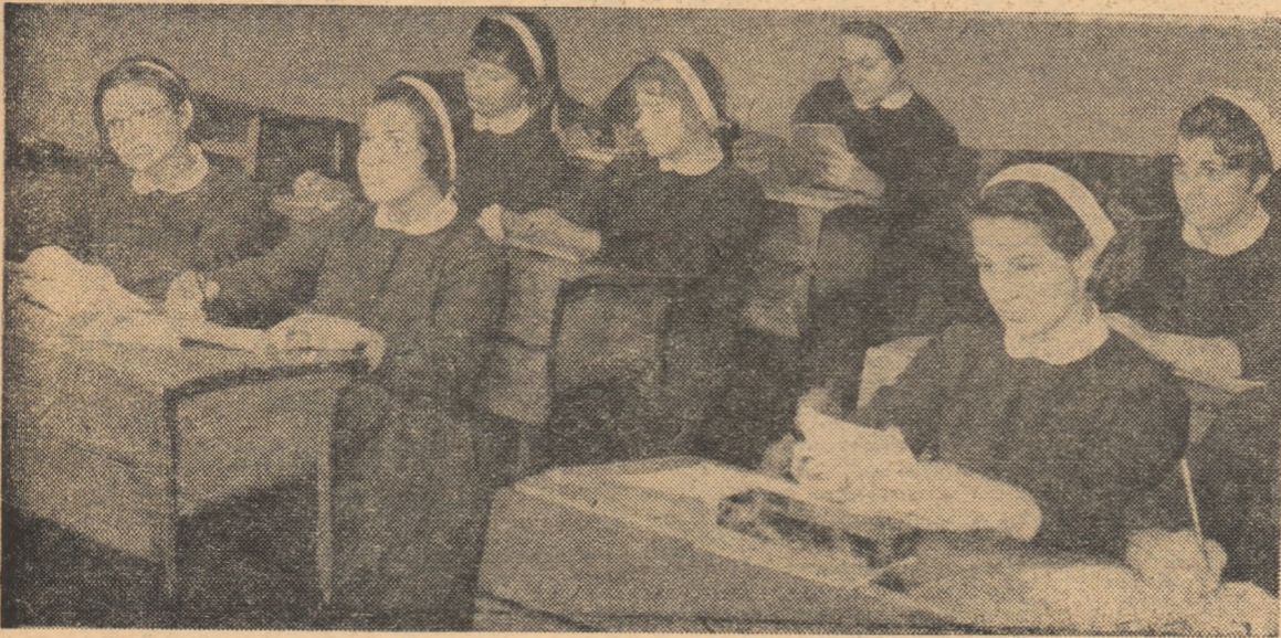
La o oră de limba română în clasa a X-a a Școlii medii „Gh. Lazăr” din Capitală.