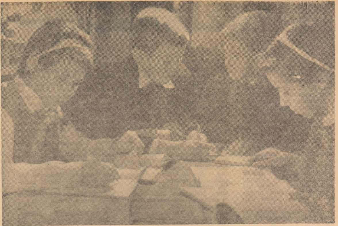
Pregătind lecțiile în colectiv