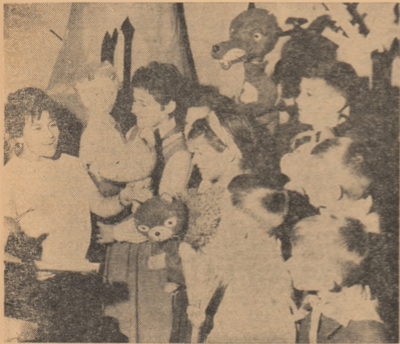
Pregătiri pentru serbările din vacanță

Apariția graficelor îi face pe elevi să-și dorească un loc cît mai bun în clasificare, ceea ce îi stimulează să muncească mai serios. Graficele care apar ulterior arată clar progresele făcute de ei la învățatură.