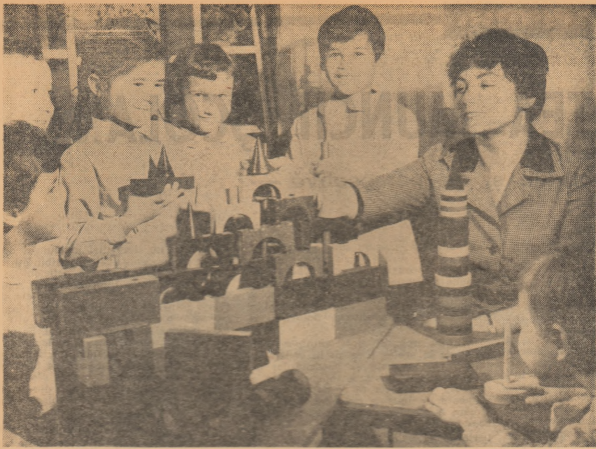
Jocuri de creație cu cărți la Grădinița Nr. 8 din București