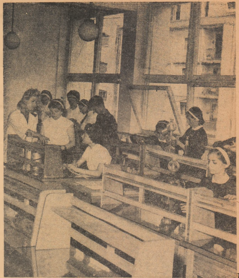
Lucrări practice în laboratorul de chimie

La clasa a X-a prezintă mult interes pentru elevii experiența referitoare la hidratarea ionilor și trecerea în soluție a ionilor substanței înconjurate de dipolii apei. Efectuez de obicei această experiență fie la lecțiile despre metale, fie în cadrul recapitulării trimestriale sau finale. Folosim pentru executarea ei un cilindru de sticlă umplut cu apă distilată, în care am picu-