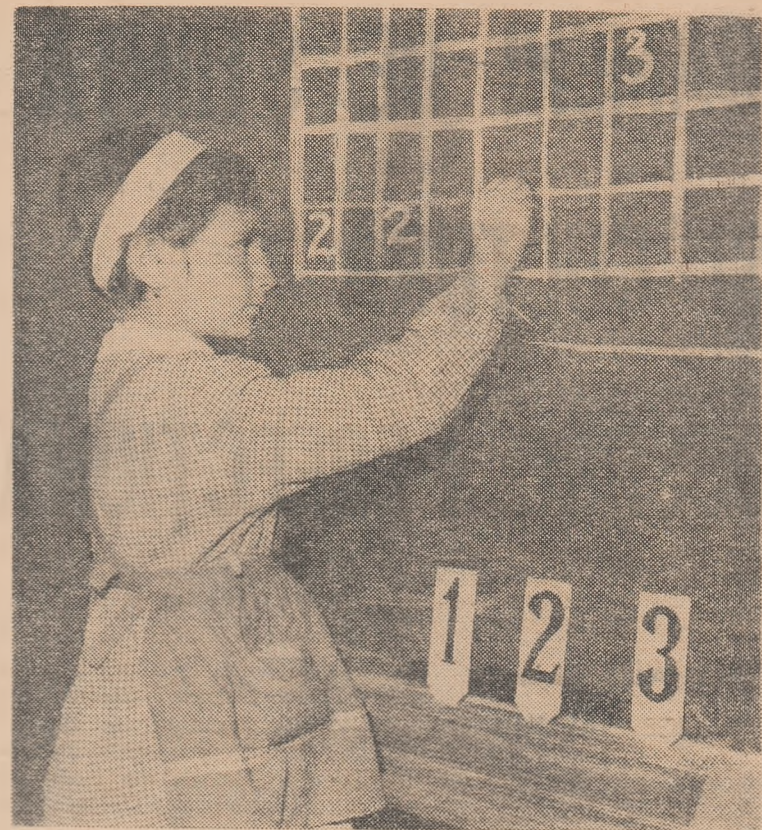
Formarea gândirii matematice a școlărilor poate fi urmărită consecvent chiar de la predarea primelor noțiuni

În legătură cu aceste constatări și încercînd o soluție, colectivul nostru și-a pus două probleme: 1.) stabilirea unui criteriu mai riguros pentru aprecierea gradului de dificultate al unei