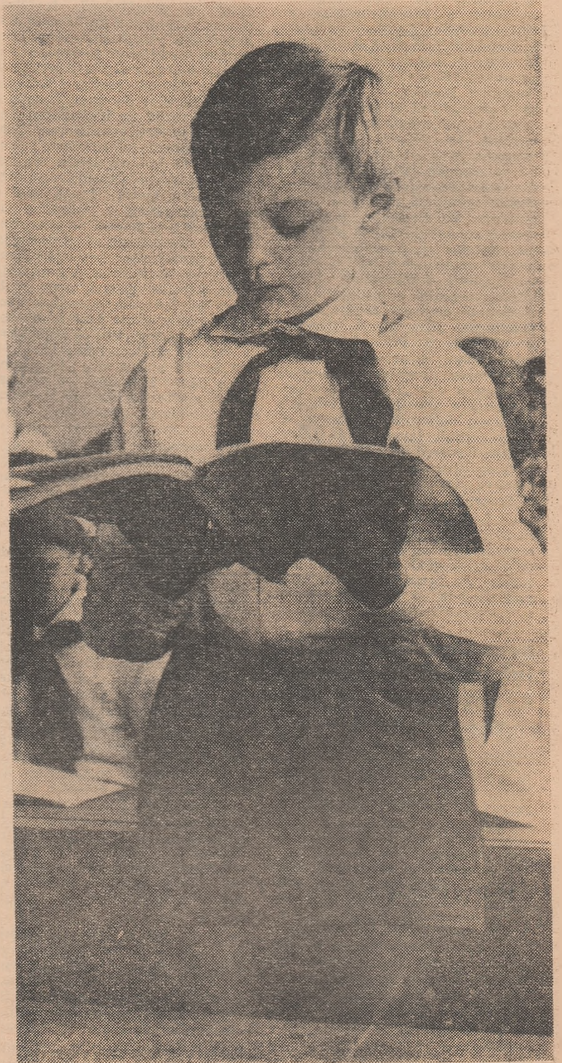
Lectură din noul manual