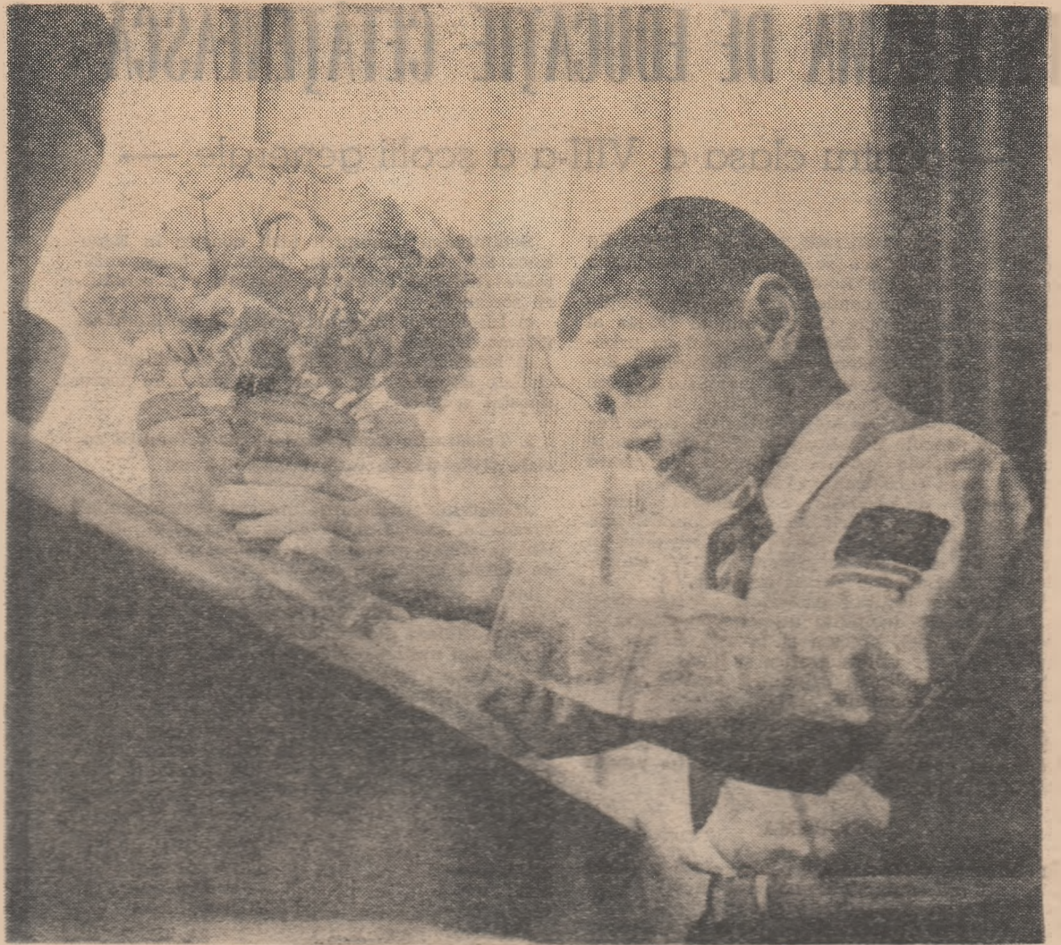
În clasă se naște încă un colț al frumuseții.

Îmbunătățindu-și necontenit stilul și metodele de muncă, organele sindicale din școlile de cultură generală și din institutele de învățământ superior vor aduce o contribuție și mai mare la creșterea eficacității procesului instructiv-educativ, la îndeplinirea cu succes de către lucrătorii din învățământ a mărețelor sarcini ce le revin din Directivele Congresului al IX-lea al Partidului Comunist Român, spre binele întregului nostru popor și al înfloririi necontenite a României Socialiste.