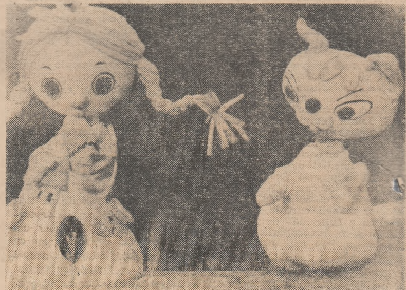
Scenă din spectacolul „Rochița cu figuri”, prezentat de Teatrul de păpuși din Cluj

Al treilea festival internațional al teatrelor de păpuși