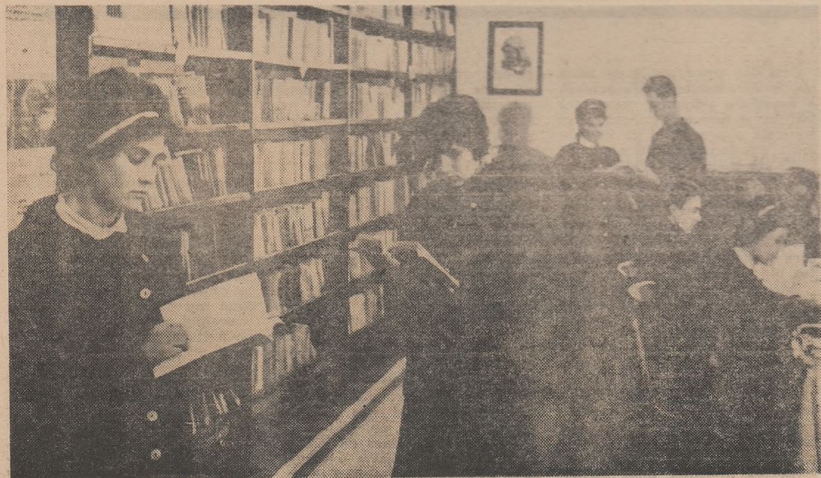
Bibliotecile școlare oferă elevilor posibilitatea unei largi documentări

În general noi, cei de la facultate, am dori ca liceele să ne trimită elemente înzestrate, cu cunoștințe precise, bine consolidate, pentru ca să putem trece cît mai repede la pregătirea în specialitate.