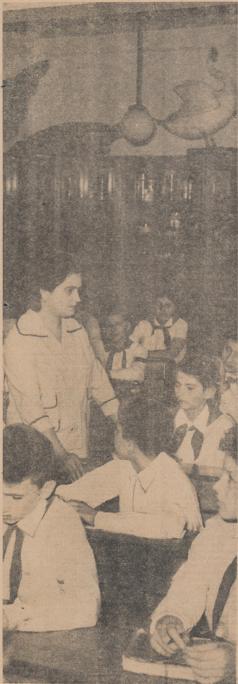
In laboratorul de științe naturale.