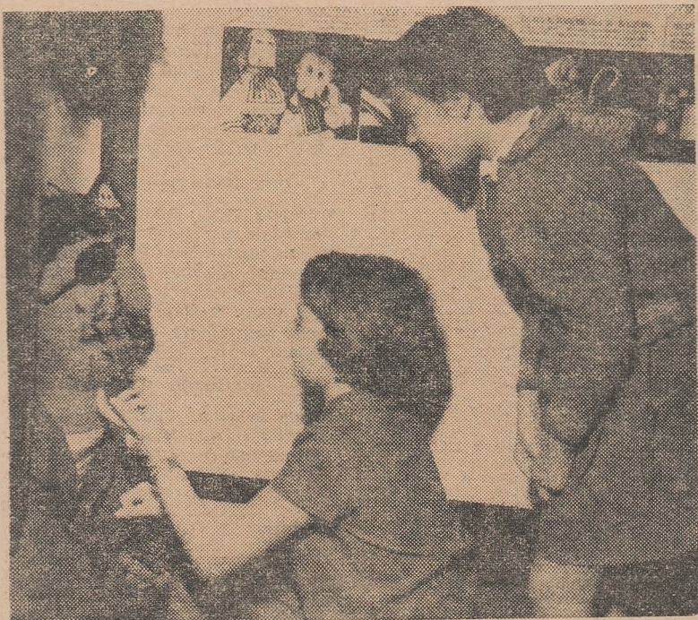
De vorbă cu păpușile — acești nelipsiți și dragi prieteni ai copiilor