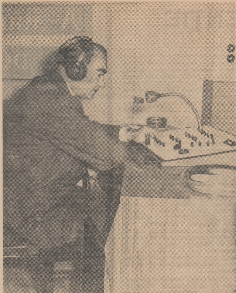
Masa de comandă a laboratorului lingvistic

rimentate cîteva serii de exerciții înregistrate, din care vom cita: un exercițiu de substituție a complementului direct exprimat prin substantiv, cu complementul exprimat prin pronume a). Se cer răspunsuri afirmative: Vocea profesorului: As-tu rencontré ton ami? Răspunsul elevului: Oui, je l'ai rencontré. b) Se cer răspunsuri negative: Vocea profesorului: Est-ce qu'elle a reçu ta lettre? Răspunsul elevului: Non, elle ne l'a pas reçue. S-au pus 8 întrebări de primul tip și 10 întrebări de tipul al doilea. Cum pentru fiecare întrebare înregistrată au fost necesare 3—4 secunde, iar „albul sonor” însuma 6—8 secunde, cele 18 întrebări, cu răspunsurile respective, n-au luat decît aproximativ 4 minute. Avantajele pe care le prezintă exercițiul înregistrat pe bandă au apărut în mod evident. Mai întii, prestigiul de care se bucură astăzi aparatele electronice în lumea tineretului școlar conferă întrebării înregistrate o autoritate suplimentară. Apoi, calitatea exercițiului înregistrat și, implicit, eficiența sa pedagogică sînt mai bune.