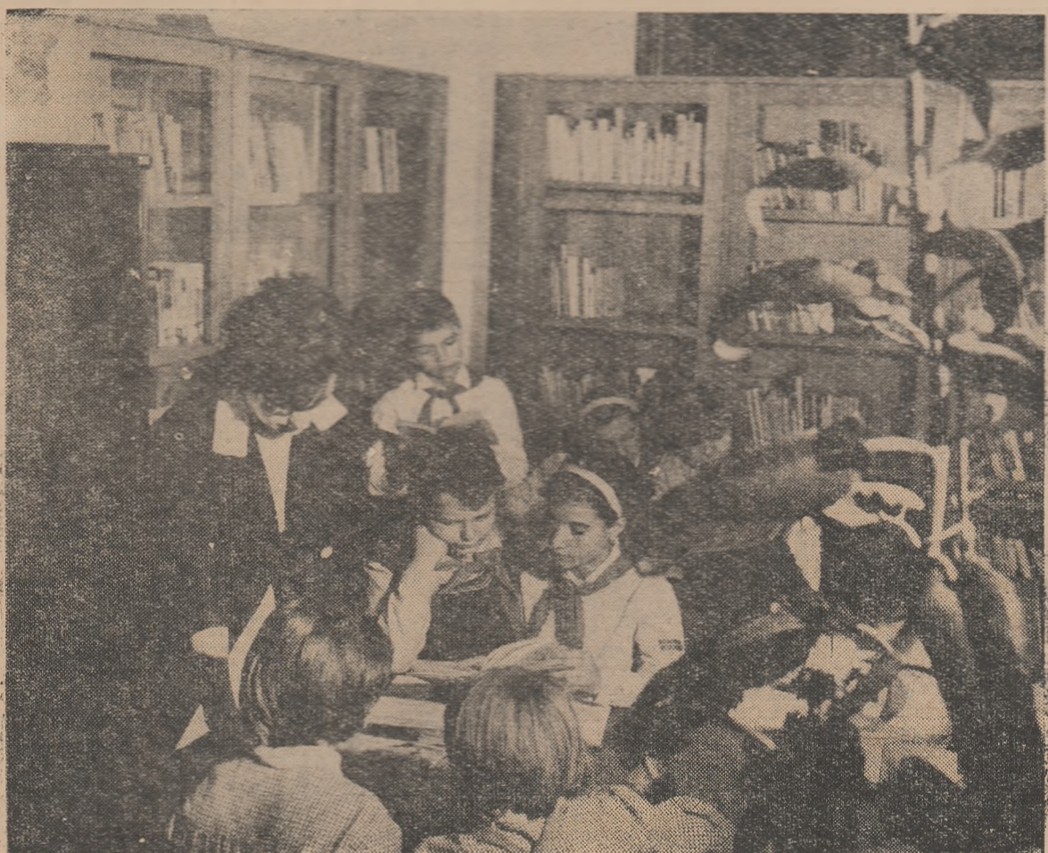
La bibliotecă au sosit noutăți literare