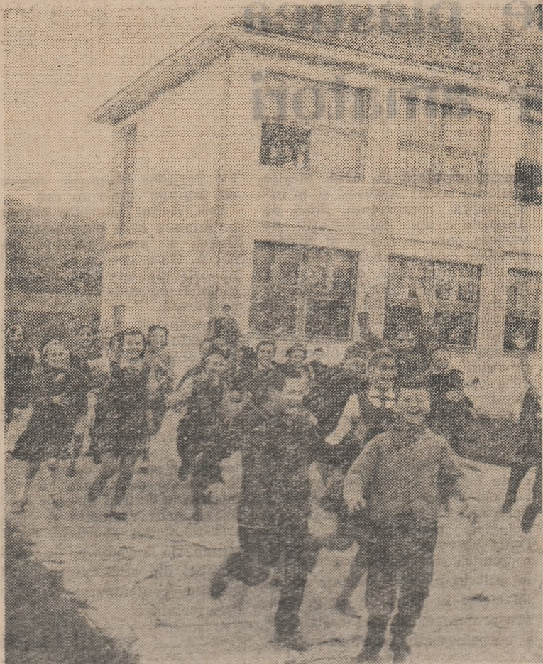
După ora de curs, este firesc să existe atîta dorință de mișcare.

Dezbateră acestor probleme în adunarea de darea de seamă și alegeri, ca și propunerile pe care le vor face participanții la discuții vor ajuta la stabilirea precisă a direcțiilor pe care să se meargă în viitor, astfel încît biroul grupei sindicale să poată ajuta cu mai multă eficacitate conducerea școlii în obținerea unor rezultate tot mai fructuoase, în îmbunătățirea continuă a procesului instructiv-educativ.