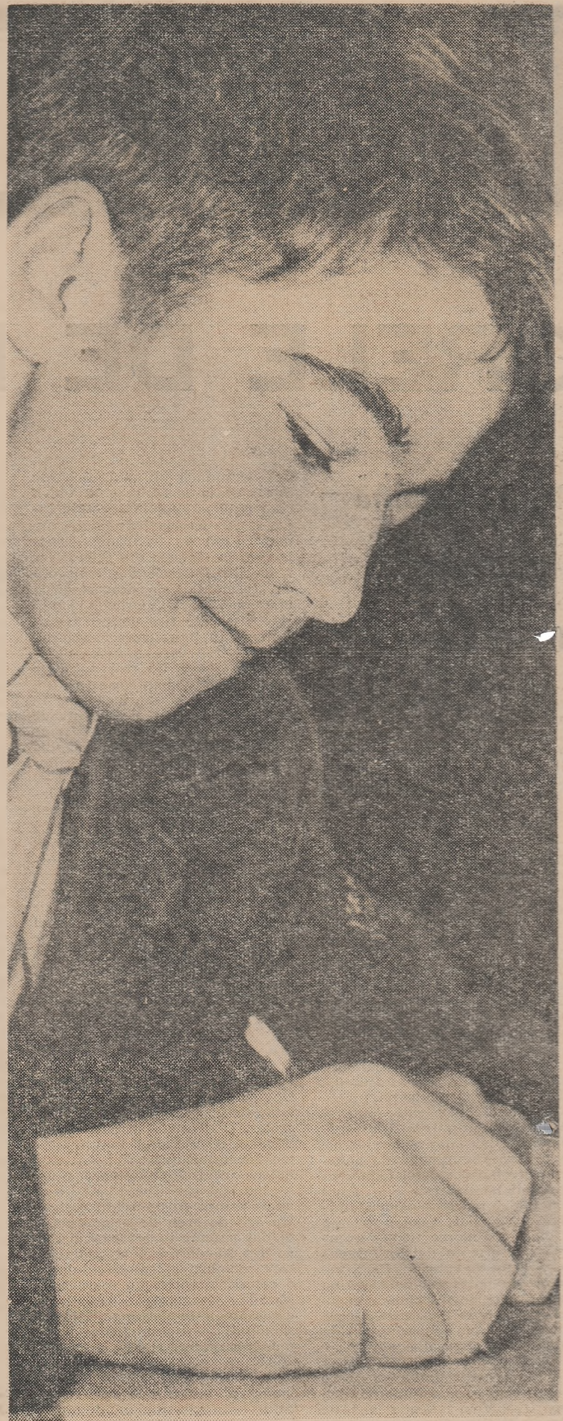
Notițe după explicațiile profesorului