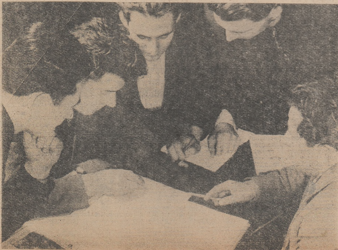
Muncitori și tehnicieni de la Combinatul minier din Petroșeni, elevi în învățămîntul fără frecvență, discută înaintea unei ore de consultații pentru a stabili împreună problemele asupra cărora vor cere lămuriri profesorului.

Dragi învățători și profesori, cînd printre elevii pe care îi aveți în grijă se ivește cite unul teribil de dificil, gîndiți-vă bine dacă nu e unul din frații sau surorile spirituale ale acestei fete mici.