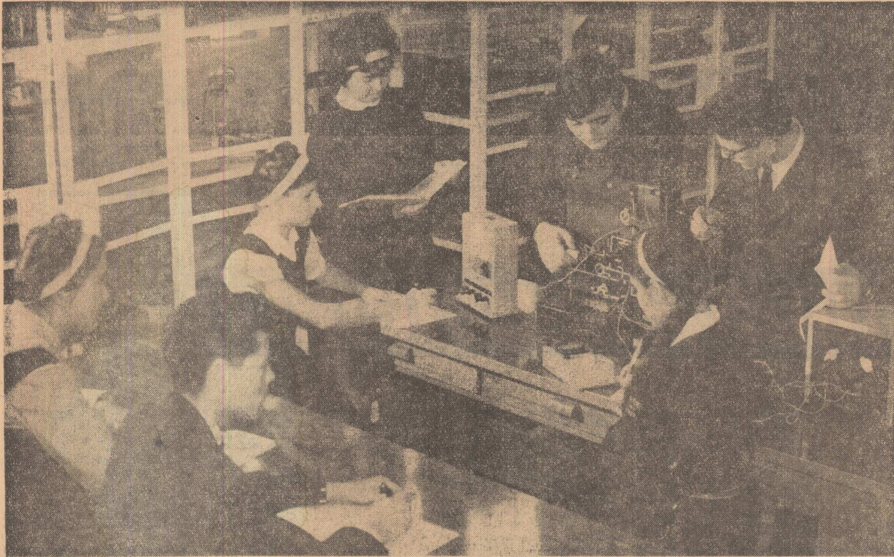
Vizitii absolvenți se pregătesc pentru examenul de maturitate.

EDITATĂ DE MINISTERUL ÎNVĂȚĂMÎNTULUI ȘI COMITETUL UNIUNII SINDICATELOR DIN ÎNVĂȚĂMÎNT ȘI CULTURĂ