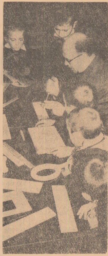
La cercul minilor îndeminate de la Casa pionierilor din Timișoara