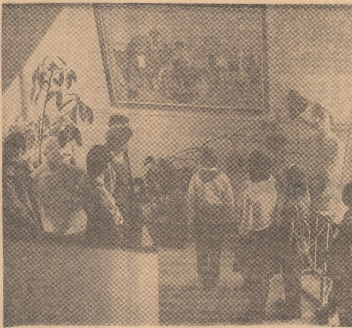
Opere de artă și plante ornamentale, lumină și curățenie — elemente educative în cadrul școlii

Există așadar, multe căi de îmbunătățire a educației sanitare a elevilor. Călea principală este, așa cum a rezultat din discuția noastră, colaborarea strînsă dintre personalul pedagogic și personalul medico-sanitar. S-a văzut că orele de dirigenție pe teme sanitare se impune să fie ținute de medic sau de diriginte, în nici un caz de sora sanitară, care nu are competența necesară. Se impune să fie îmbunătățite materialele pe baza cărora se desfășoară aceste ore, astfel încît ele să răspundă și cerințelor pedagogice. Și, în sfîrșit, să nu se uite că, dacă personalul medico-sanitar din școală I se cere în mod îndreptățit să subordoneze activitatea obiectivelor generale ale procesului instructiv-educativ, învățătorii și profesorii nu se pot considera „scuții” de sarcinile educației sanitare, ci nu datorită de a participa nemijlocit la realizarea acestor sarcini. Nici un pedagog nu poate trata cu indiferență problemele de care depinde dezvoltarea armonioasă a elevilor. Este nevoie să se creze în fiecare școală un front comun pentru rezolvarea tuturor problemelor — majore și mărunte — ale educației sanitare, să se asigure influența educativă asupra elevilor prin munca și prin exemplul personal al fiecărui pedagog.