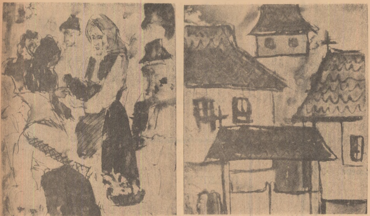
Doi dintre creațiile elevilor. Liceul de arte plastice din București.

Este o tradiție a liceelor de arte plastice ca, odată cu sfârșitul fiecărui an școlar, elevii să plece la practică.