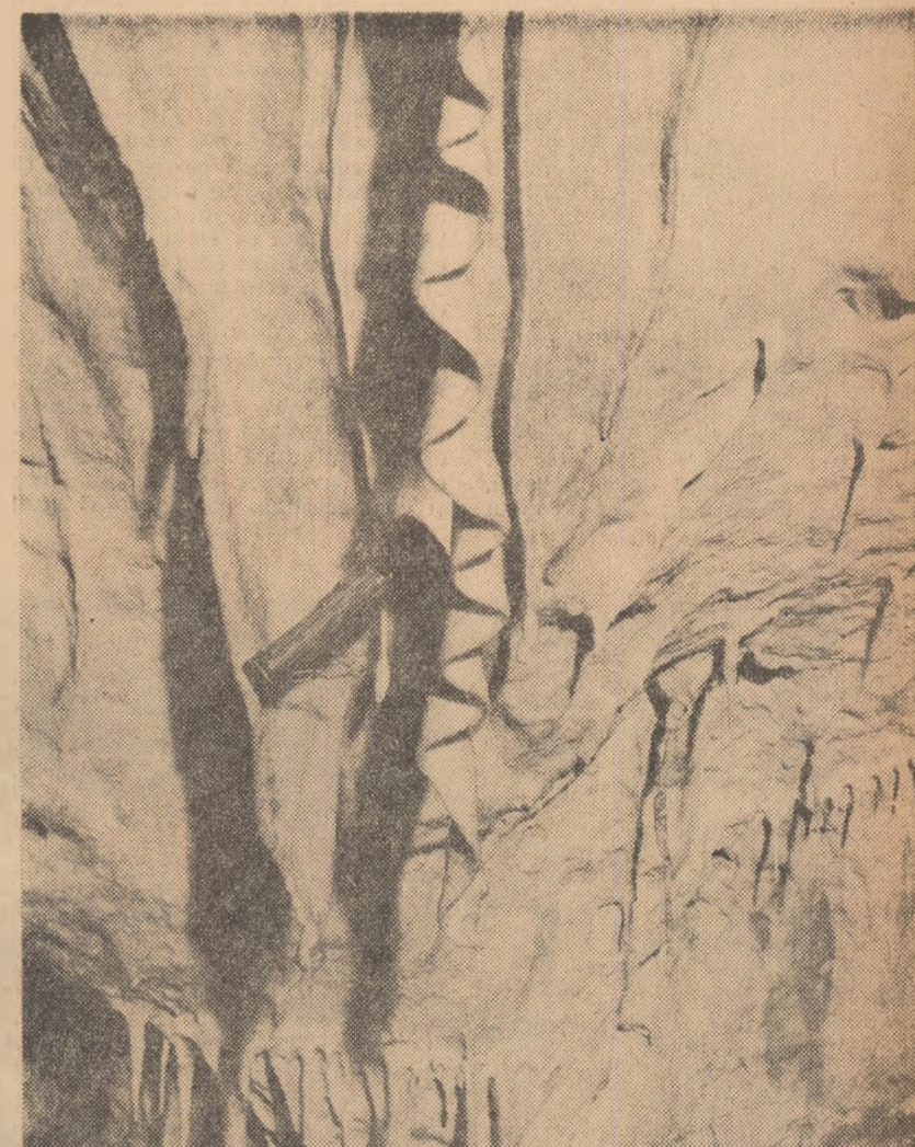
Peștera Muierii din Carpații Meridionali, situată în defileul de la Baia de Fier, desfășoară vizitatorului o feerică lume de basm. Farmecul peisajului se împletește cu interesul științific, oferind un motiv în plus pentru includerea ei în itinerarele excursiilor școlare.