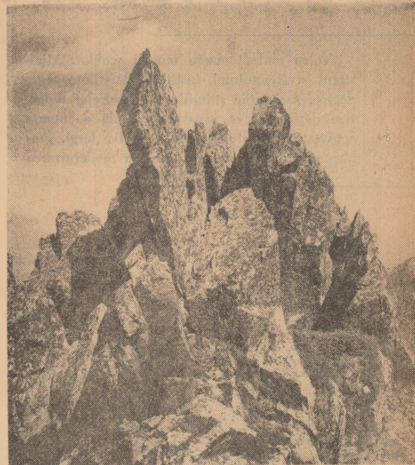
Stincile din Retezat au deseori înfășări de legendă, multe din ele fiind legate de eposul popular. Ele produc asupra vizitatorului o puternică impresie de masivitate, dominînd de departe Valea Mureșului și coamele domoale ale Munților Apuseni. În clișeu citeva stînci de pe muntele Peleaga (Retezat).