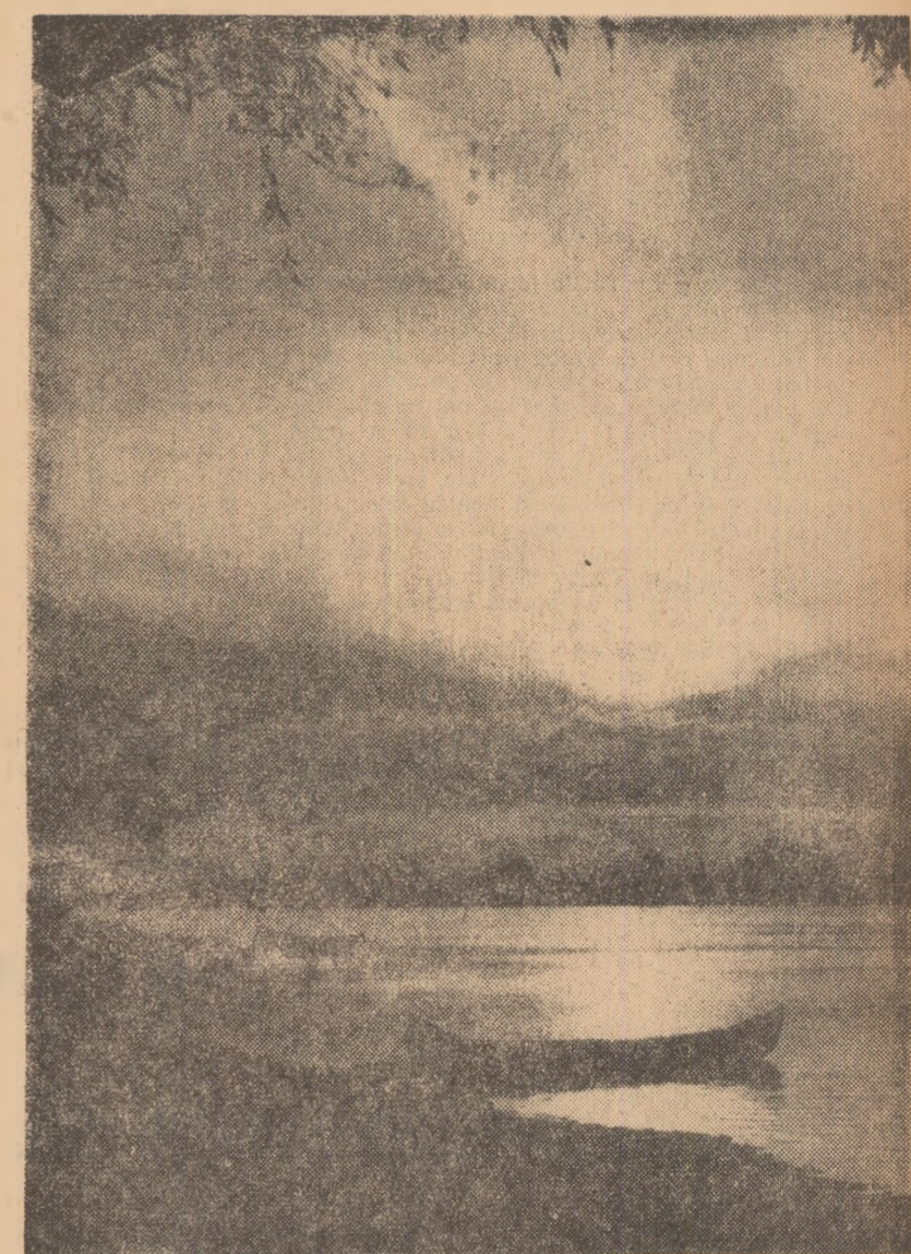
Răsăritul și apusul soarelui adaugă paletile naturale de culori a peisajului Deltei o aureolă de-a dreptul emoționantă-lată un apus de soare.