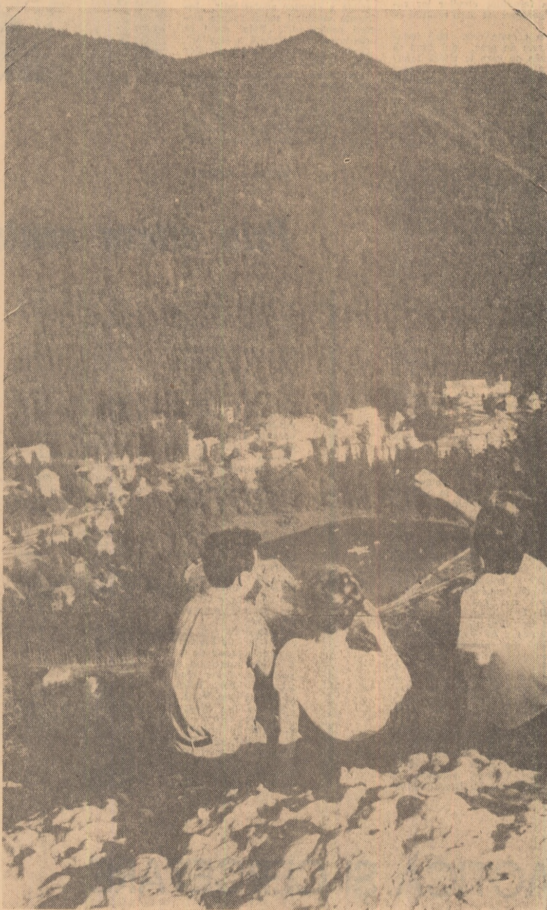
În frumoasa stațiune Tușnad.