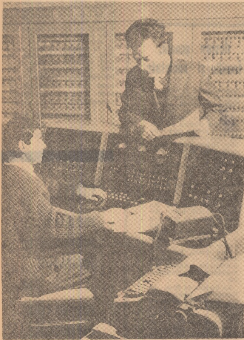
Sala de mașini CIFA-3 de la Universitatea din București — discuție înainte de a introduce problema în mașina de calcul.

Societățile științifice ale cadrelor didactice au un important rol pe linia perfecționării profesionale. Desfășurîndu-se în permanență pe planul muncii de informare științifică, precum și pe cel al acțiunilor de cercetare metodic-științifică, activitatea acestor societăți determină în mod direct ridicarea nivelului general al procesului de învățământ.